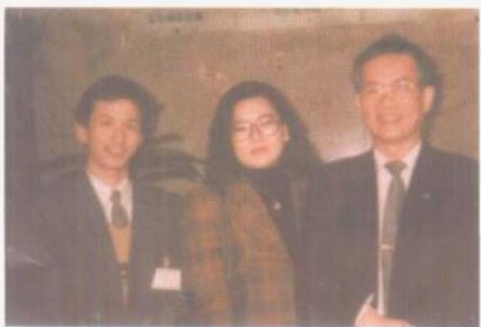
1.孔垂成讲师与世界名人、台湾预防医学家、经络刮痧创始人吕季儒教授和其夫人吴玉贞女士合影