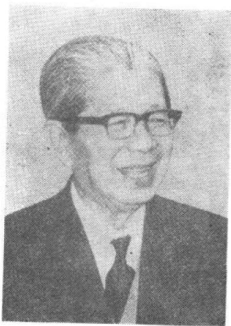
常 书 鸿

1904年生于浙江杭州，满族。1927年赴法国，学习西洋油画。1936年回国，被国民政府教育部聘为教授。1943年出任国立敦煌艺术研究所所长。长期致力于敦煌艺术的研究和保护工作。新中国成立后，曾任敦煌文物研究所所长、兰州艺术学院院长、中国美术家协会常务理事、国家文物局顾问等职。现为全国政协委员、敦煌研究院名誉院长。曾创作大量的油画作品，其中有许多在国内外获奖。著有《我与敦煌》、《敦煌艺术》、《敦煌的风铎》等。