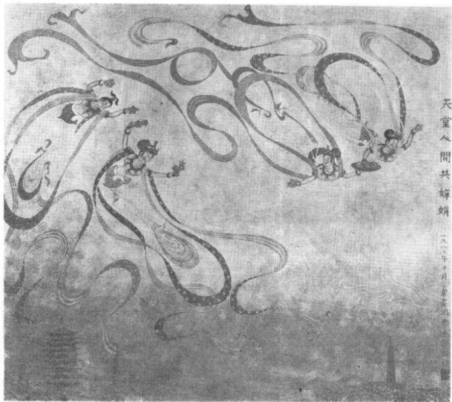
飞 天 之 图 ——常书鸿·李承先合作1988