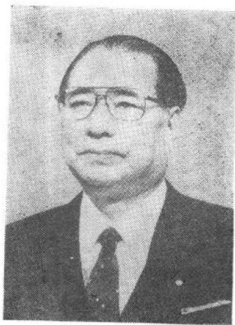
池 田 大 作

1904年生于浙江杭州，满族。1927年赴法国，学习西洋油画。1936年回国，被国民政府教育部聘为教授。1943年出任国立敦煌艺术研究所所长。长期致力于敦煌艺术的研究和保护工作。新中国成立后，曾任敦煌文物研究所所长、兰州艺术学院院长、中国美术家协会常务理事、国家文物局顾问等职。现为全国政协委员、敦煌研究院名誉院长。曾创作大量的油画作品，其中有许多在国内外获奖。著有《我与敦煌》、《敦煌艺术》、《敦煌的风铎》等。