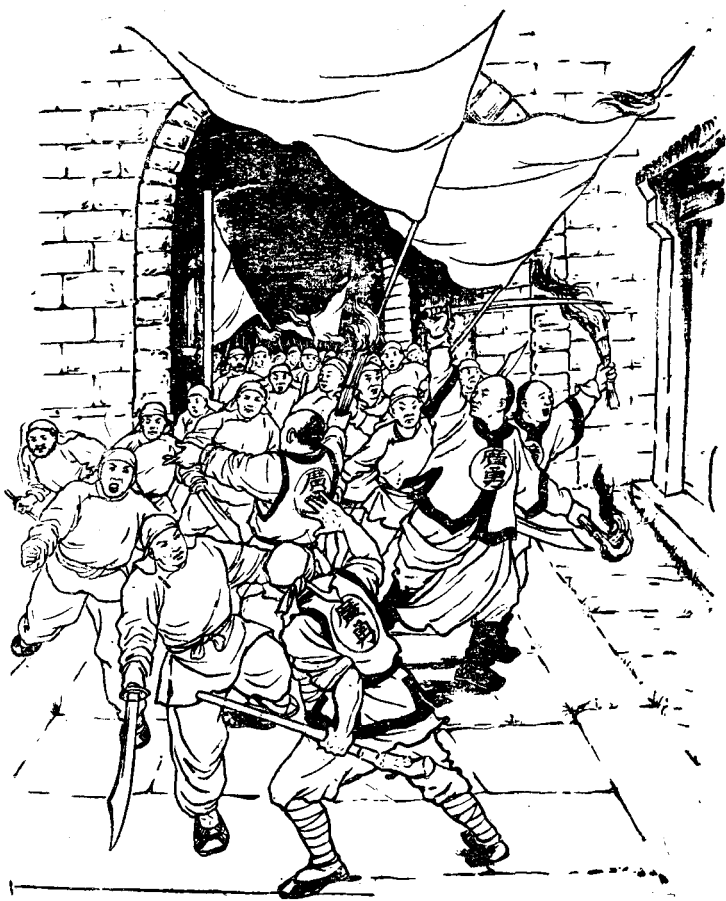
广勇打开城門迎接起义軍进城