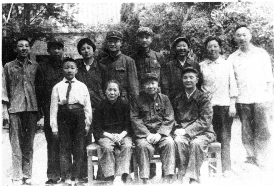
↑ 张云逸同志全家合影