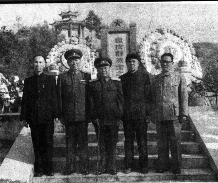
↑ 张云逸（中）与广西领导同志在韦拔群烈士墓前