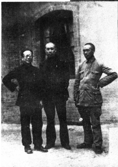
← 劳山遇险后张云逸与周总理、孔石泉合影留念