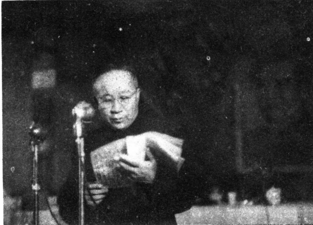
1950年张云逸与 胡志明会见 →