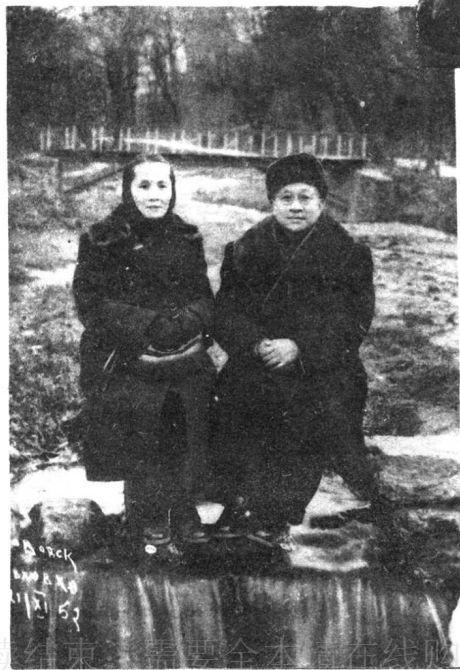
← 1952年张云逸和夫人韩 碧在苏联疗养