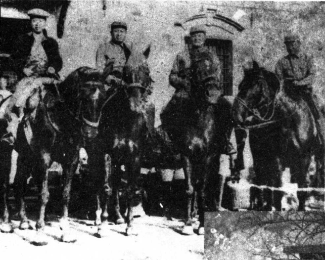
← 1939年5月合影于新四军江北指挥部。军长叶挺（左一）、参谋长张云逸（右一）、赖传珠（左二）、罗炳辉（右二）。