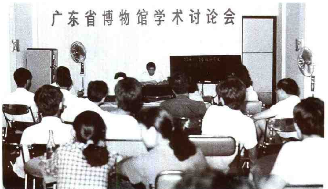
八十年代后期，▶ 我馆在光孝寺召开学术研讨会。