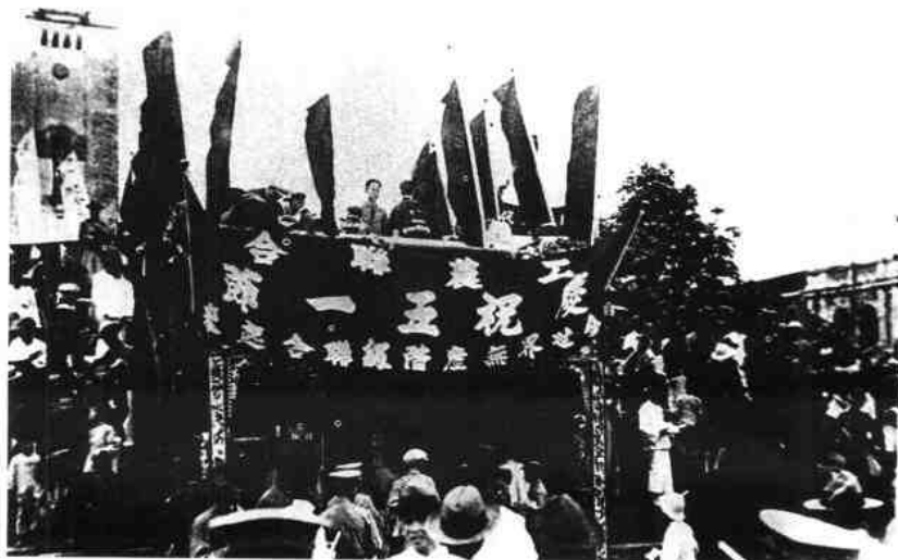
▶ 1925年5月1日全国工人代表团、全省农民代表团等在革命广场召开联合大会，庆祝“五一”劳动节，左侧为钟楼。