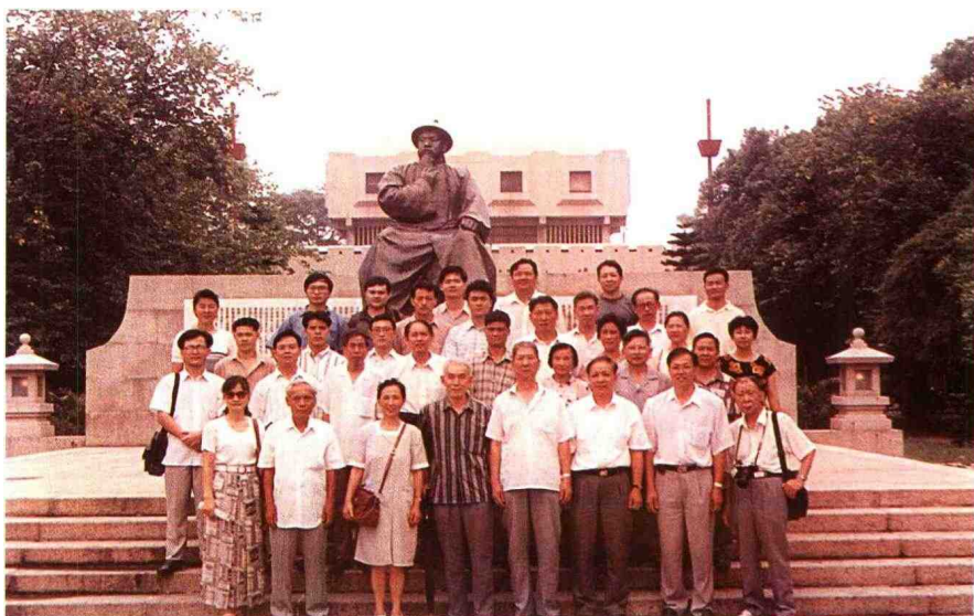
馆党总支组织党员和入党积极分子赴虎门鸦片战争博物馆参观学习时留影。