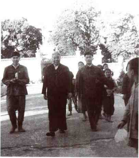
▲ 1961年许广平同志(中)参观鲁迅纪念馆。