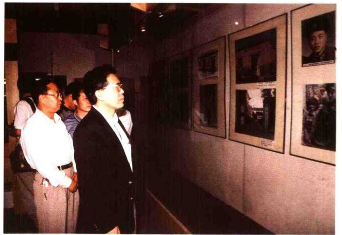
▼ 1996年10月,广东省省长卢瑞华来馆观看“孔繁森同志事迹展览”。