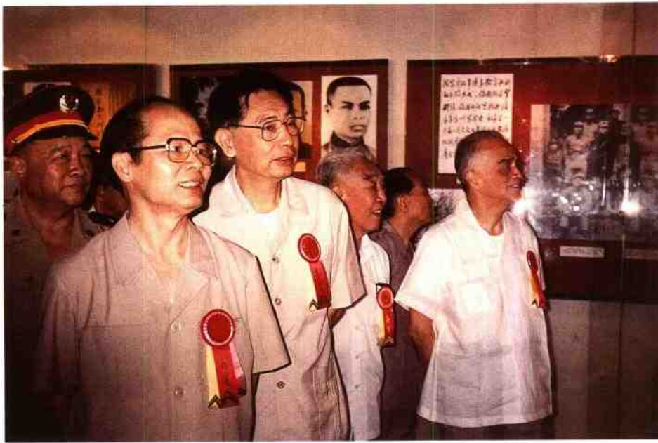
◀ 1994年5月8日，中共中央政治局委员、广东省委书记谢非(左二)、省长朱森林(左三)和老同志梁灵光(右一)在我馆参观“邓小平大型图片展览”。