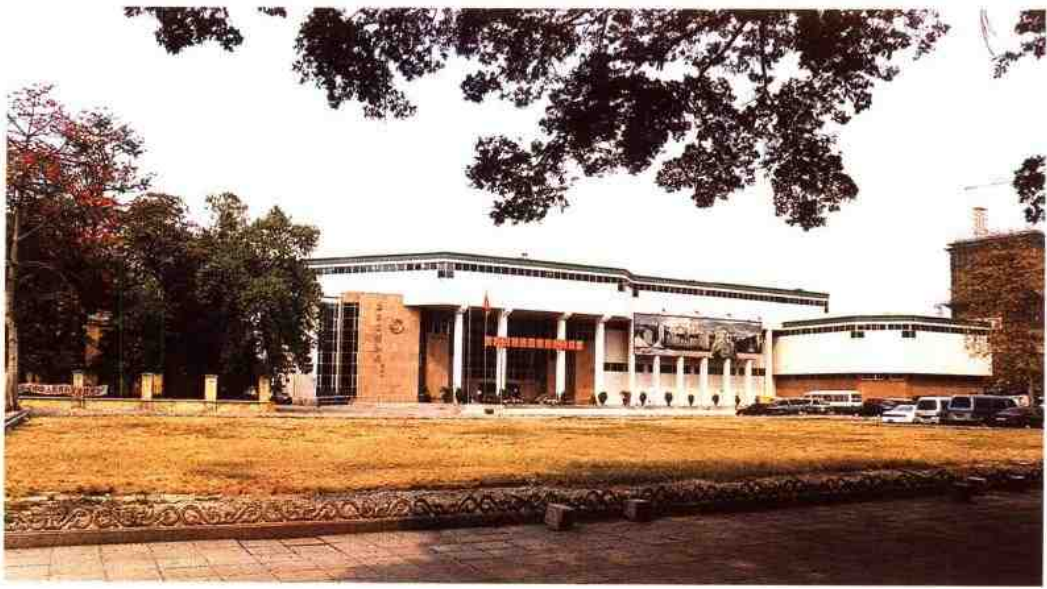
▲ 1992年新建的陈列大楼。