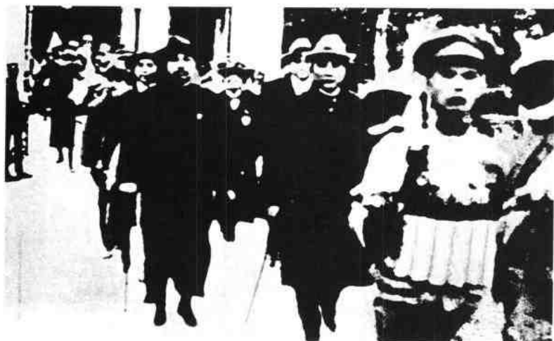
◀ 1924年1月20-30日，在钟楼礼堂召开中国国民党第一次全国代表大会，图为孙中山先生（中）与大会代表步出会场。