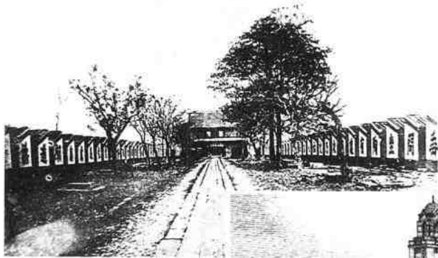
◀ 广东贡院（红楼）始建于康熙23年（1684）。图为民国时期的贡院旧址明远楼和东西号舍，今我馆陈列大楼建筑在东侧号舍遗址上。