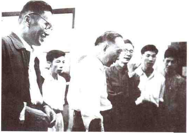
▲ 六十年代郭沫若同志(左三)在我馆副馆长蔡语邨(左四)、林卓华(左二)陪同下参观鲁迅纪念馆。

1979年,广东省委书记吴南生同志▶ 在我馆参观刘昌潮画展后挥笔留 题。