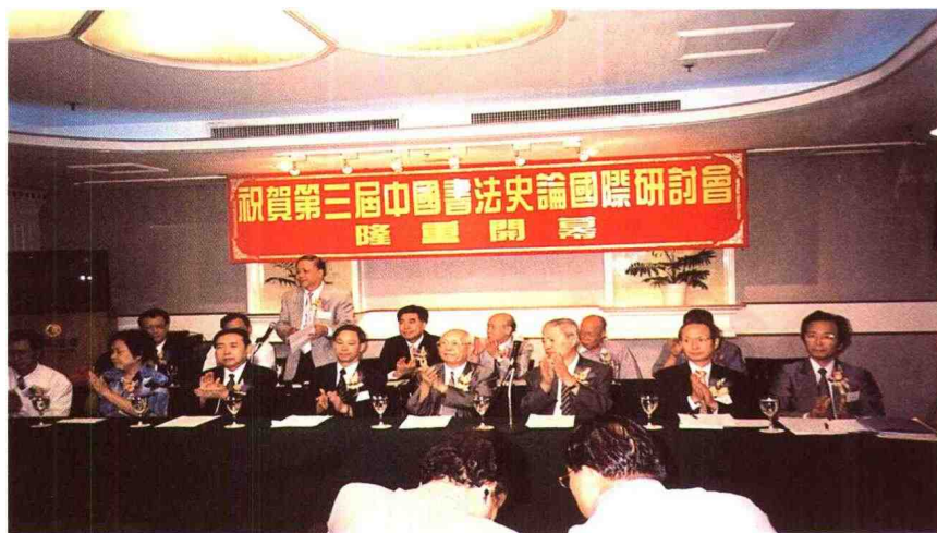
1998年9月,由我馆和文物出版社、澳门书法家协联合主办的“第三届中国书法史论国际研讨会”在澳门举行,图为开幕式盛况。