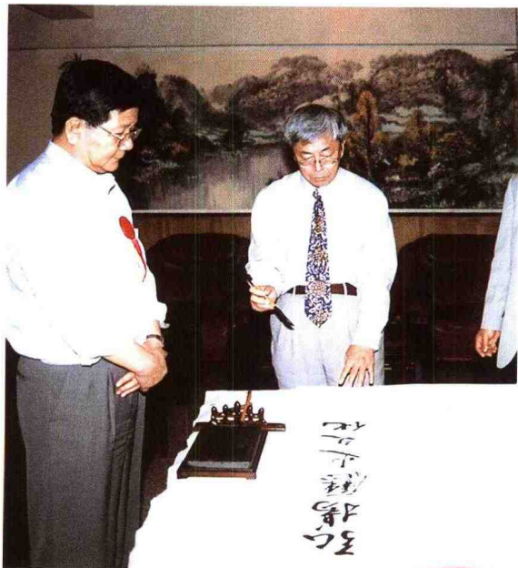
◀ 1998年11月16日,国家文物局局长张文彬来馆参加“商承祚先生捐赠文物精品展暨《商承祚先生捐赠文物精品选》首发式”后挥笔留题:“弘扬历史文化传统,振奋中华民族精神”。左为广东省文化厅副厅长薛连山。