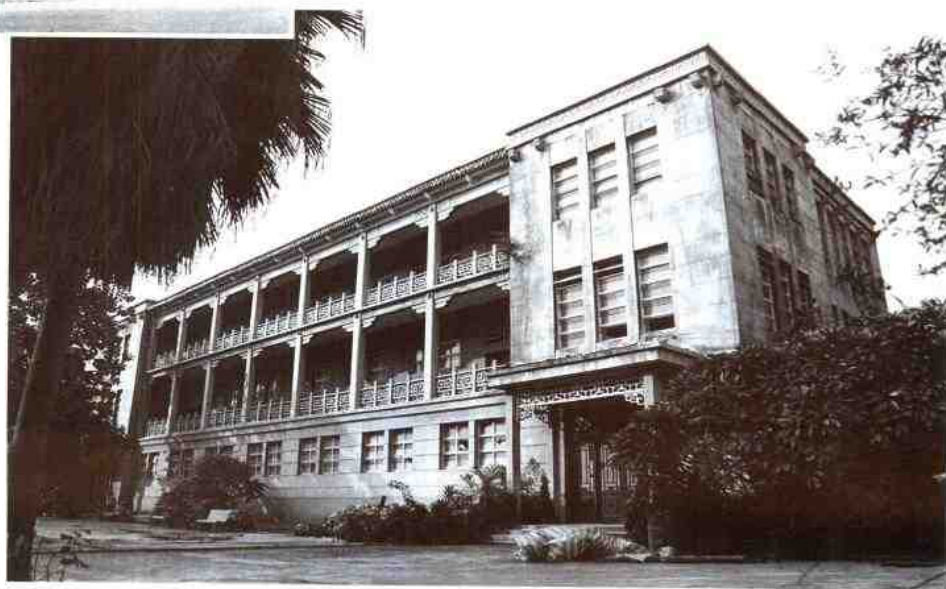
1959年建成的陈列大楼 ▶ 外景。