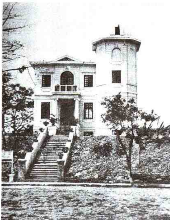
▲原中山大学天文台外景。