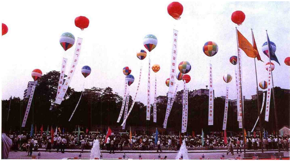
▲ 1994年9月21日,广东省改革开放成就展览在我馆开幕, 图为开幕式盛况。