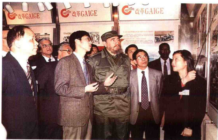
▶ 1996年,古巴国务委员会主席卡斯特罗(中)在副省长卢钟鹤(右二)、馆长邓炳权(左一)陪同下参观“广东省改革开放成就展”。