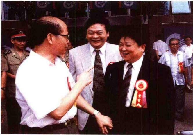
▲ 1994年9月21日,中共中央政治局委员、广东省委书记谢非(左一)、省委宣传部部长于幼军(中)、文化厅厅长阎宪奇在我馆参加“广东省改革开放成就展”开幕式时亲切交谈。