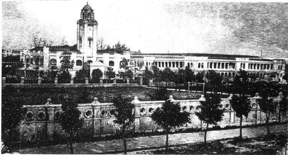
▶ 1918年钟楼全景及周边环境，1927年鲁迅先生在中山大学任教时居此处二楼西侧。