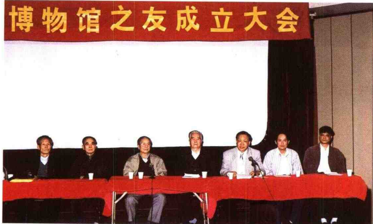
◀ 1999年1月,原广州市人大常委会主任欧初同志来馆参加“广东省博物馆之友成立大会”,主席台就座的依次为(左起):陶瓷专家宋良璧、书画鉴定专家苏庚春、欧初、“广东省博物馆之友”会长孔玉峰、馆长邓炳权、副馆长萧洽龙、莫鹏。