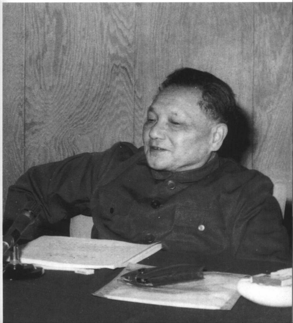
6. 1978年12月，邓小平在中共十一届三中全会上。