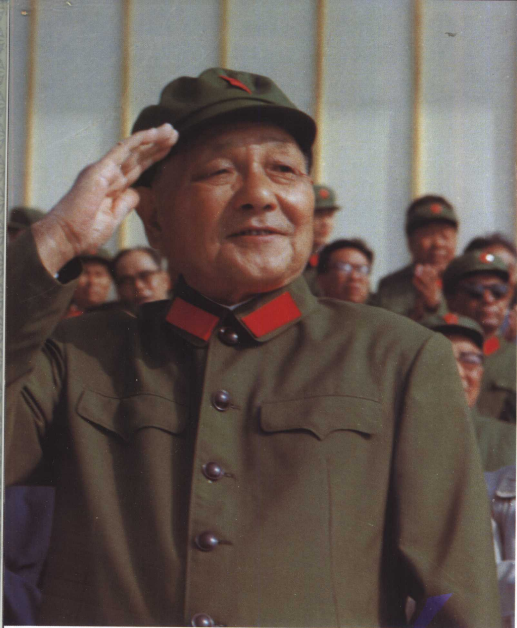
7、1981年9月，中共中央军委主席邓小平在华北某地检阅人民解放军陆、海、空三军部队。