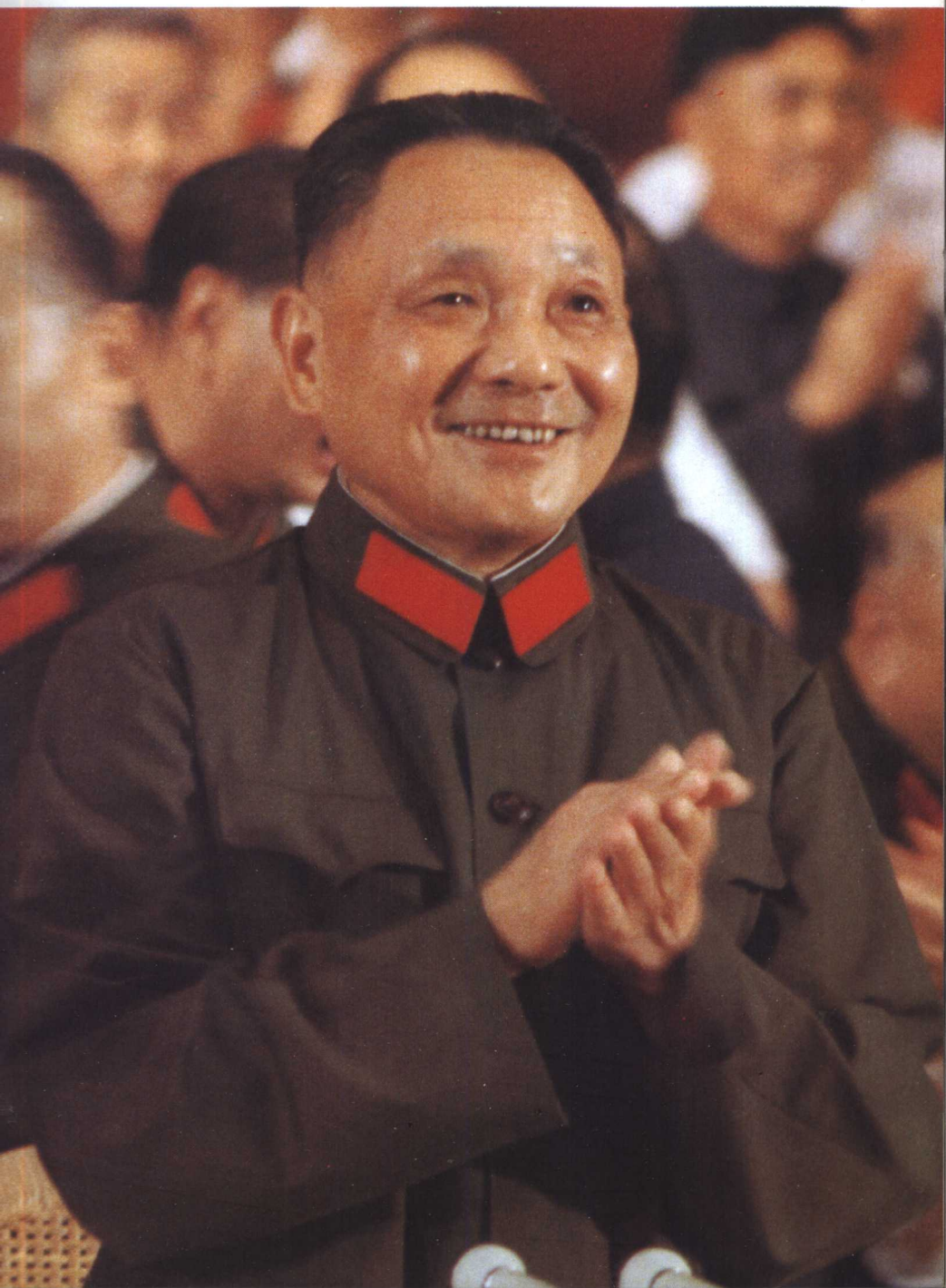
4、1977年8月，邓小平在庆祝中国人民解放军建军50周年大会上。