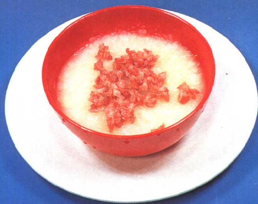
火腿土豆泥 (35 页)