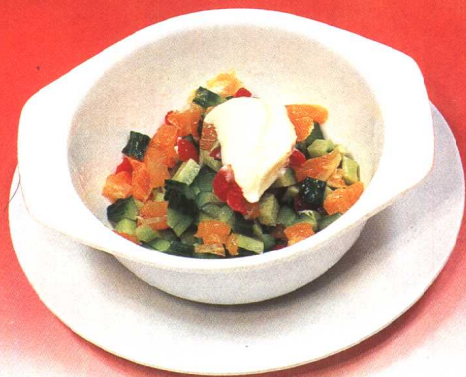
黄瓜色拉 (57 页)