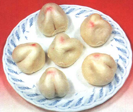
豆沙鲜桃 (74 页)