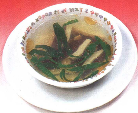
鸡血豆腐汤 (65 页)