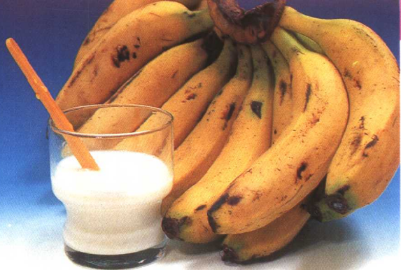
香蕉蜂蜜牛奶 (21 页)