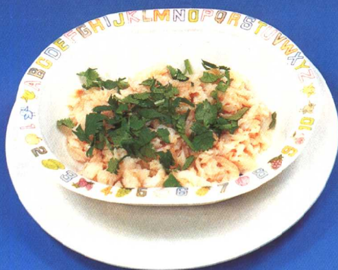
拌鱼米 (91 页)