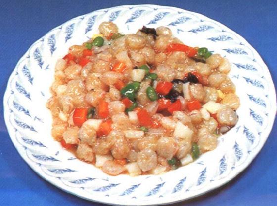
五彩虾仁 (64 页)