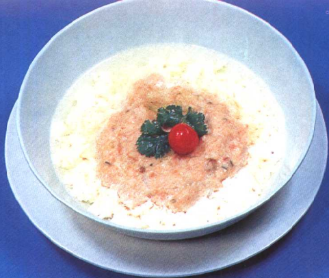
蒸肉豆腐 (46 页)