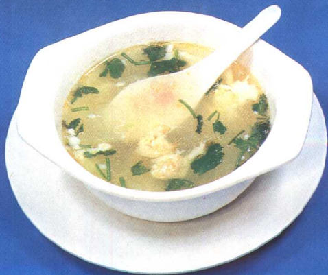
海米冬瓜汤 (77 页)