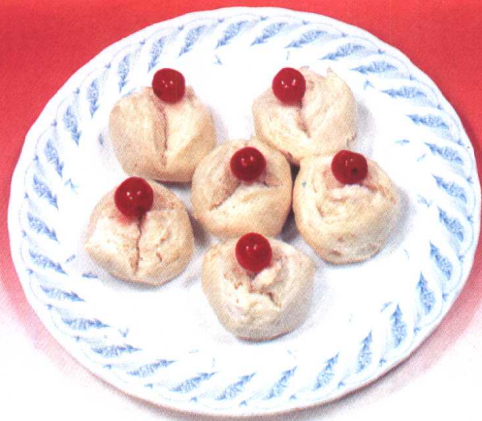
樱桃开花馒头 (101 页)