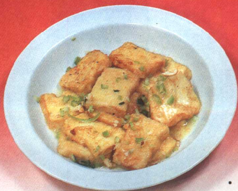
锅塌豆腐 (82 页)