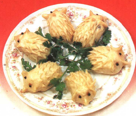
糖馅小刺猬 (103 页)