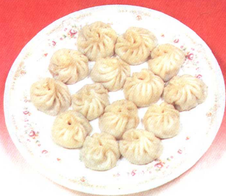
菜肉小包子 (76 页)