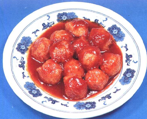
溜番茄丸子 (60 页)