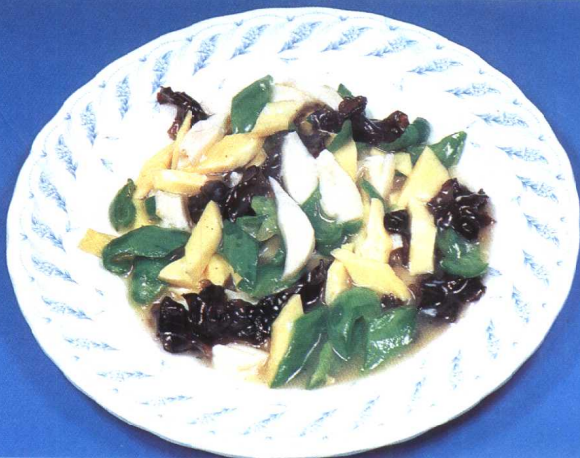
三色蛋糕 (88 页)