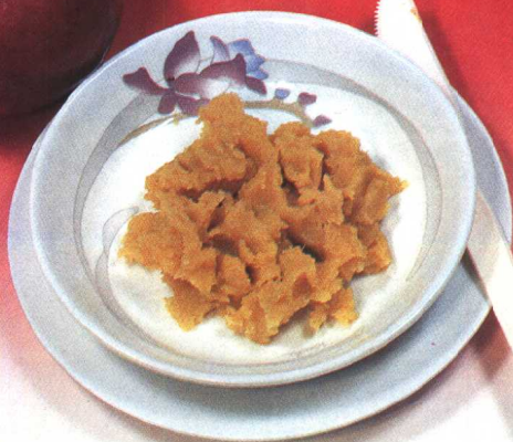
苹果金团 (29 页)