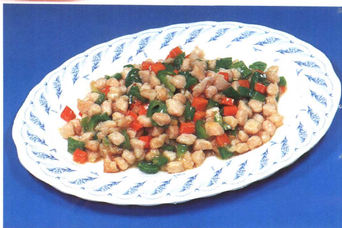
炒三色肉丁 (85 页)