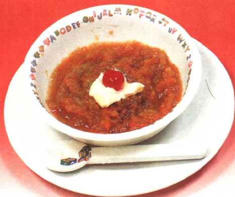
胡萝卜泥 (23 页)