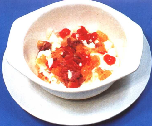
水果拌豆腐 (46 页)