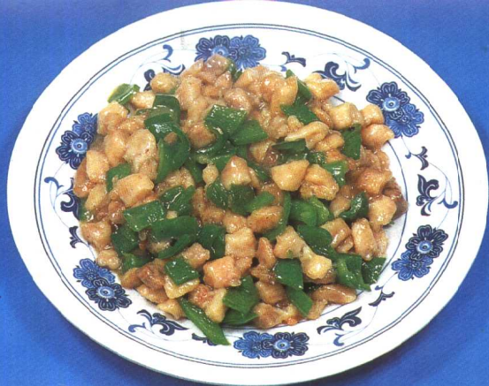
青椒鱼仁 (62 页)