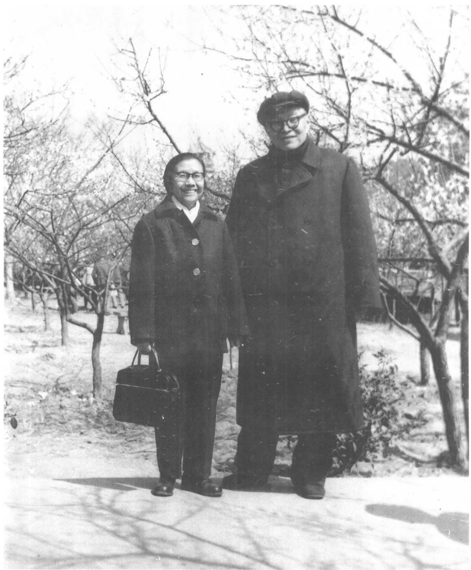
1976年7月张闻天与夫人刘英在无锡梅园