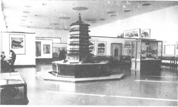
中国历史博物馆陈列厅一瞥