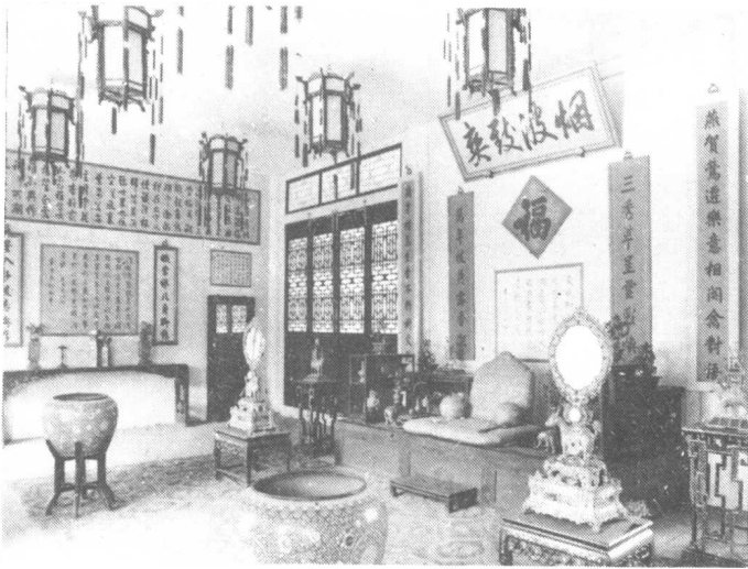
承德避暑山庄博物馆宫廷复原陈列之一处