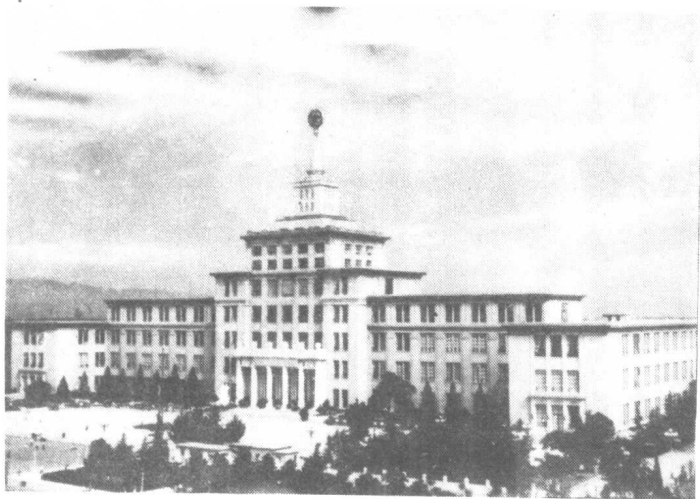
中国人民革命军事博物馆