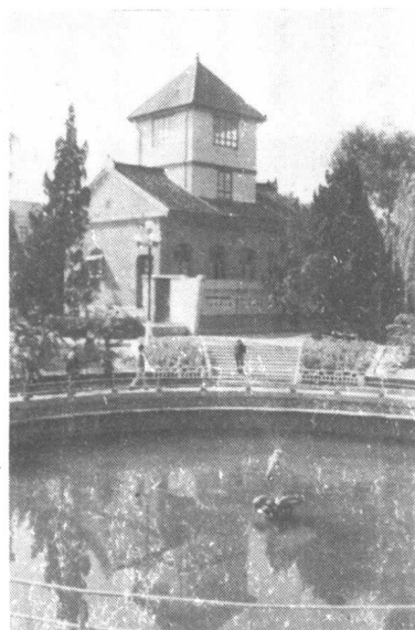
南通博物苑中馆，建于1906年