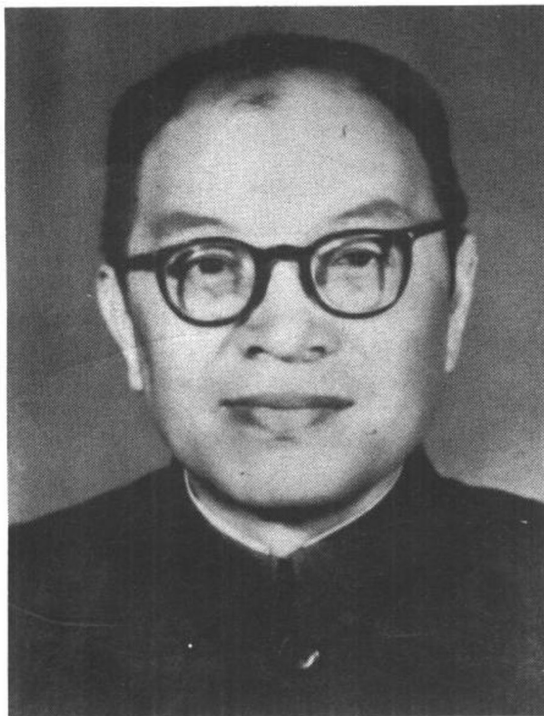
张 闻 天