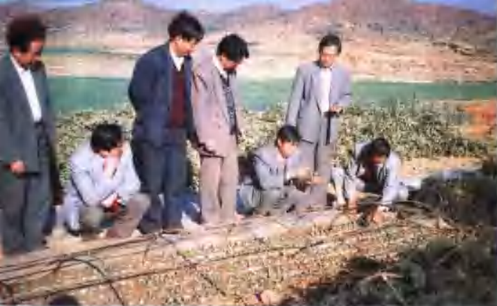
县委、县政府领导检查烟苗长势