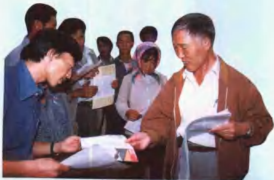
行长带头上街宣传银行业务知识