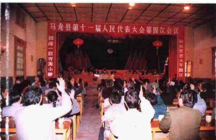
县人大四次会议召开