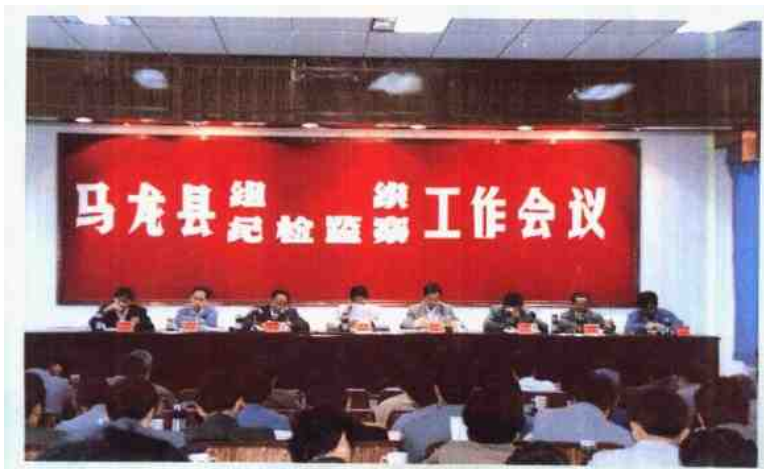
组织、纪检监察工作会议