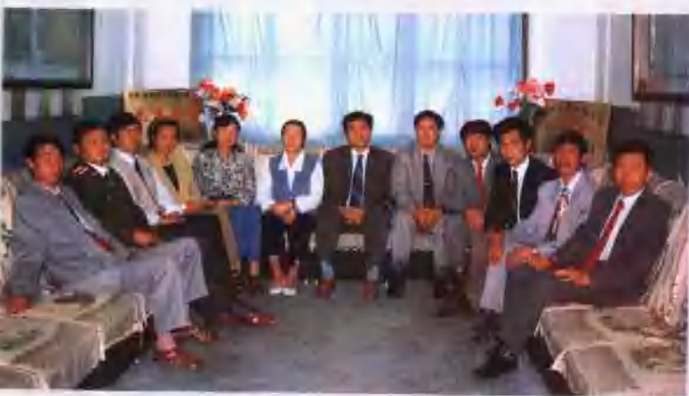
团结战斗的领导班子

通泉镇地处县城, 全镇总面积 157.13 平方公里, 1995 年末, 总人口为 19486 人, 其中少数民族 255 人, 下辖 7 个办事处, 54 个村(社), 总耕地面积 26598 亩, 其中水田 13727 亩, 人均耕地 1.36 亩。年内, 在县委、县政府的领导下, 进一步深化改革, 坚持对外开放, 开拓进取、不断创新, 国民经济和社会发展取得了瞩目的成就。全镇国民生产总值达 3272 万元。农村经济总收入 3600 万元, 比 1990 年增 101%, 人均纯收入 910 元; 粮食总产 986.4 万公斤, 人均有粮 506 公斤。在传统农业稳步发展的同时, 乡镇企业有了较快的发