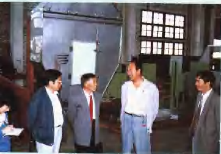
深入东光机械厂调查生产经营情况