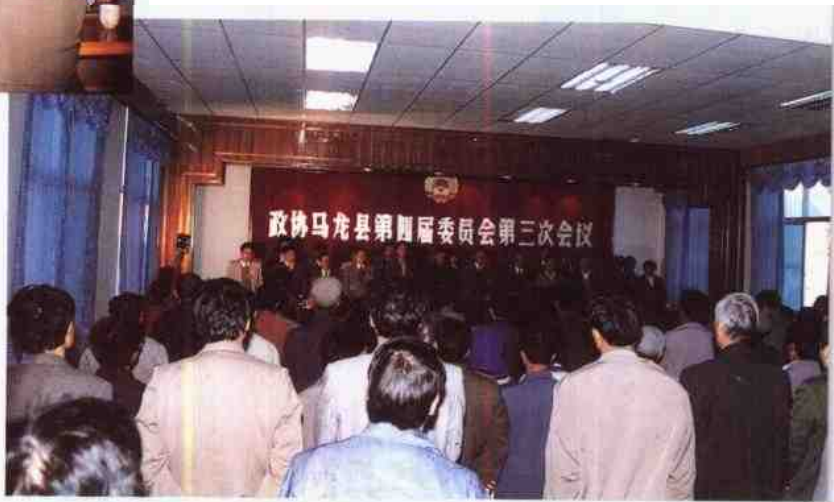
政协四届三次会议