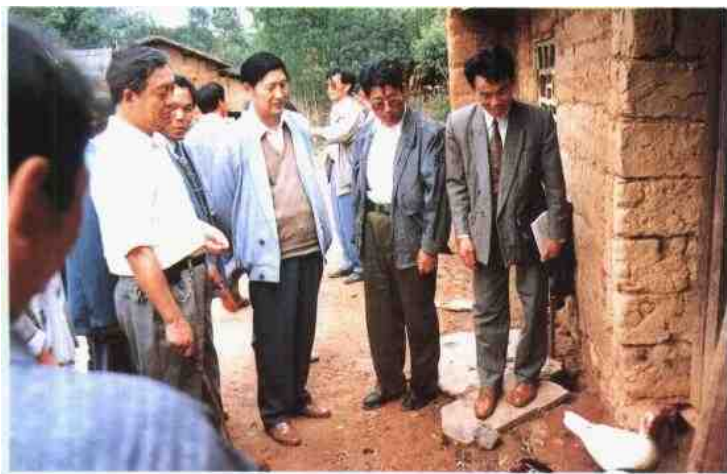
地委书记程政宁在马龙视察工作