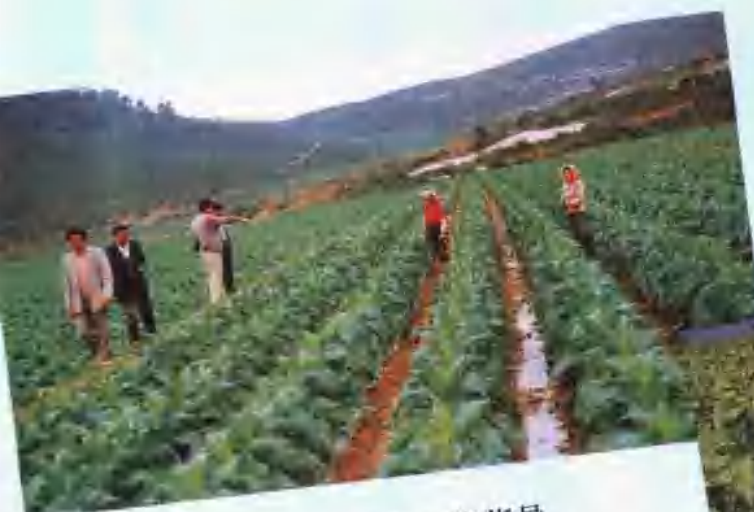
深入地块进行指导