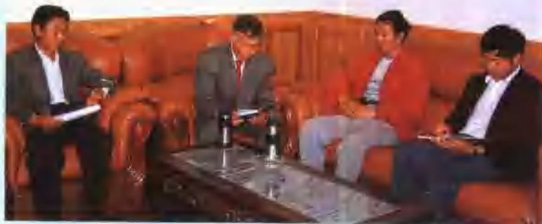
团结开拓的领导班子

马龙县工商银行分设11年来,认真贯彻执行国家经济和金融工作总的方针、政策,紧紧围绕调整信贷结构,强化资产负债管理,不断提高社会效益和经济效益。同时,努力加强思想政治工作,党、政、工、团齐抓共管,全行干部职工同心协力,开拓进取,使各方面的工作都取得了较好成绩,多次被评