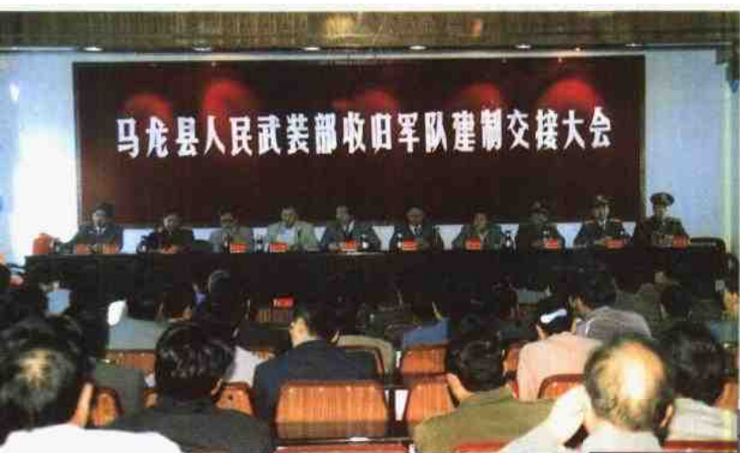
人武部收归军队交接 大会