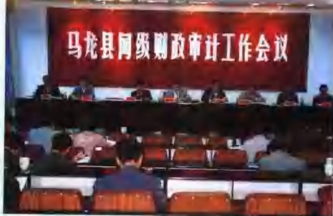
同级财政审计工作会议