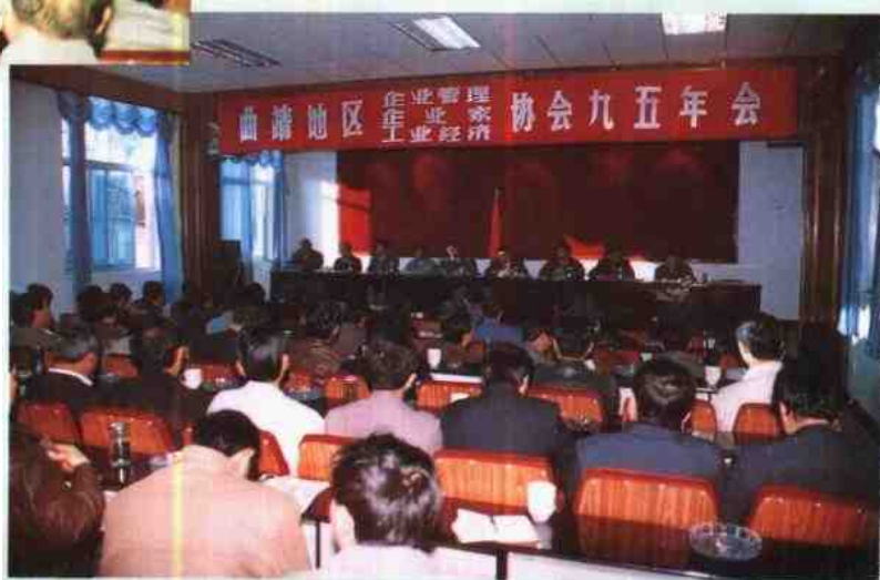
全区“三协会”九五年 会在马龙召开