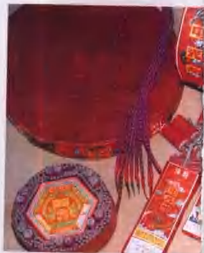
乡镇企业生产的电光炮