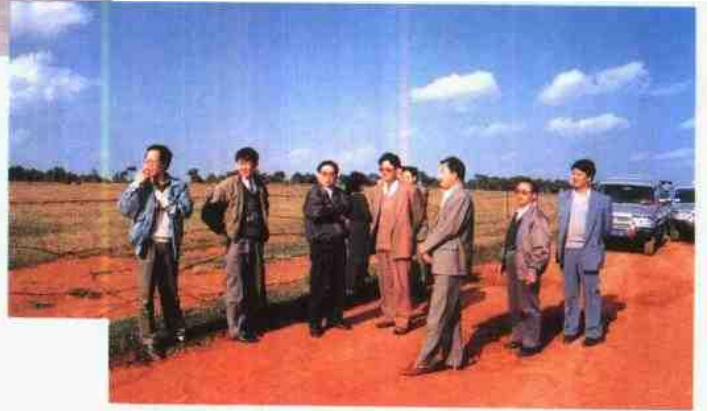
省人大副主任白佐光 到马龙调查换届选举情况