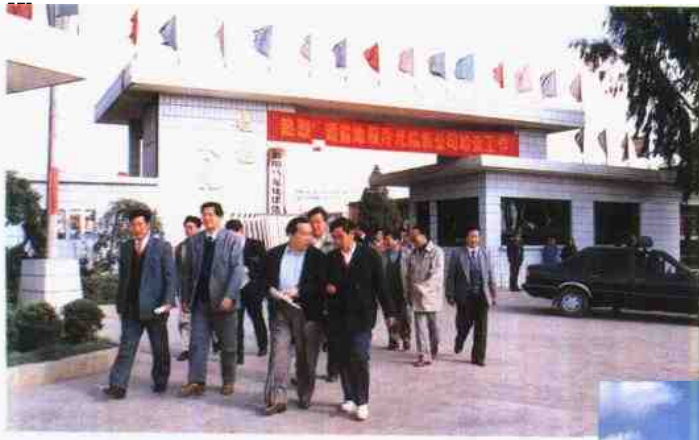
省委副书记、副省长李 嘉廷到马龙视察工作