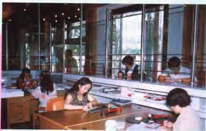
热情为客户办理业务