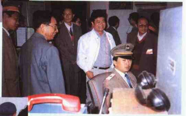
原省委老领导高治国 视察马龙时欣然题词