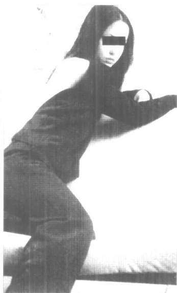
二十六份骗色骗钱犯罪档案