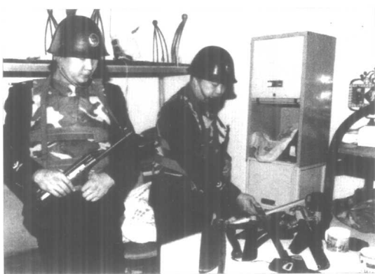
特大系列杀人抢劫案