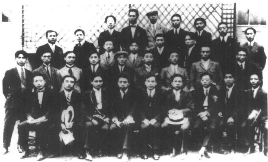
1924年，中国社会主义青年团旅欧之部部分成员在巴黎合影。前排左四为周恩来，左六为李富春，左一为聂荣臻，后排右三为邓小平。