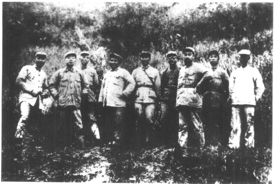
1933年12月，和红军第一方面军部分领导人在福建建宁合影。左起叶剑英、杨尚昆、彭德怀、刘伯坚、张纯清、李克农、周恩来、滕代远、袁国平。