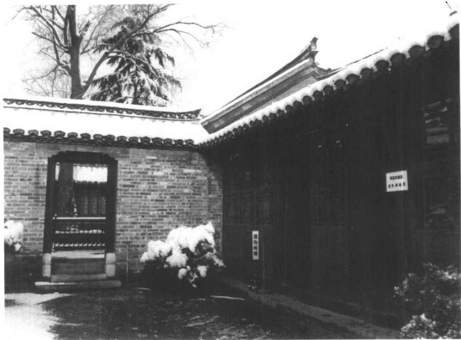
1898年3月5日，周恩来诞生在淮安城内驸马巷的这所住宅。