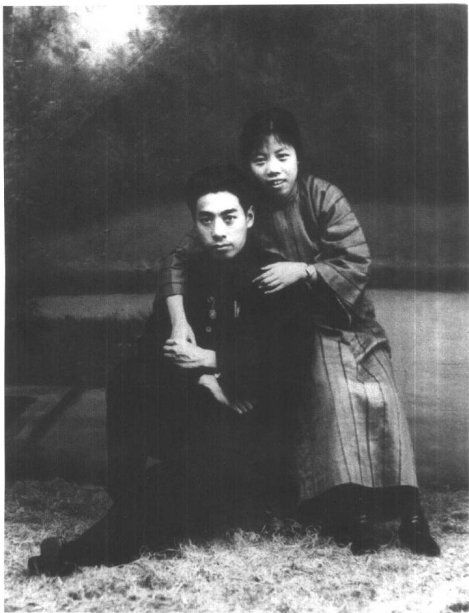
1925年8月8日，周恩来和邓颖超在广州结婚。这是1926年他任广东东江各属行政委员时和邓颖超在汕头合影。