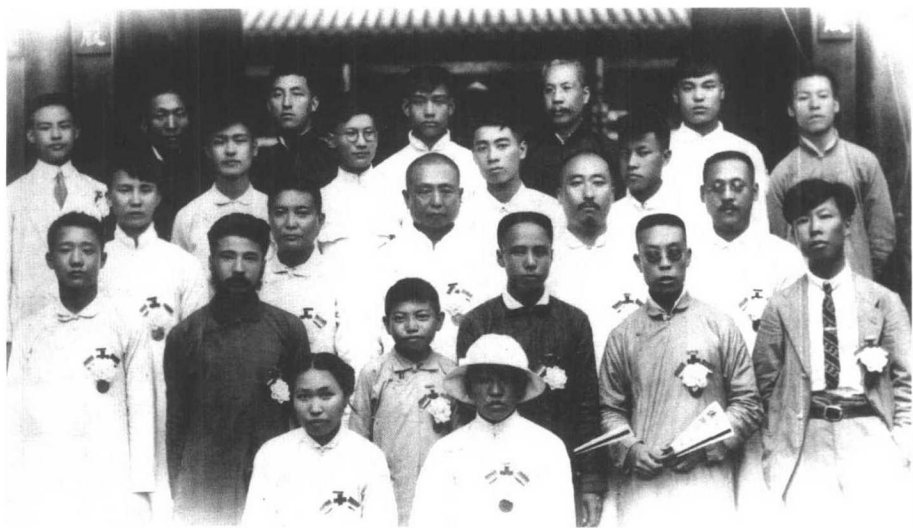
1920年1月，周恩来等在反帝爱国运动中被北洋军阀政府天津警察厅拘捕。在他们坚决斗争和各界爱国群众的声援下，反动当局被迫于7月将他们释放。这是周恩来等获释后的合影。