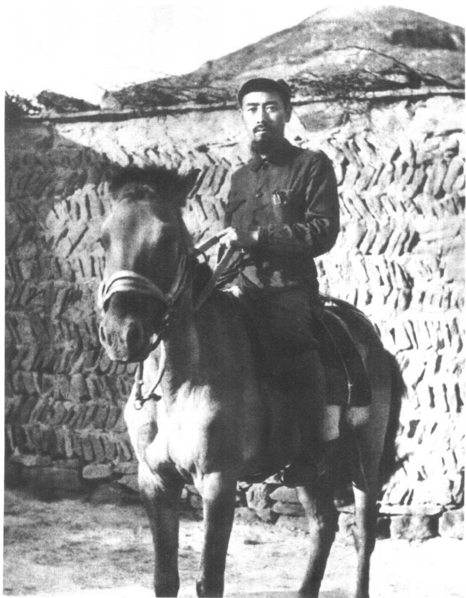
红军长征到达陕北后的周恩来。