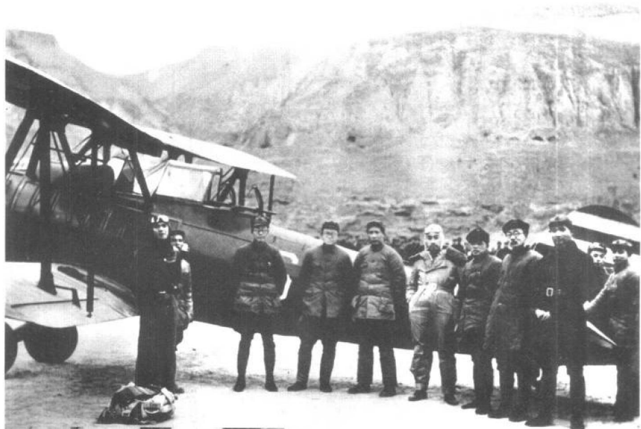
西安事变和平解决后，周恩来返抵延安时，在机场受到中共中央领导人欢迎。左三起：秦邦宪、张闻天、毛泽东、周恩来、彭德怀、林伯渠、萧劲光。