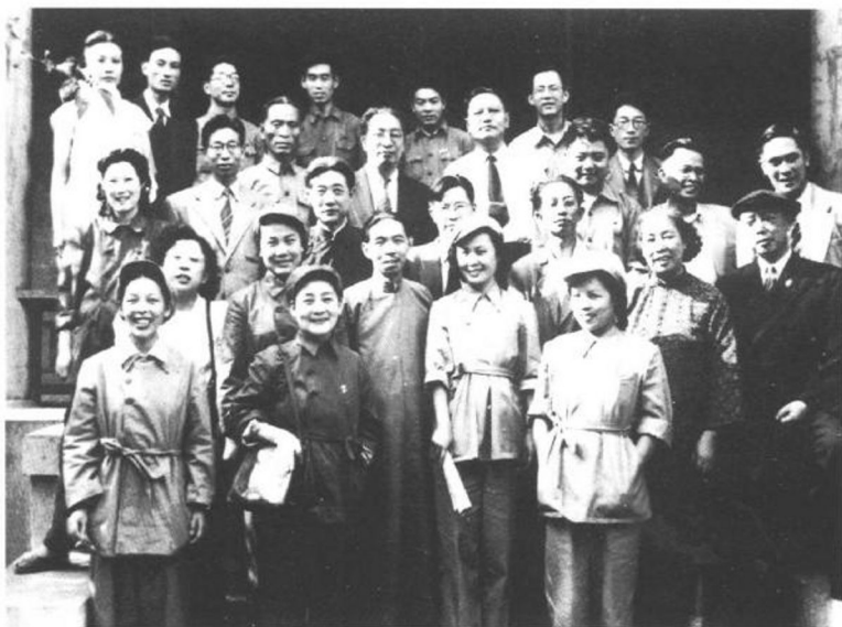
1949年7月茅盾与参加第一次文代会的部分代表合影。