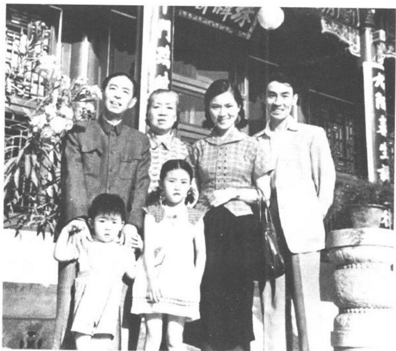
1959年7月，茅盾夫妇与儿子、儿媳、孙女、孙儿同游颐和园。