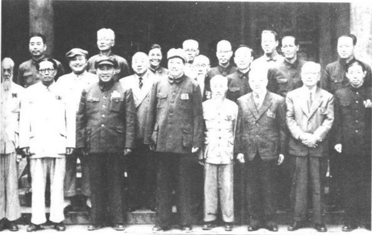
1949年6月，新政治协商会议筹备会在北平成立，茅盾为筹委会常务委员。