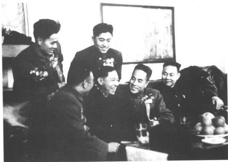
1954年2月，茅盾在南京与华东地区战斗英雄亲切交谈。