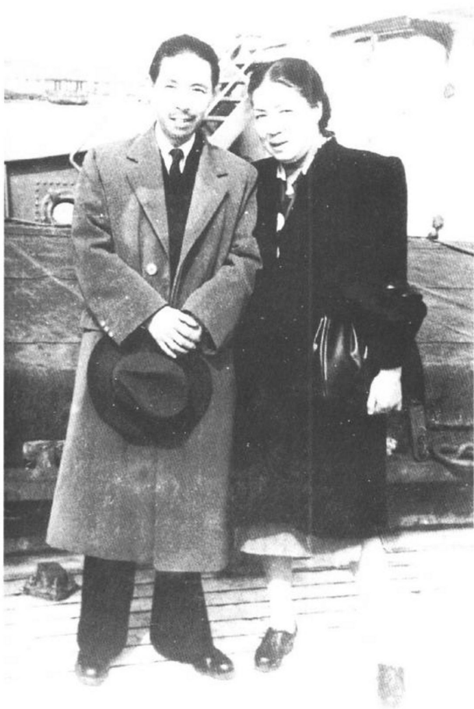
1947年4月，茅盾夫妇访问苏联后回到上海。