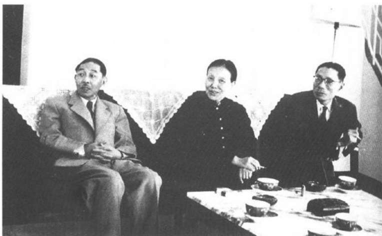
1962年2月茅盾与冰心、夏衍摄于香港。