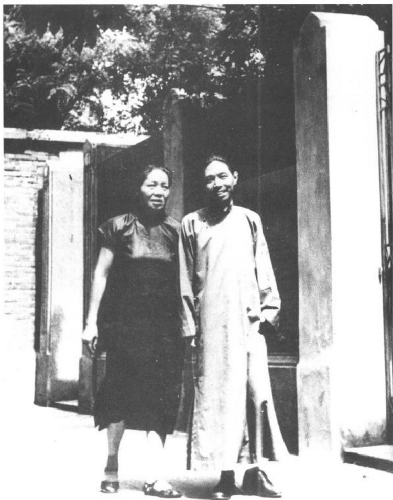
茅盾夫妇在上海寓所。