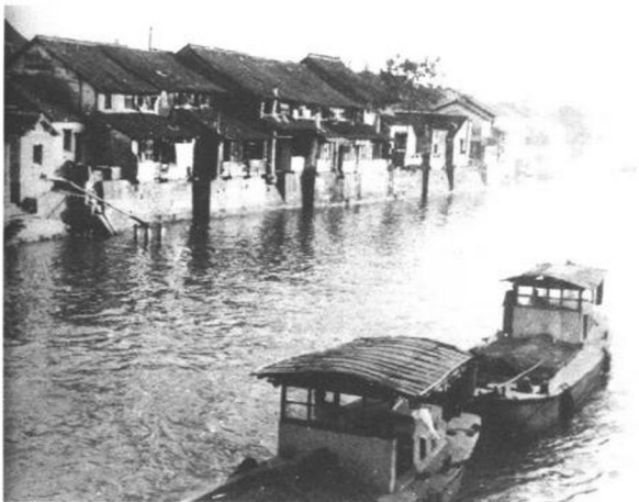
茅盾诞生地浙江桐乡乌镇。