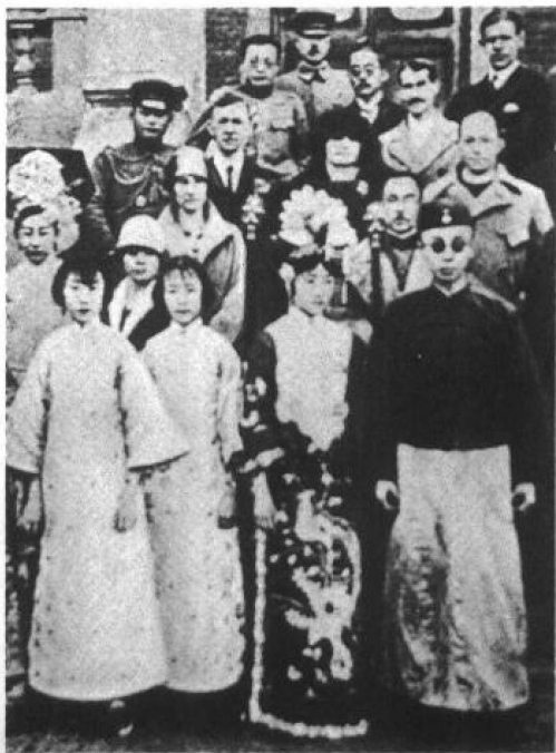
前往天津迎接溥仪的关东军参谋们与溥仪夫妇合影（选自《抗战画史》）