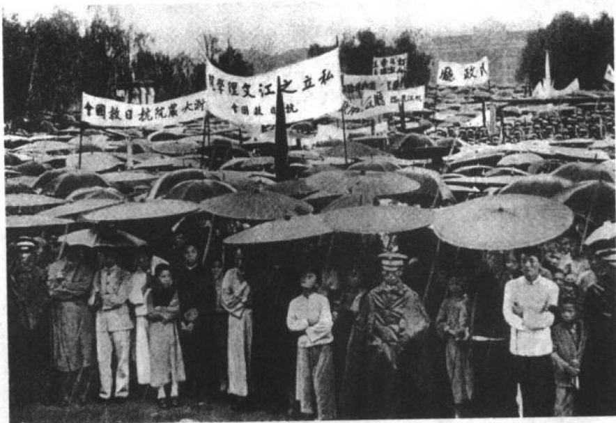
柳条湖事件后，杭州有 10 万人冒雨参加抗日救国会的成立大会（选自《抗战画史》）

击队袭击了满洲铁路株式会社所属的抚顺煤矿，日本人 5 人死亡、4 人重伤，守备队两名士兵负伤。抚顺守备队立即采取报复行动，190 名士兵冲入中国煤矿工人集中居住的平顶山，杀害约 3000 名矿工，犯下了滔天罪行。