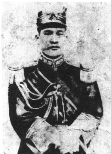
三原起义领导者张义安(养成)烈士