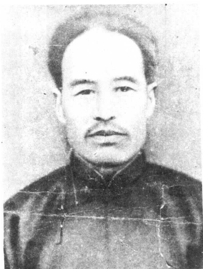
陕西靖国军第三路司令曹世英(俊夫)