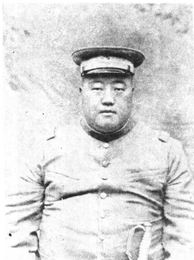
左上：陕西靖国军副总司令张钫(伯英)