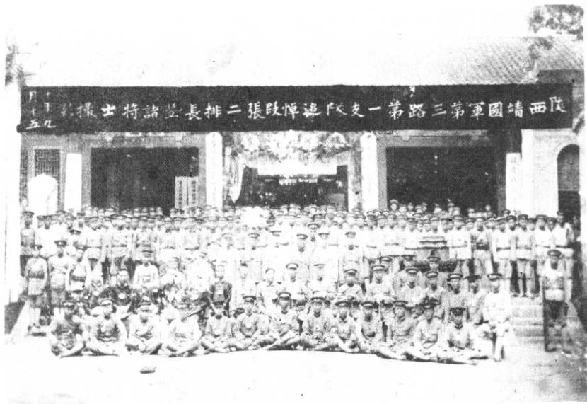
陝西靖國軍第三路第一支隊追悼烈士