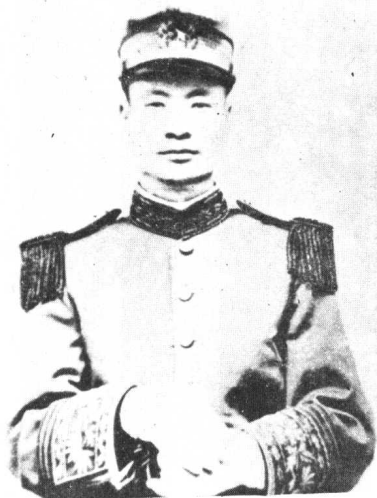
陕西靖国军第一路司令郭坚(方刚)