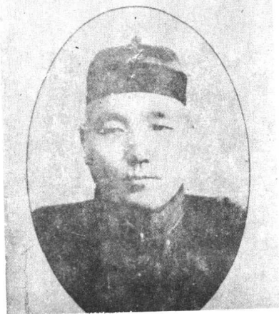
陕西靖国军第五路司令高峻(峰五)