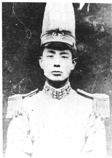
西安起义领导者耿直(端人)烈士