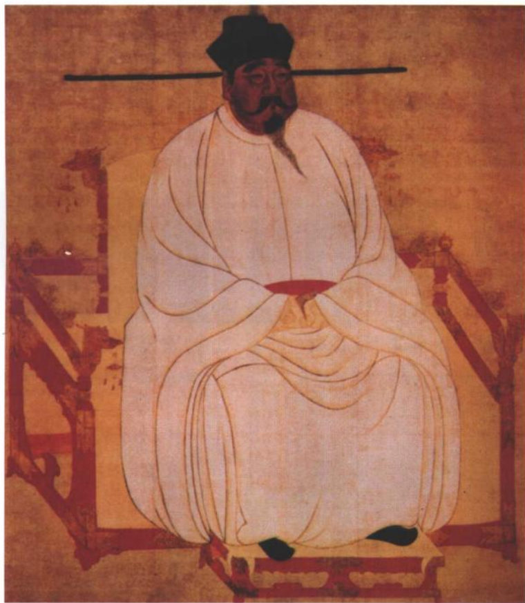
宋太祖赵匡胤像 (故宫南薰殿旧藏)