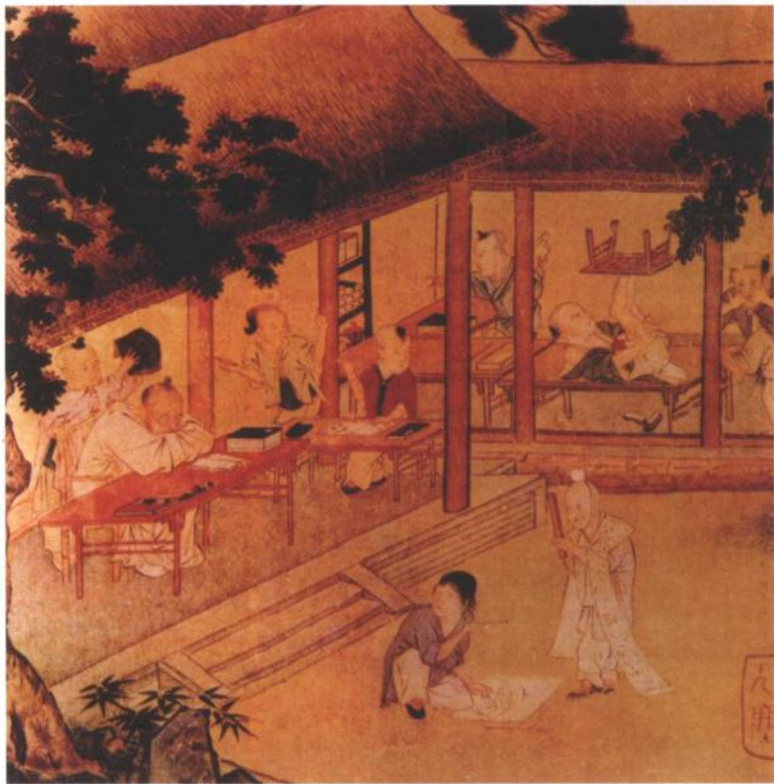
宋人绘《村童闹学图》