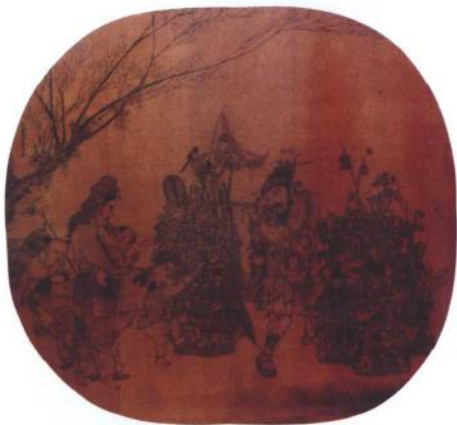
南宋李嵩《市担婴戏图》 (《货郎图》，绢本，设色)