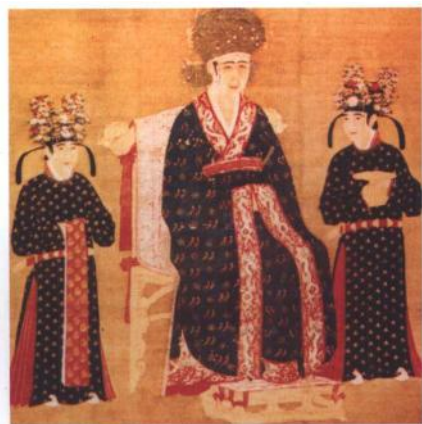
宋皇后和宫女服饰 (原画在台北，曾刊载于《故宫周刊》，另集印于历代帝后相册中。)