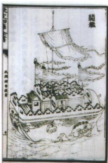
《武经总要》插图《斗舰》