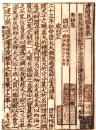
司马光《资治通鉴》书影 (南宋绍兴二年浙东茶盐公使库刊本)