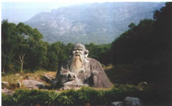
泉州清源山老君岩老子石刻坐像