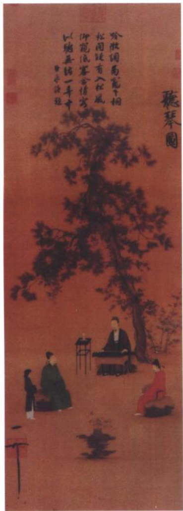
宋徽宗赵佶名画《听琴图》 (绢本，设色)