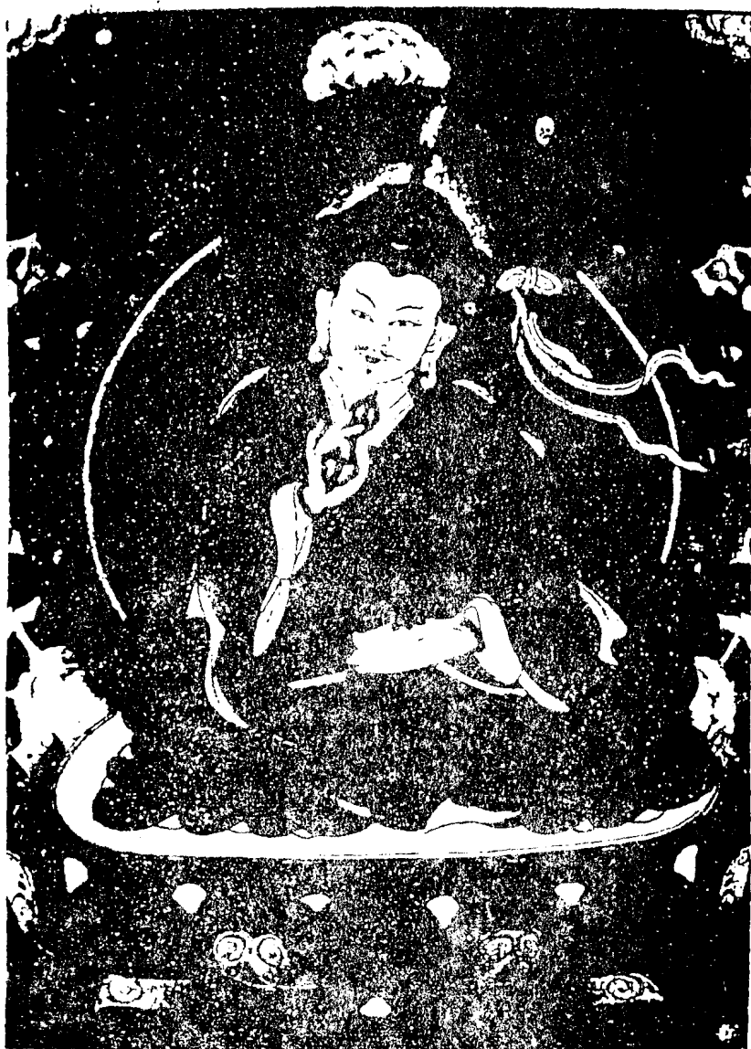
紅 教 師 蓮 華 月