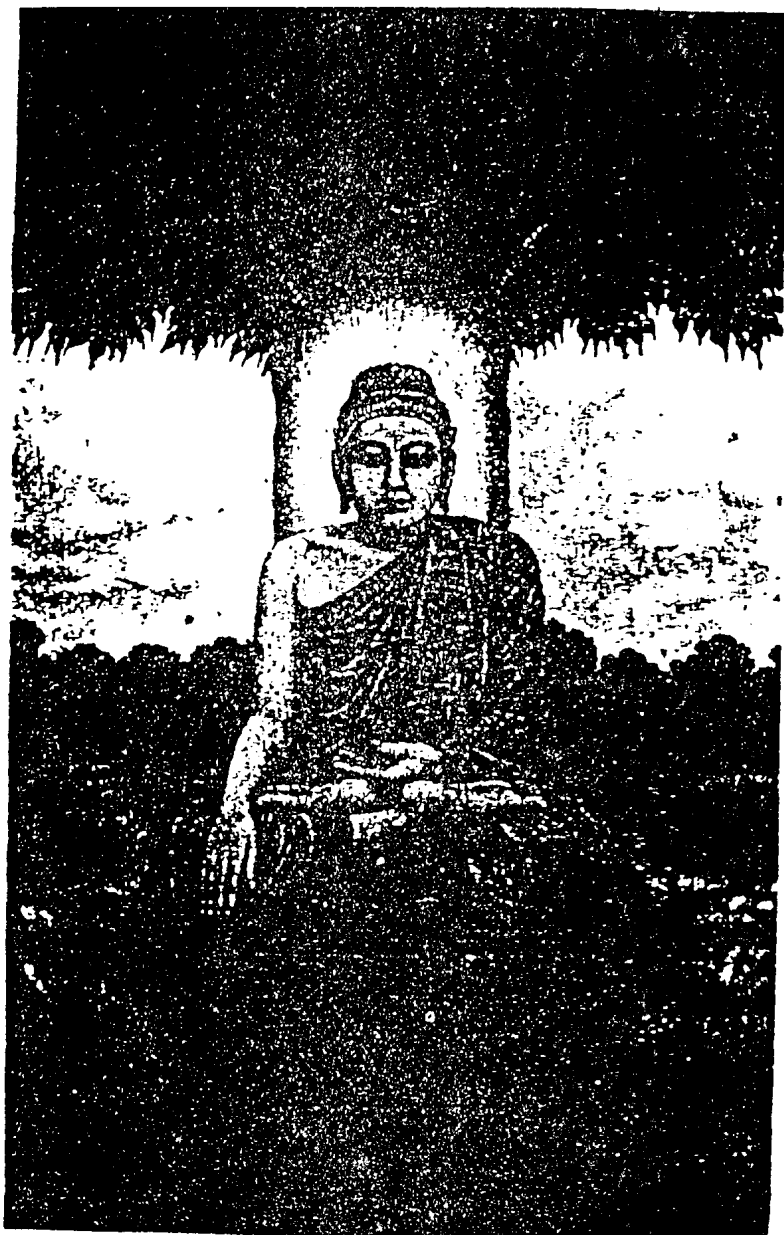
佛 尼 牟 迦 釋