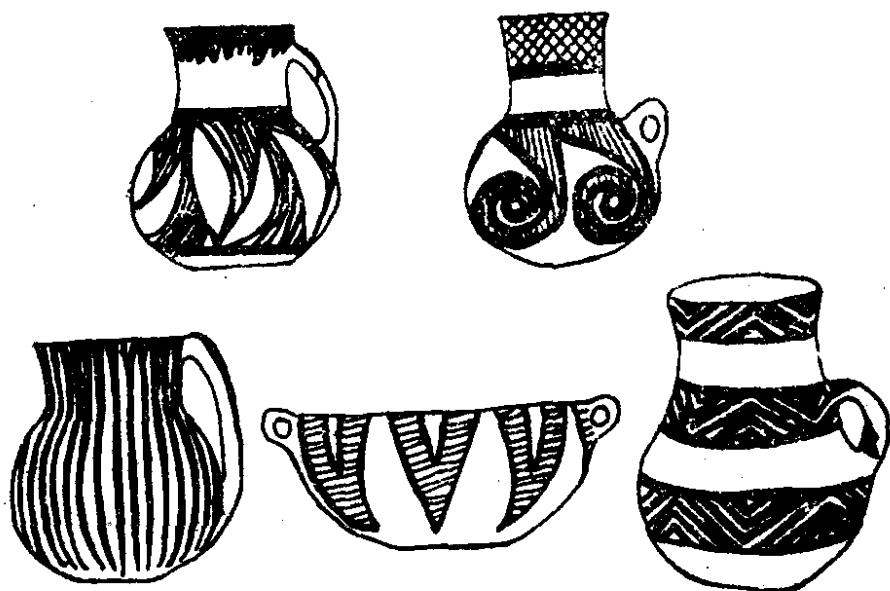
图三 新疆地区出土彩陶

哈密五堡绿洲，曾经发掘过一处距今三千年前后的古代墓地，形象地表现了当时人们的日常生活景象。这一时期的