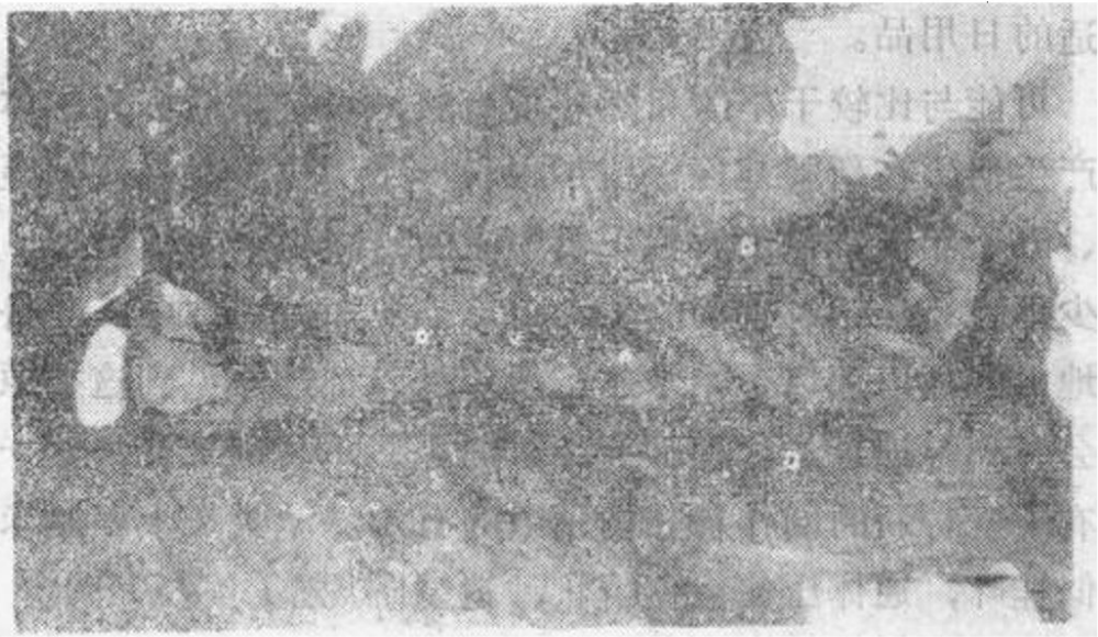
图二 孔雀河下游古墓沟古尸出土现场

距今四千年以后,在罗布淖尔地区,生活着一支颇具特色的居民:他们头发黄褐、面孔狭长,鼻高而直,眼大有神,形象是相当漂亮的。他们头戴尖顶毡帽,帽沿周缘绣饰红线数道,帽顶插几根禽鸟翎羽。身裹粗毛毯,腰部束带,脚著皮靴。颈、腕、腰部配饰骨、石质串珠,具有鲜明的特点。