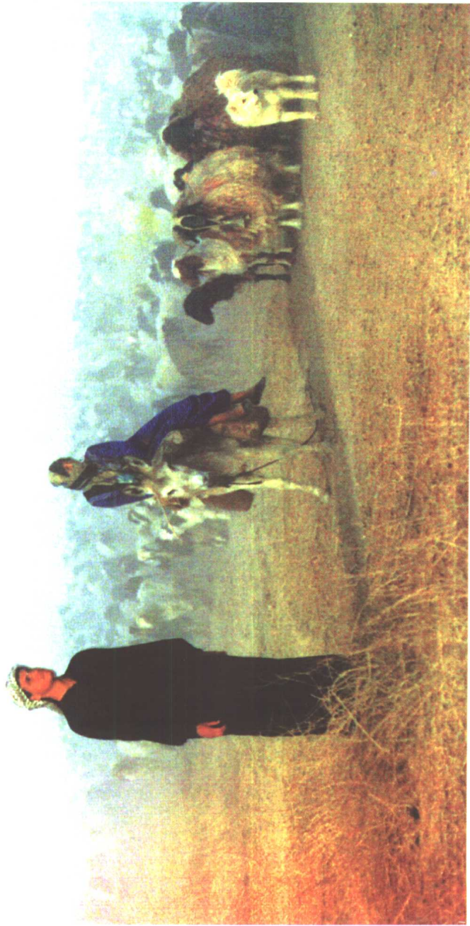
由于国际制裁，萨达姆和阿拉伯民族复兴社会党号召自力更生。 这是伊拉克北部农民饲养的羊群。