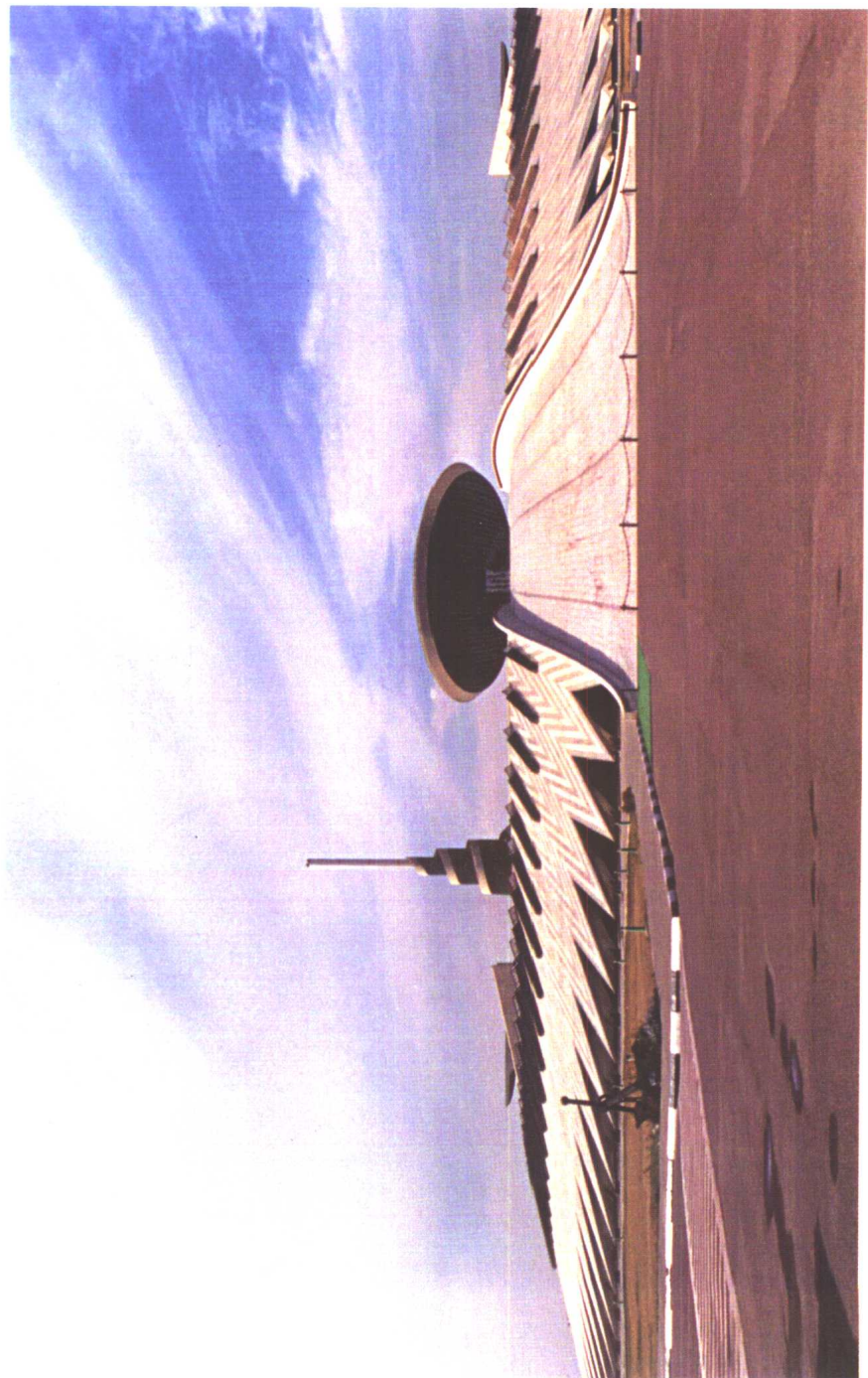
巴格达无名烈士墓