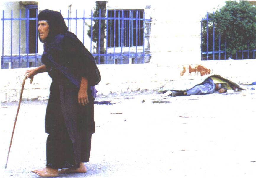
战争中死神的黑翼随时拍打着大地