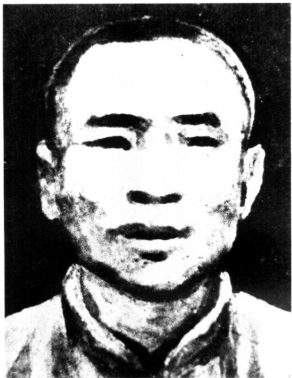
中共闽东临时特委 代理书记詹如柏