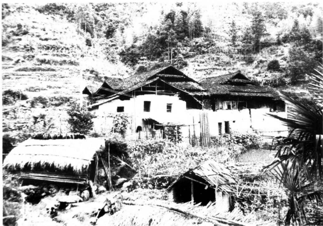
三年游击战争时期，闽东红军游击队的重要依托地闽东畚乡——周宁上竹洲村