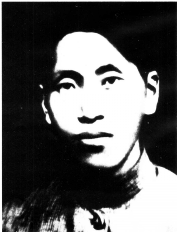
闽东苏维埃政府副主席叶秀蕃