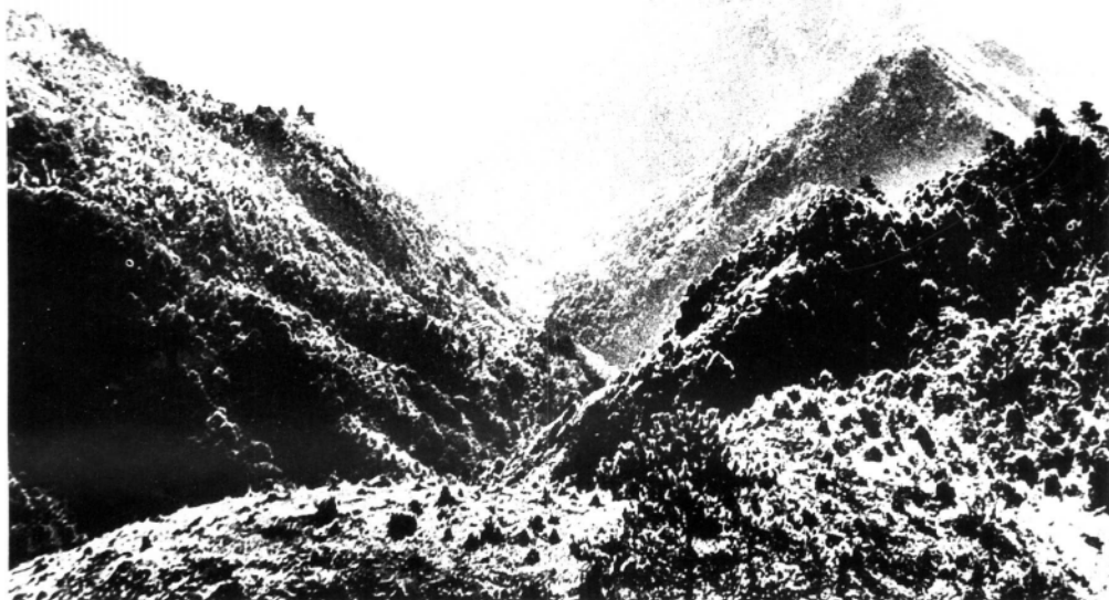
抗战爆发后,国民党当局继续派兵“清剿”红军游击队。1937年8月19日,独立师第2纵队在宁德县亲母岭全歼福建省保安军2旅1个加强连。图为战斗地点