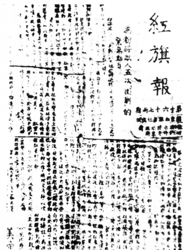
中共闽东特委机关报——《红旗报》