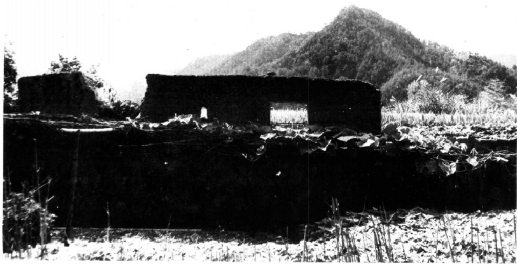
1935年10月5日，中共闽浙边临时省委在寿宁县郑家坑村成立。图为郑家坑村