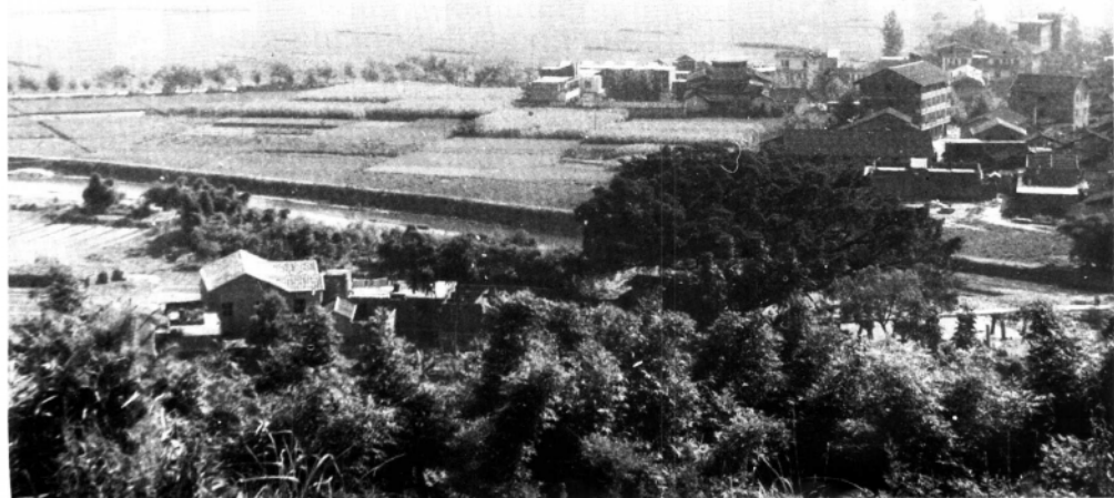
1934年6月，中共闽东临时特委在福安县柏柱洋成立。图为柏柱洋