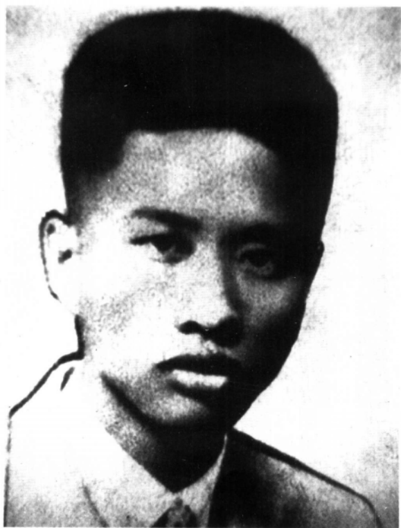
闽东苏维埃政府主席马立峰