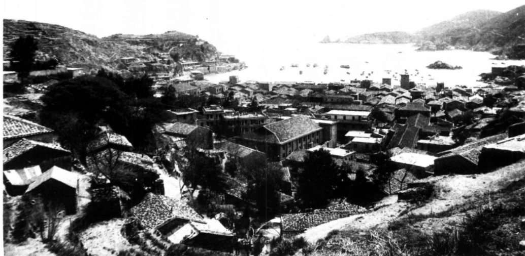
闽东红军海上游击独立营驻地霞浦县西洋岛