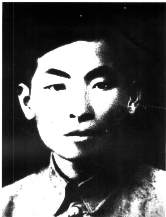
中共闽东特委书记、闽 东独立师政委兼师长、闽东 军政委员会主席叶飞