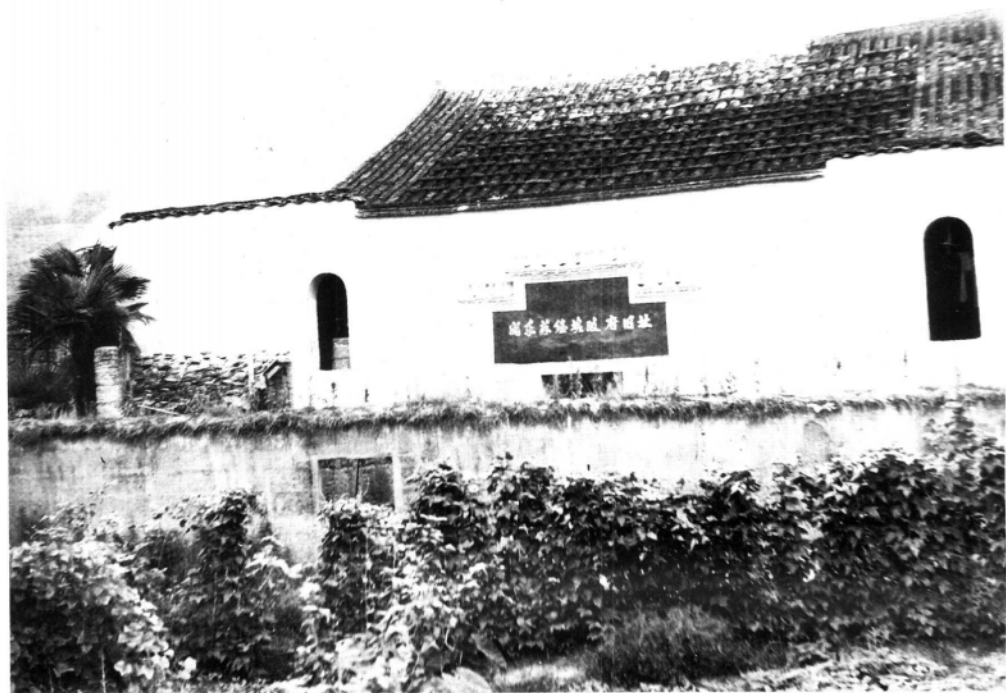
闽东苏维埃政府旧址