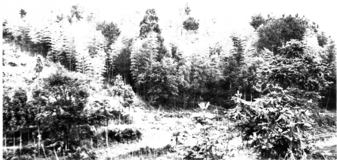
1935年1月中旬，中共闽东临时特委在福安县洋面山召开紧急会议，作出转变战略方针、变苏区为游击区、开展游击战争的决定。图为洋面山