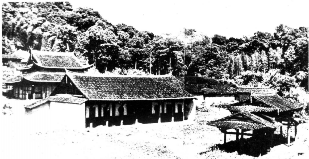
1934年9月，中国工农红军闽东独立师在宁德县支提寺成立。图为支提寺