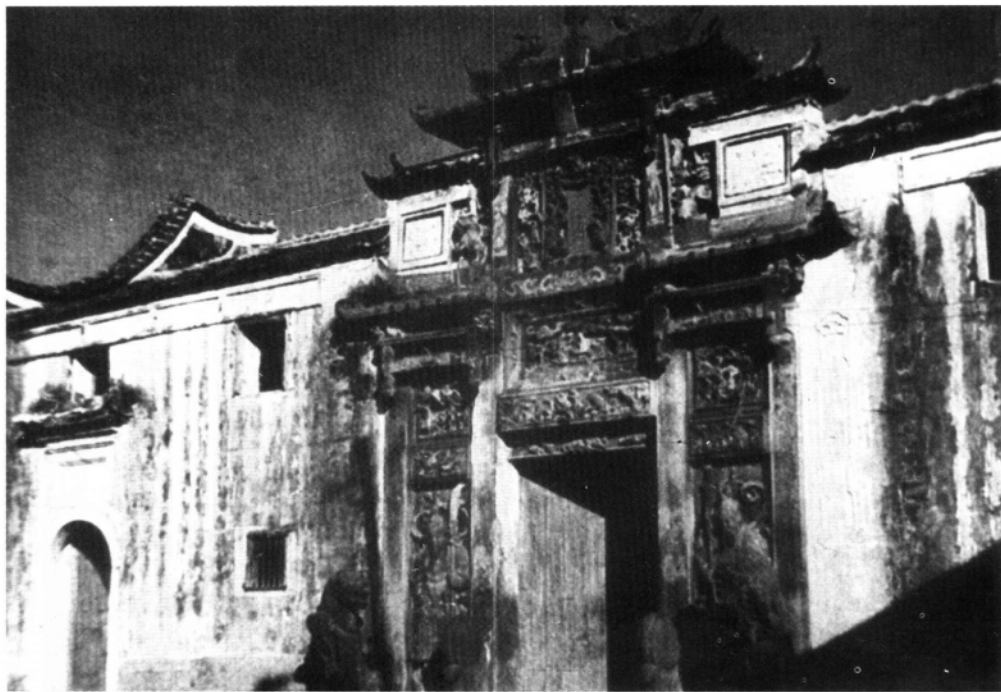
闽东国共合作抗日谈判旧址宁德城关妈祖庙