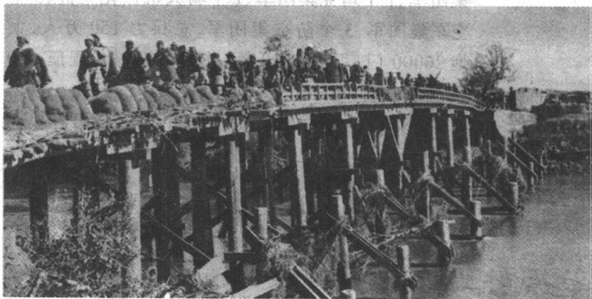
新四军三师进军东北途中

高前峰丁战时战地采访，日9月8年1941 下高，战时战地采访，日9月8年1941 二系，战时战地采访，日9月8年1941 战时战地采访，日9月8年1941 战时战地采访，日9月8年1941