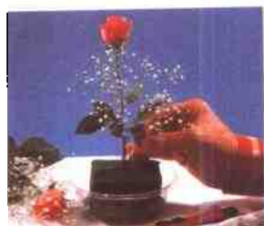
1 花泥置于水中浸泡，切成需要的形状，插入最长的一枝花(玫瑰)，接着插上满天星。

三色堇塑造各种主题。然而，最好的是把她用在花盆里，因为剪下来的容易干枯。无论把她放在哪里，她的“容器”都会给我们带来温馨和欢乐。例如，初春时节她出现在色彩鲜艳的郁金香花丛中。特别是短花柄、橙黄色的重瓣品种“ Mansella ”或纯白色的“ Schoonoord ”与牛眼菊、葡萄风信子( Muscari )、桂竹香( Cheliranthus )、荷包牡丹( Dicentra )或勿忘草组合时，会显得格外妩媚。顾名思义，勿忘草是“不要忘记我”的意思。这种一般为天蓝色的小花朵虽然很快凋谢，但却具有无可比拟的魅力。