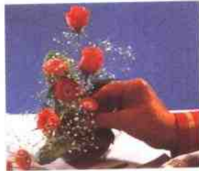
2 整体看起来挺秀丽，但却有点稀疏。把稍短的雏菊花枝和筛选好的樱草叶插入其中。