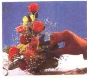
3 蓝色的勿忘草和几朵葡萄风信子使整个花束产生了强烈的色调对比。