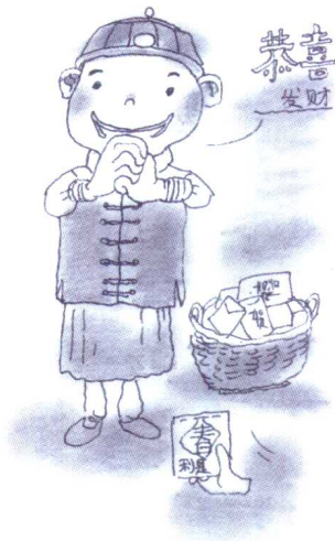
插图 高晶 蒋琰雄