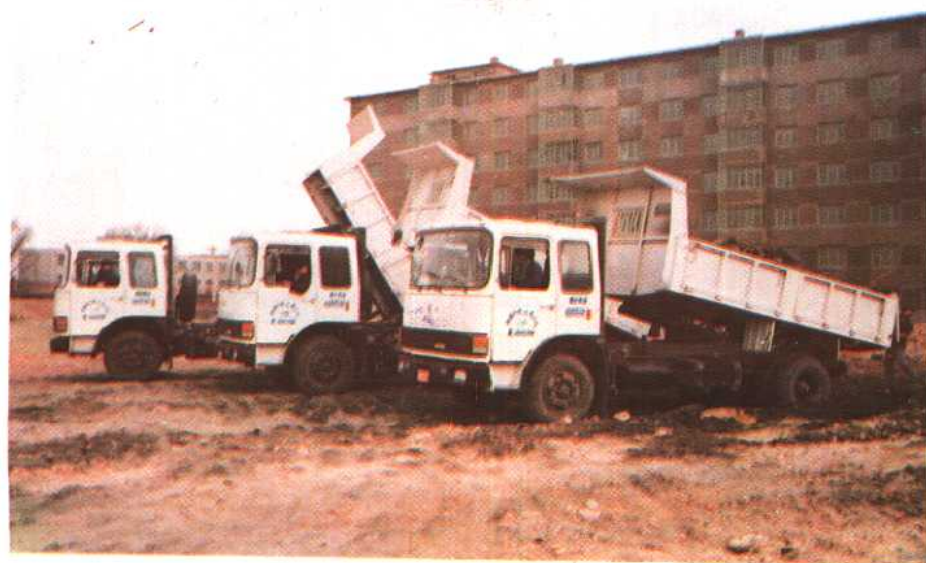
大吨位自卸车作业现场