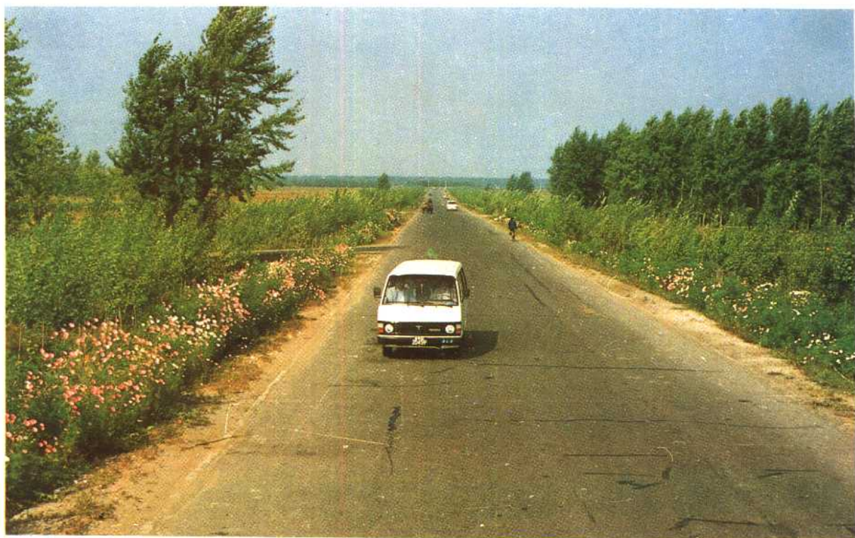
京哈公路长春南绕越线二级公路