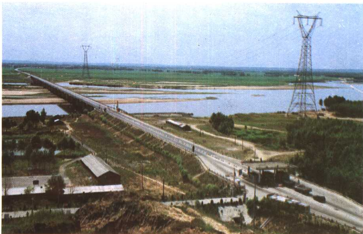
天堑变通途——乌金屯大桥俯瞰