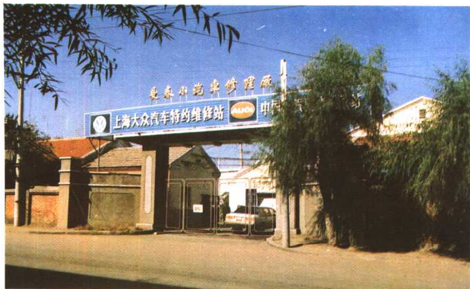
长春小汽车修理厂