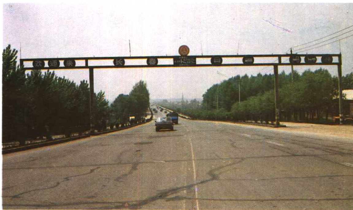
长春至吉林(北线)市区出口段一级公路