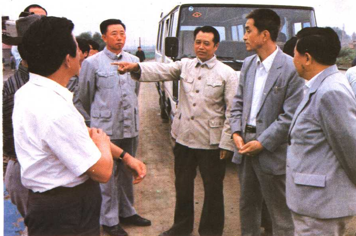
1988年6月,市委书记吴亦侠(右一)、市长尚振令(右二)、副市长张明远(右五)、副市长吕久权(右四)检查公路工作