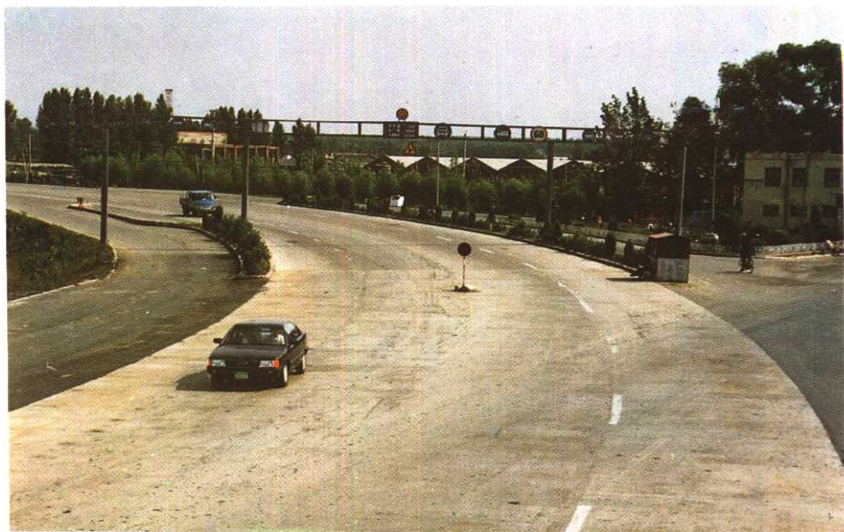
长春至大蒲柴河公路净月段一级水泥路