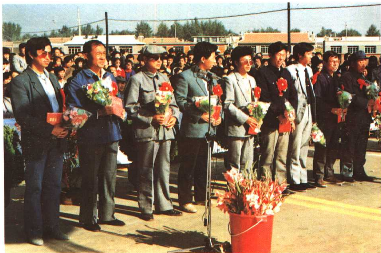
为筑路功臣戴上光荣花