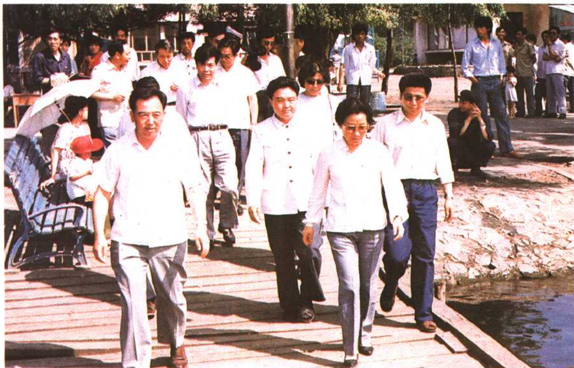
1987年7月，交通部副部长郑光迪(前排右一)在长春视察水上安全工作