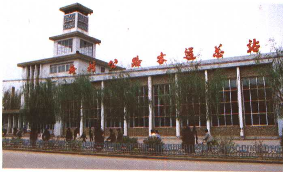
榆树公路客运总站