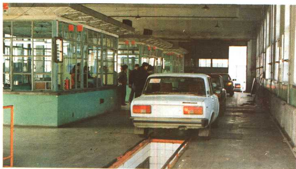
市汽车修配厂 汽车不解体检测线