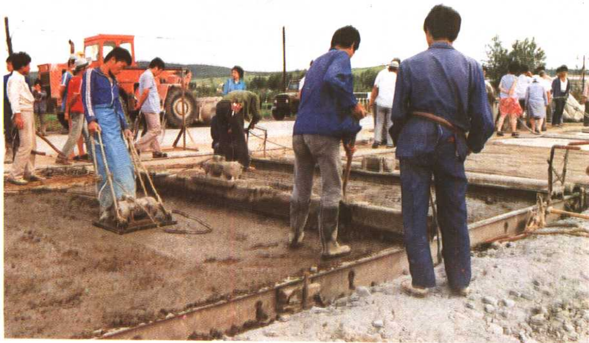
繁忙的公路施工现场