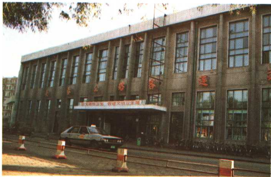
长春市公路客运北站