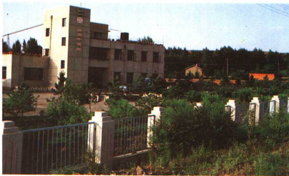
四家子公路养护道班