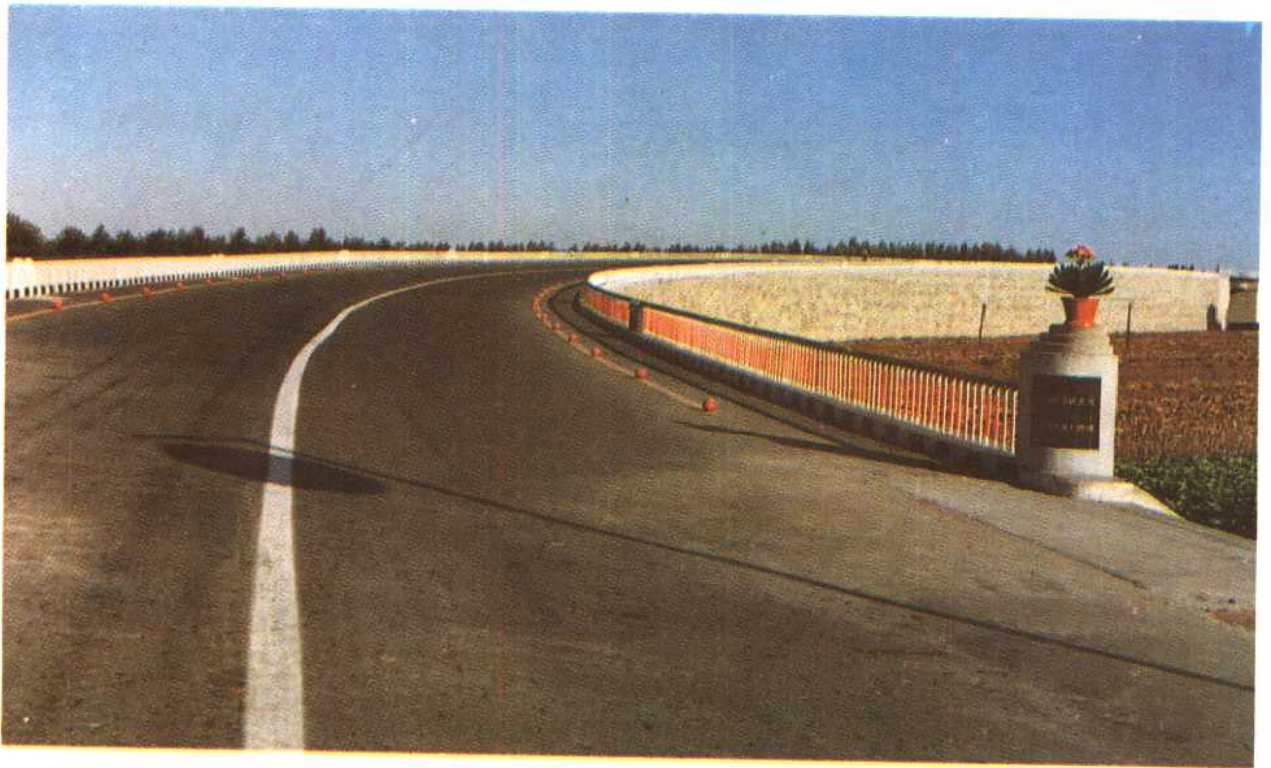
耿家油坊公铁立交桥