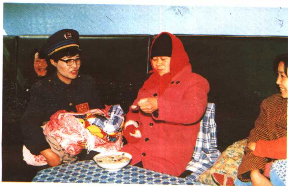
客运人员热心为旅客服务