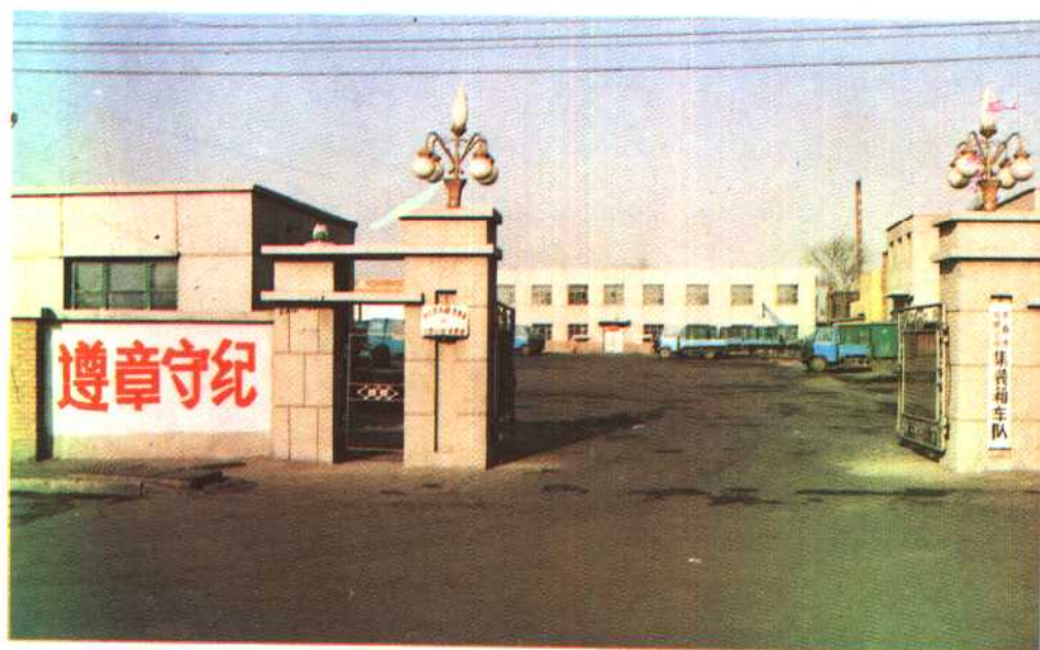
长春市公路零担 集装箱中转站