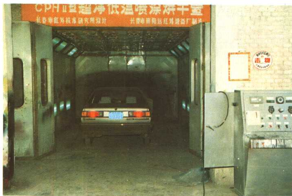
长春小汽车修理厂喷漆车间烘干室