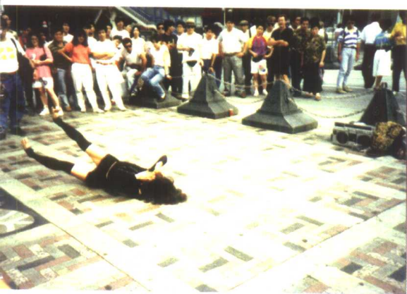
躺在街头的“新人类”