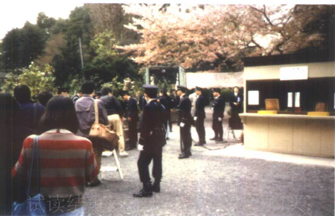
东京 也有戒备 森严的一面