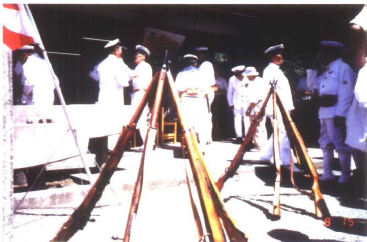
八·一 五时的靖 国神社