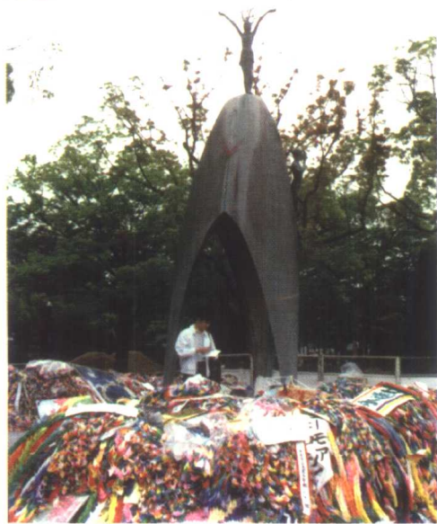
广岛 原子弹爆炸地的纪念碑