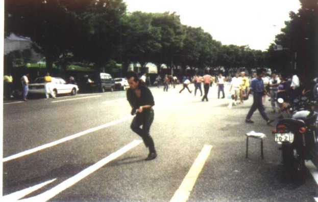
张扬 个性的年 轻人