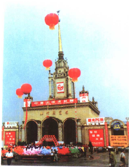
1▶中国出版成就展于1996年7月 在北京展览馆展出