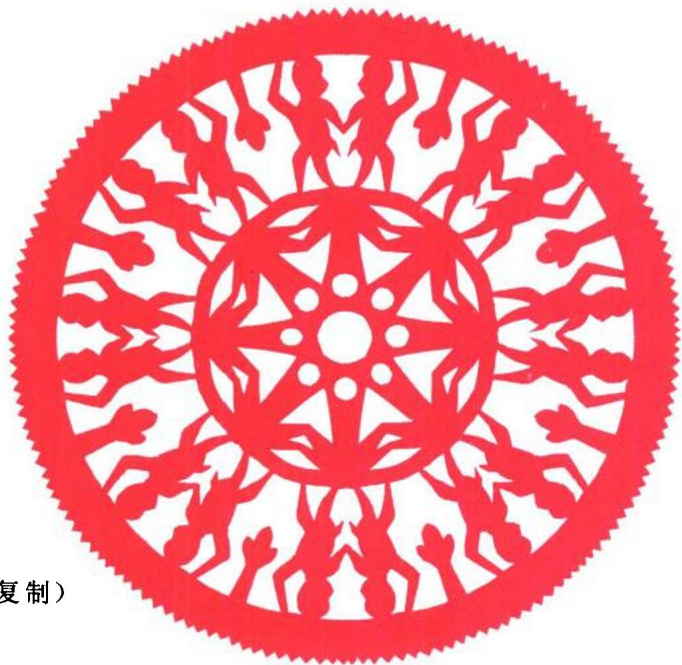
图 1 猴(复制)

剪纸不强调光影和素描效果,更不强调自身色彩的如实反映,有时对物体的比例概念、时间概念也需要模糊,如传统剪纸《鱼钻莲》(见图 3)中的鱼与莲的对比,显然鱼要比实际比例大得多。而《四季果》(见图 4)中的四个季节中所结果实合为一体,就是时间模糊的一例。总之,只要有利于表现创作题材,在适当的环境中变形,正是剪纸所需要提倡的。