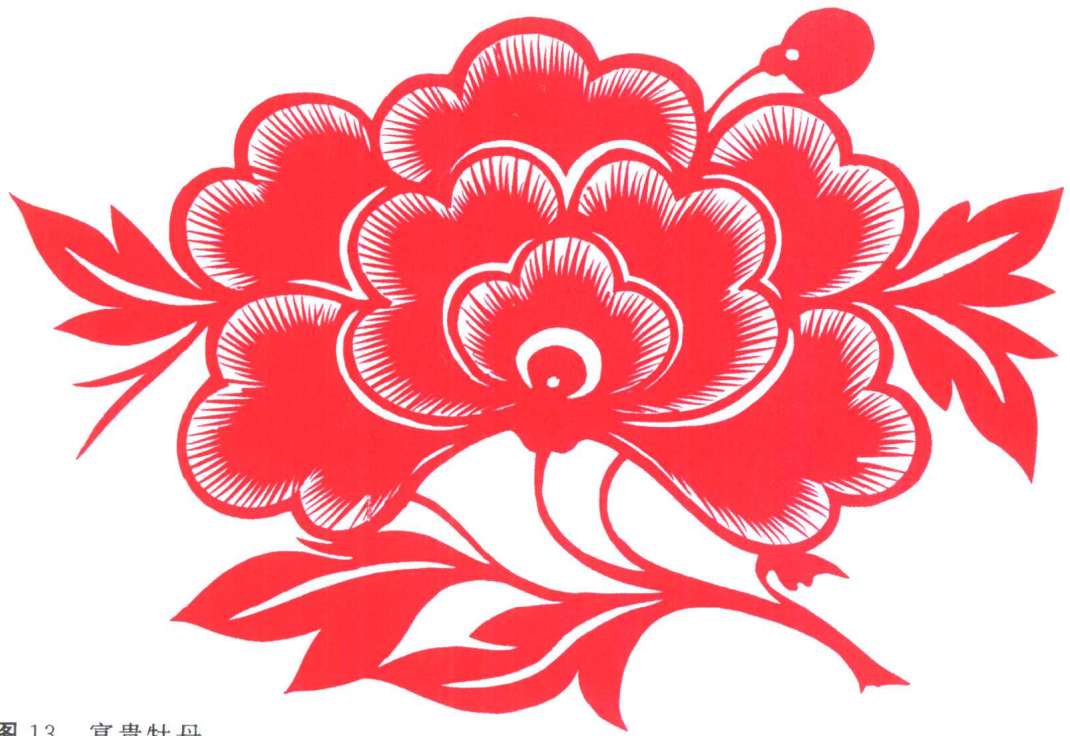
图 13 富贵牡丹