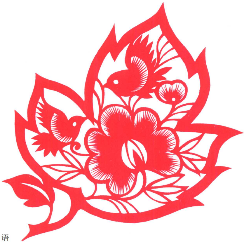
图 14 花香鸟语