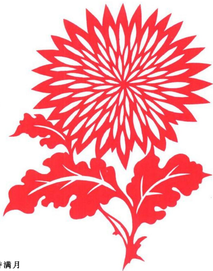
图 12 金香满月