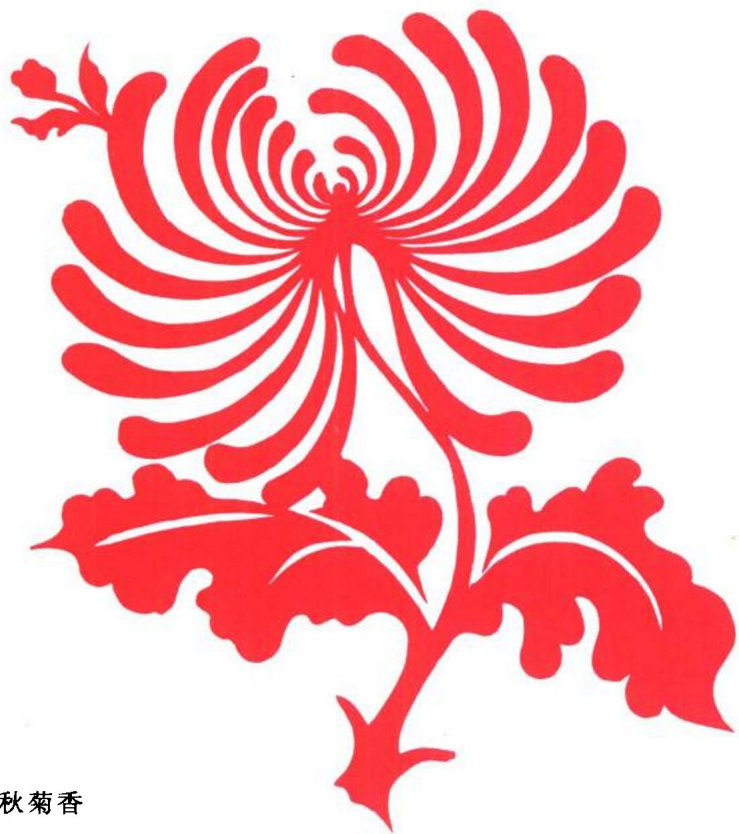
图 11 金秋菊香

菊花的种类很多,彼此形态区别很大。花瓣有的细如蚕丝,有的圆如珠玉;外形有的大如明月,有的小如繁星;花色五彩缤纷,多姿多彩。民间多以菊来代表君子文人,也以菊来表示长寿,如《梅兰菊竹四君子》、《秋菊祝寿》等。