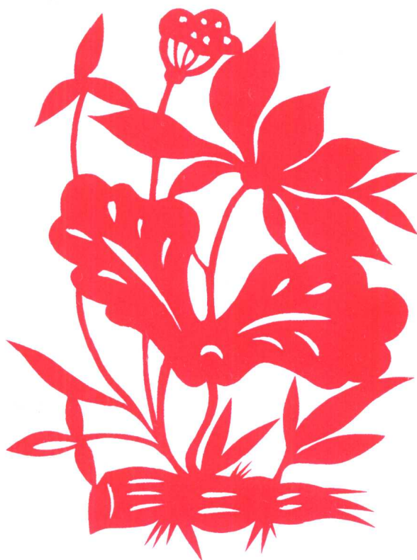
图 10 和和美美(二)