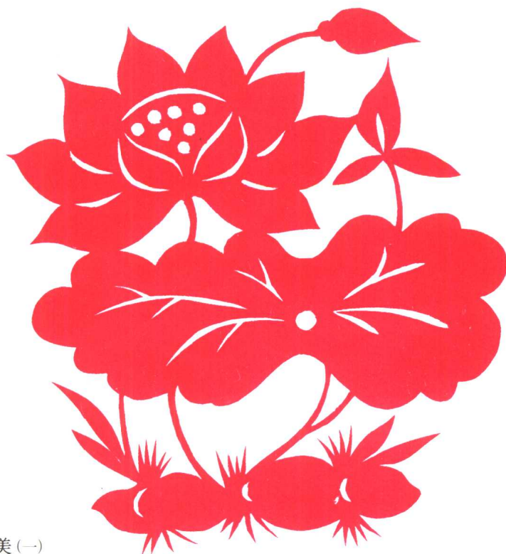
图 9 和和美美(一)