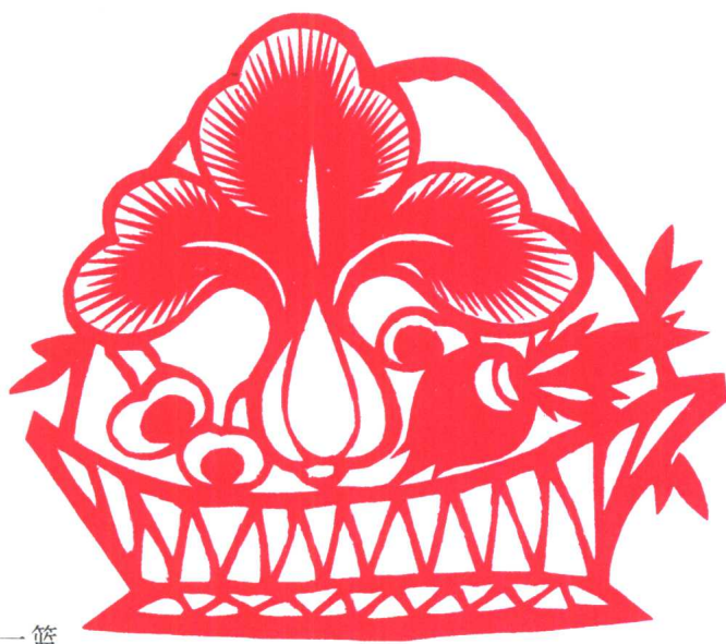
图 6 青翠一篮