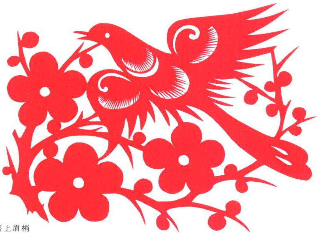
图 15 喜上眉梢