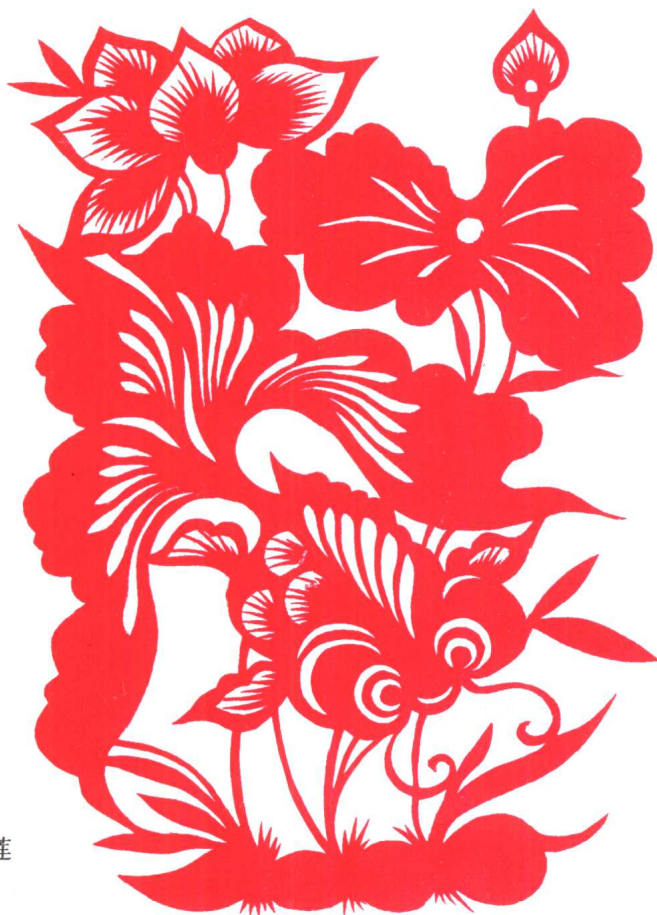
图 3 鱼钻莲