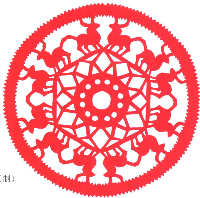
图 2 马(复制)