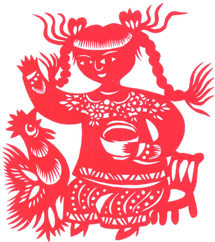
图 5 喂 鸡