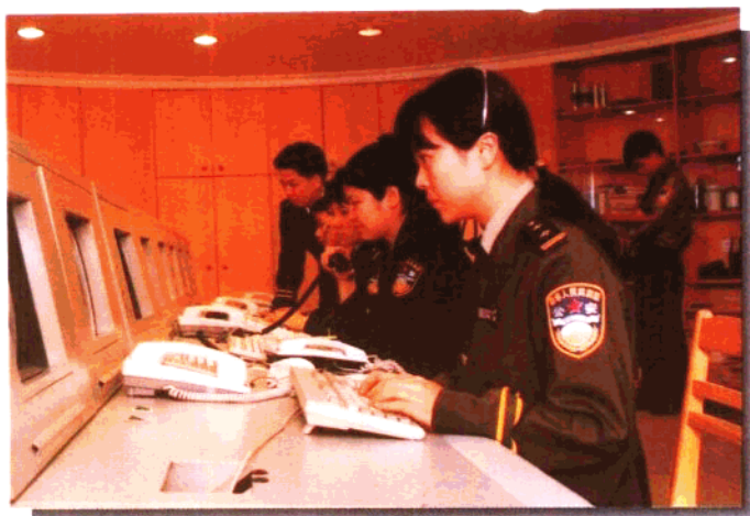
芳村区公安分局“110” 报警指挥中心联网开通