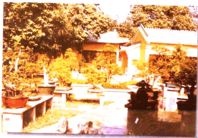
改造后的醉 观公园一角