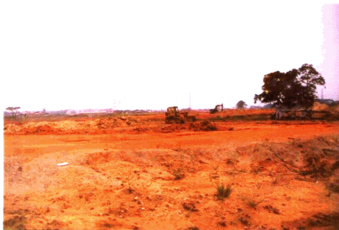
建设中的高 尔夫球场