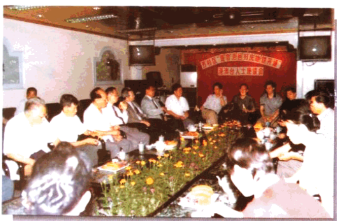
“迎香港回归，庆 地铁开通”港澳台 人士座谈会