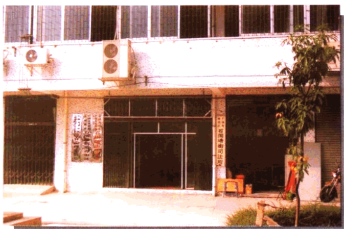
1997年8月石围塘 街道办事处迁新址 办公