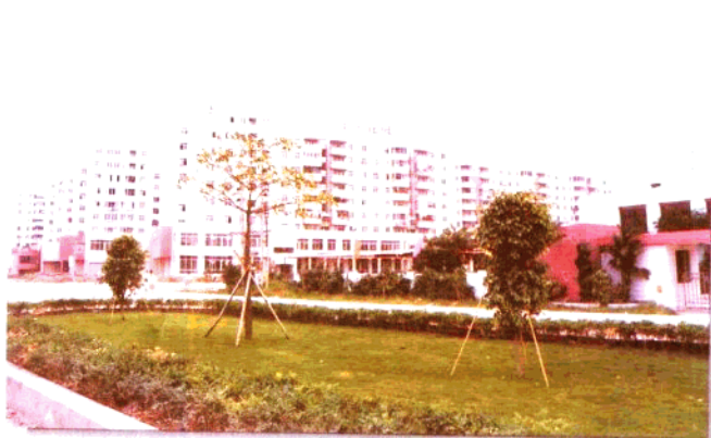
位于东沙经济区的 金宇花园