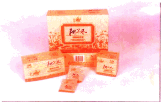
天芝韵企业有限公司生产的“耕不尽”银杏叶冲剂