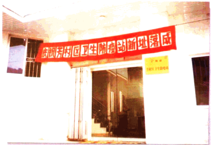
位于桥东小区的芳村 区卫生防疫站新址 (1997年11月迁入)