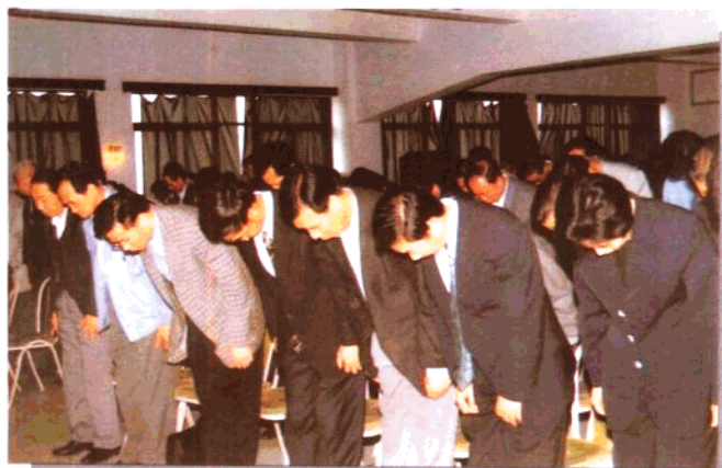
干部、职工沉痛 悼念邓小平同志