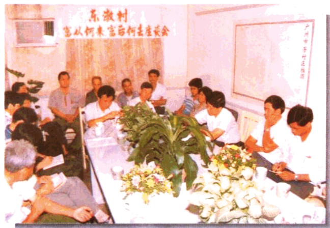
东滘村召开“富从何 来，富后何去”座谈 会