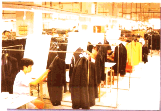
广州裕达制衣有限公司（制衣车间）