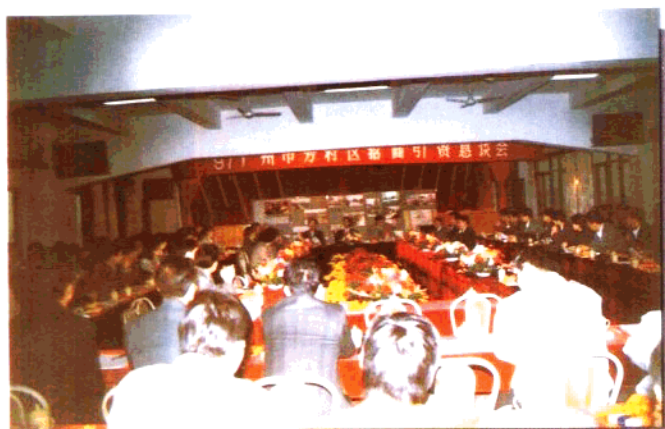
区政府召开招商 引资恳谈会