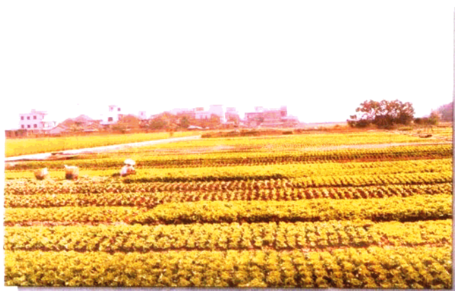
东澍镇标准化菜 田面积不断扩大