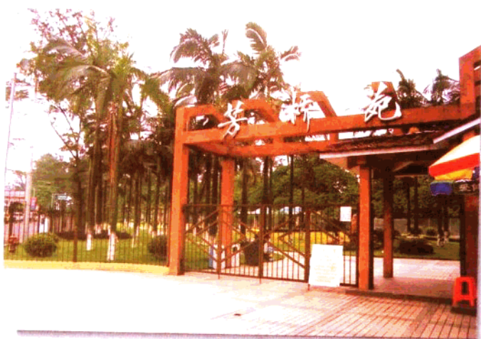
1997年6月建成的 街道新景点 ——芳桥苑