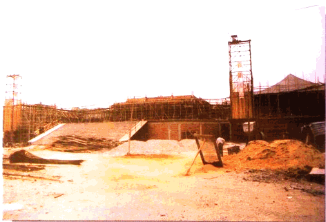
复建中的黄大仙祠