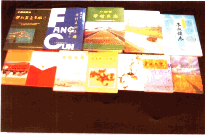
1991~1997年出版的 的部分出版物