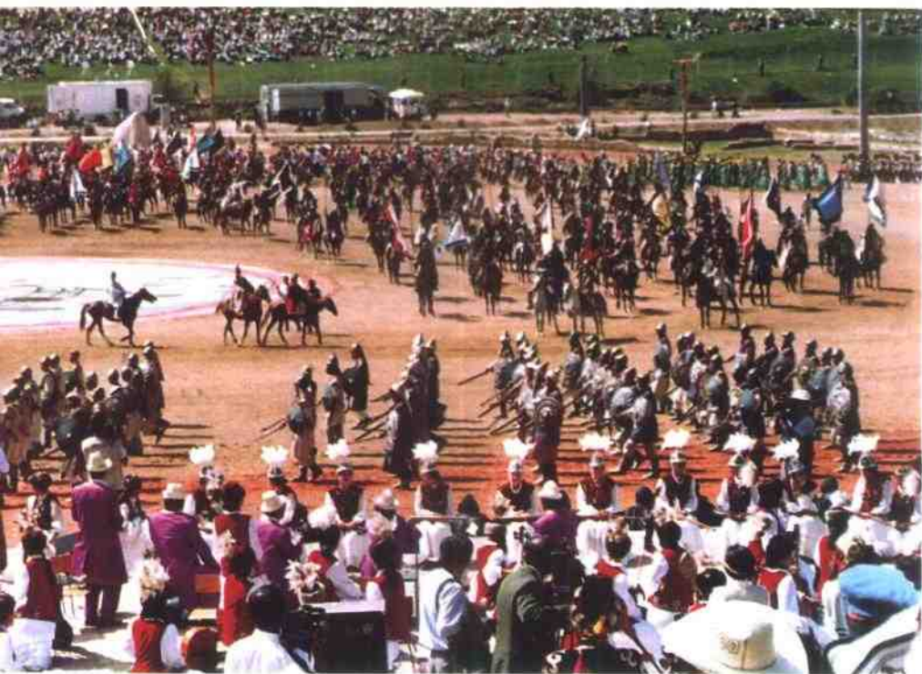
1995年吉尔吉斯斯坦在塔拉斯举行再现《玛纳斯》的征战场面