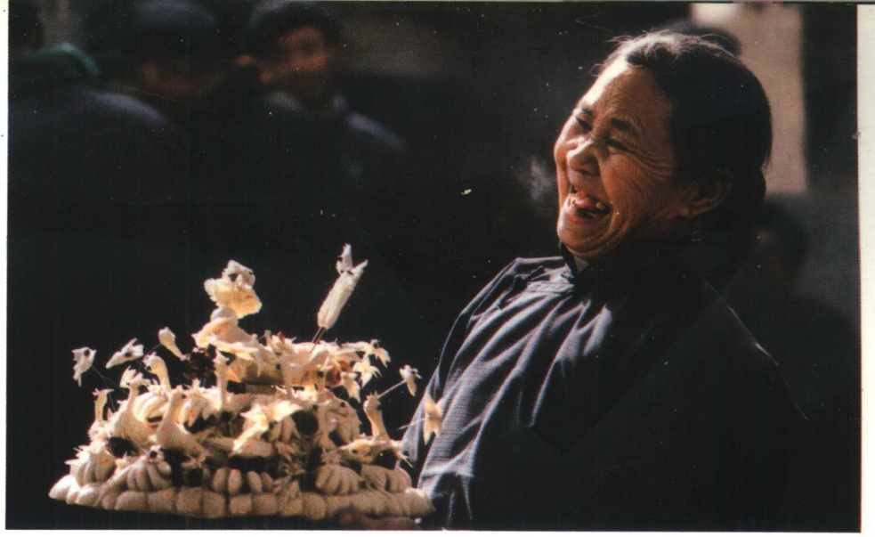
具有仰韶文化遗风的龙凤面花