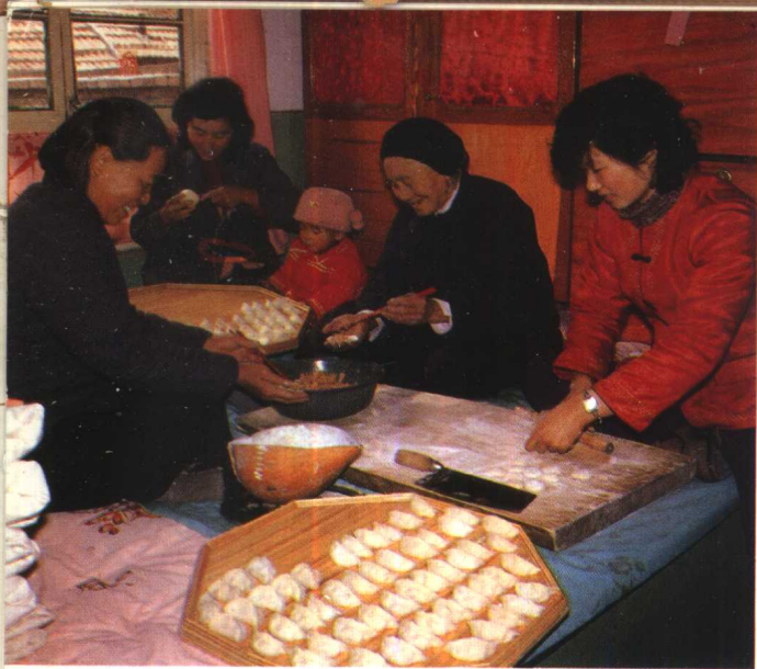
农历正月初一吃包饺子是传统习俗