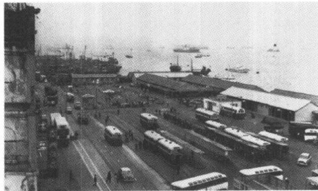
60年代的上环新填地

本月，市政局为确保市民健康，对饮食业卫生设备实施严格检查，若发现有违反卫生条例的，即予控告。两周来，仅九龙一区，被控告的酒家就有15家，被口头警告的多达100家。可见，饮食业违反卫生条例情形十分严重。一般经营饮食的业主，面对政府雷厉风行的检查，个个都谈虎色变，纷纷设法改善装置，以适应卫生要求。由于实施严格检查，至少有20家以上咖啡店以及潮籍人士经营的经济饭店，宣告停业。