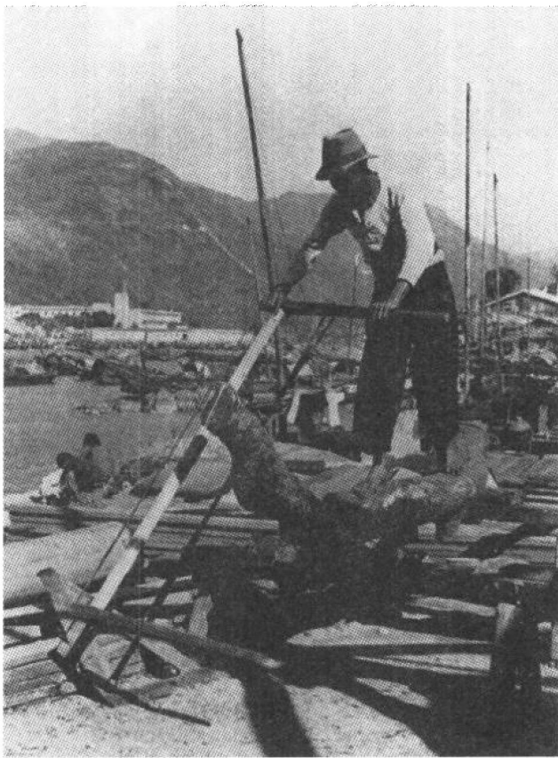
60年代香港造船业正在起步

本月，港府海事处处长柏赫在工作报告中称，截至本年第一季度为止，香港共有机动渔船2729艘。该季内，共有3026艘船艇及渔船由海事处牌照所发给及换发牌照，其中包括19艘机动货船，562艘机动渔船，及214艘汽艇。同时，有49艘船只因改变其注册类别，被取消牌照。其中有10艘因改装为货船而重新注册。在塔门洲到平洲岛之间行驶的小型轮渡新航线，已经获准发给临时牌照。“新界”其他各处，仍有小型机动渔船，在各乡村及墟镇间行驶，成为主要交通工具。