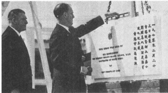
1960年2月，港督柏立基为大会堂主持奠基礼