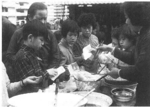
公共屋邨中的熟食小贩

“新界”民政署向各乡委员会发出通函称：世界基督教协议会设法物色100户愿意移居巴西的农家。