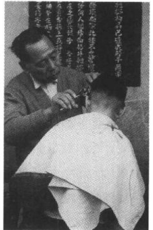
60年代的街头理发摊