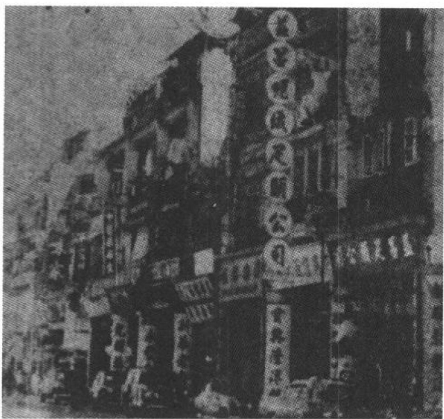
1960年行将拆迁的庄士顿道楼宇