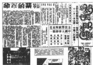
1960年11月创刊的《天天日报》