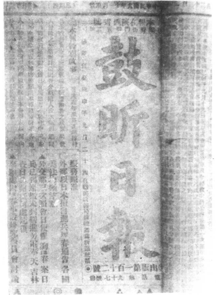
上：西安较早宣传马克思主义的报纸——《鼓昕日报》。