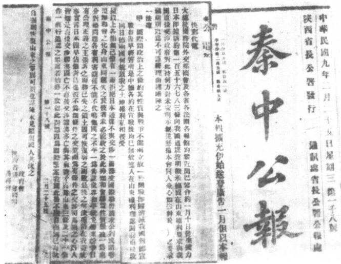
下：陕西《秦中公报》一九二〇年二月二十五日刊登的陕西教育会、议会、商务会关于山东问题的快邮代电。