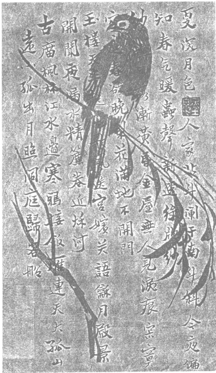
作者墨迹（写在红色彩笺上）