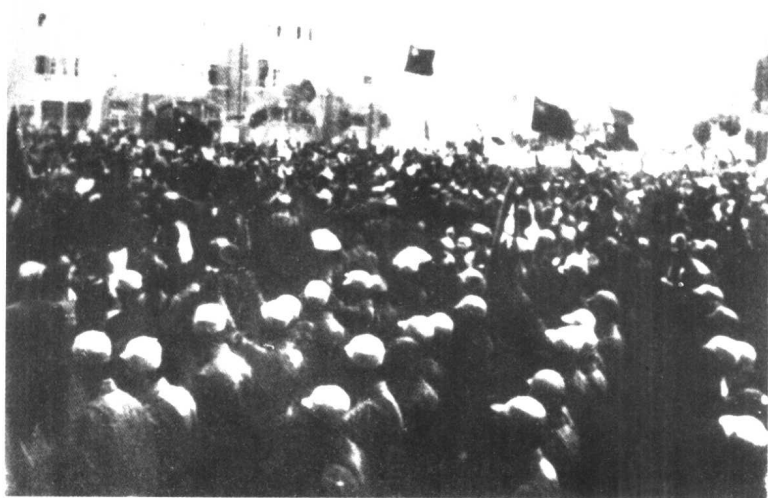
图为冀热辽部队1945年9月5日进入沈阳市，受到热烈欢迎的情形。