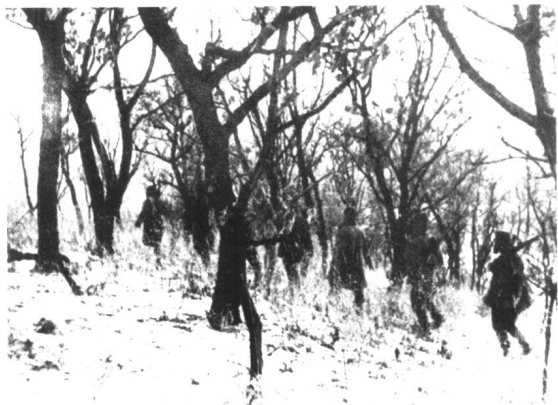
抗日战争胜利后，东北境内敌伪残余武装和土匪的活动猖獗。图为某部小分队在牡丹江一带的林海雪原中剿匪