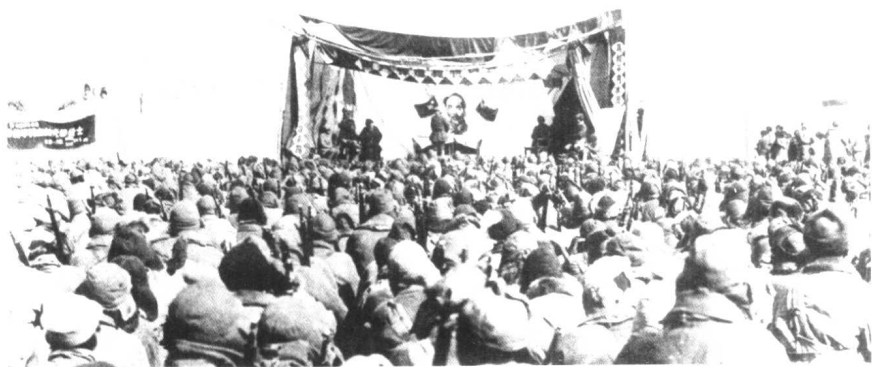
1946年3月13日，新四军第3师第7旅召开秀水河子歼灭战祝捷大会