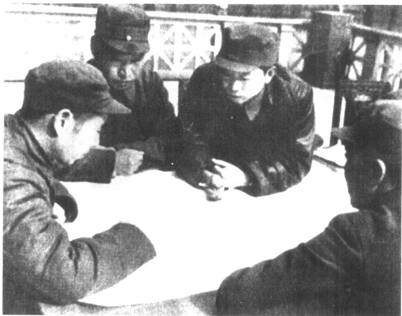
1946年，林彪(左)、彭真(中)、刘亚楼(右)在研究陈云起草的《东北的形势和任务》的决议