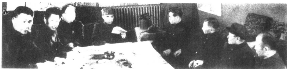
中共中央东北局领导在研究军事问题 左起：肖劲光、刘亚楼、罗荣桓、林彪、高岗、陈云、洛甫(张闻天)、吕正操