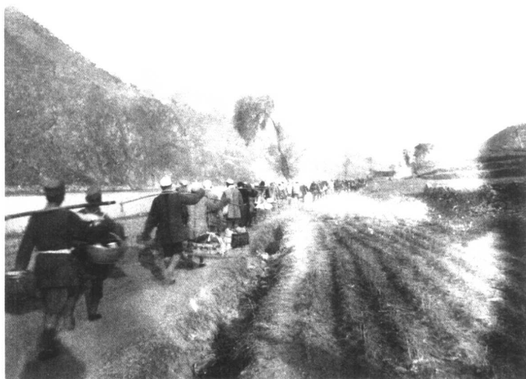
1945年10月，新四军3师共3万余人进军东北。图为该师经冀东冷口出关向东北挺进。