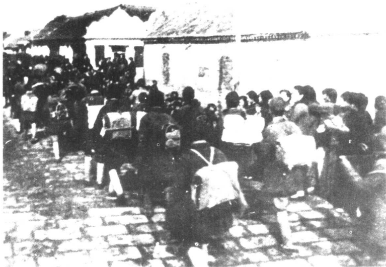
1945年9月至11月下旬，山东军区以主力6万多人分3批从陆路和海路向东北急进。图为山东军区部队从陆路挺进东北的一部分。