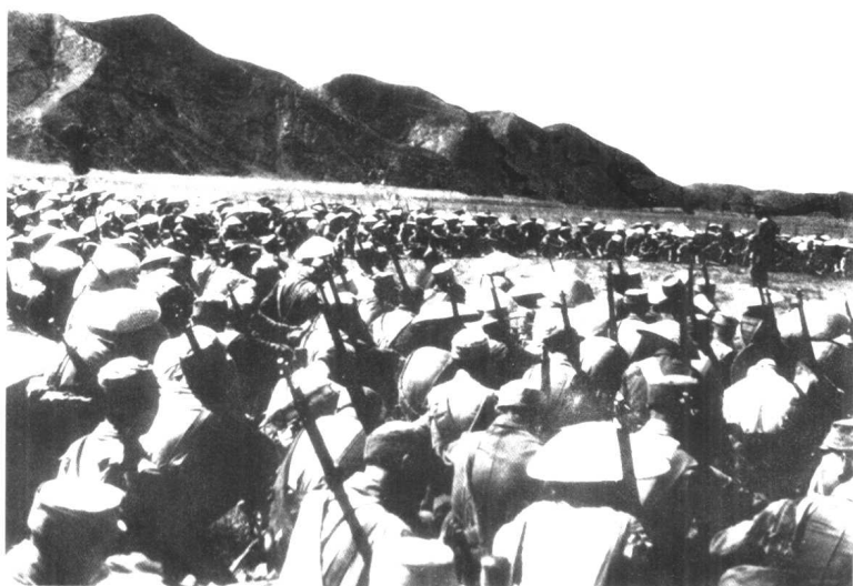
朱德总司令在1945年8月11日，命令晋绥、晋察冀、山东军区各以一部兵力立即进军东北。图为冀热辽部队向锦西进军时，李运昌司令员（站立者）作战斗动员。