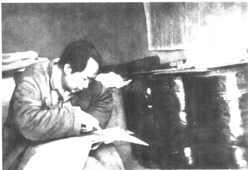
1947年3月,毛泽东在陕北转战中。图为毛泽东在陕北佳县朱官寨农民的窑洞里看军事地图。