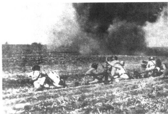
1946年2月13日黄昏，东北民主联军某部对秀水河子国民党军发起攻击