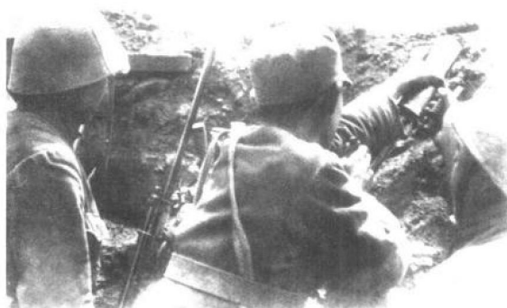
1946年4月，四平保卫战，东北民主联军某部阵地