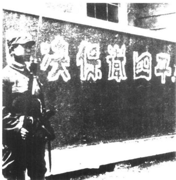
1946年4月，四平保卫战，东北民主联军某部哨兵