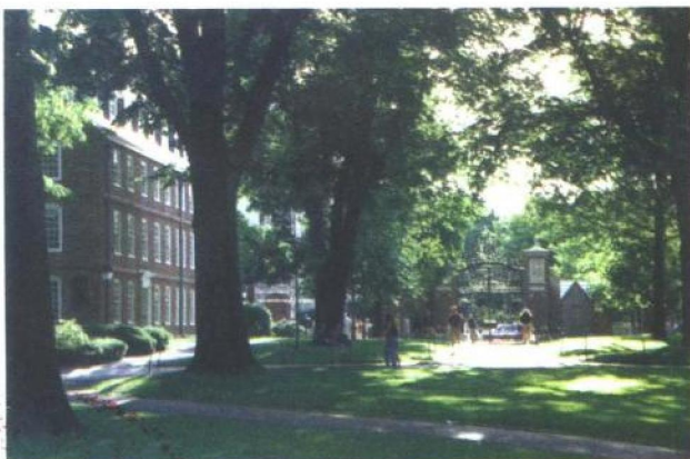
7. 哈佛大学校园一角