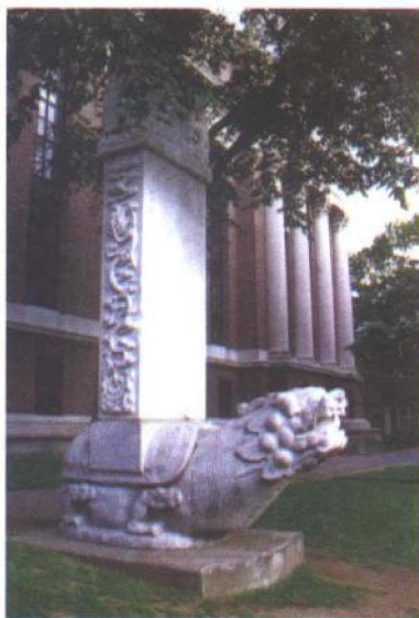
6. 1936年哈佛大学的 中国校友 捐赠给母校的 石碑 ,以庆祝 哈佛大学建校300周年。