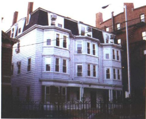
3. 林登街5号 (5 Linden Street) ，哈佛大学心理咨询中心所在地。