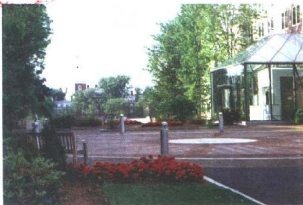
8. 哈佛大学商学院学生宿舍一角 ，这里的房租是全哈佛学生宿舍中最昂贵的。