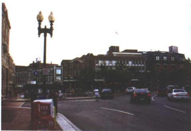
4. 哈佛广场 (Harvard Square) 一瞥，早年这里曾是来往过客们存放马匹及车辆的场所，现已成为波士顿的旅游观光热点。