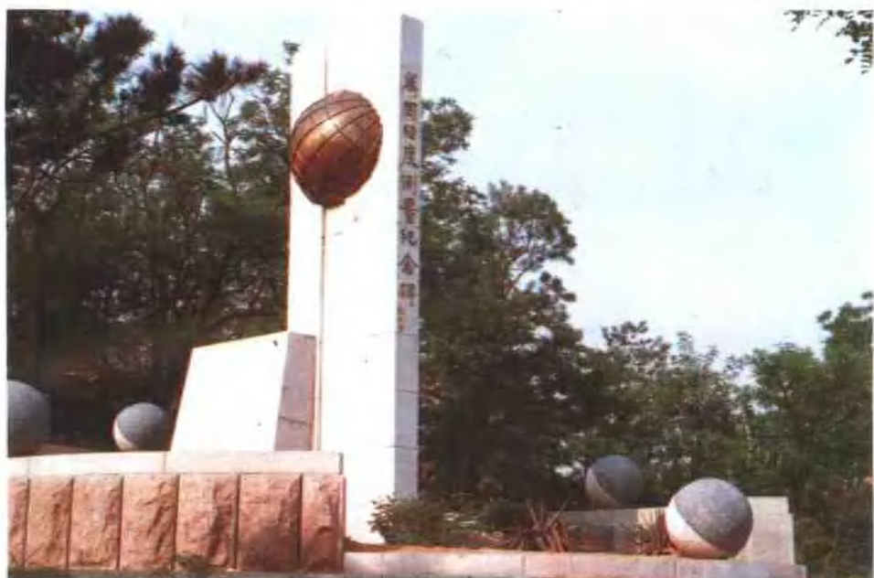
青岛万国经度测量纪念碑