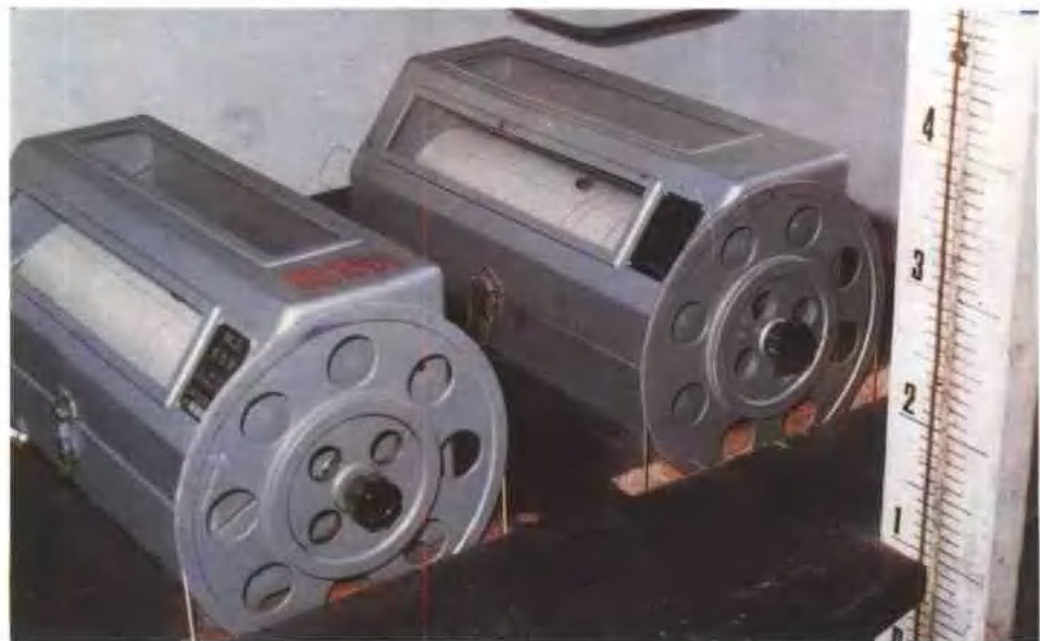
处于工作状态的国产瓦尔代式验潮仪