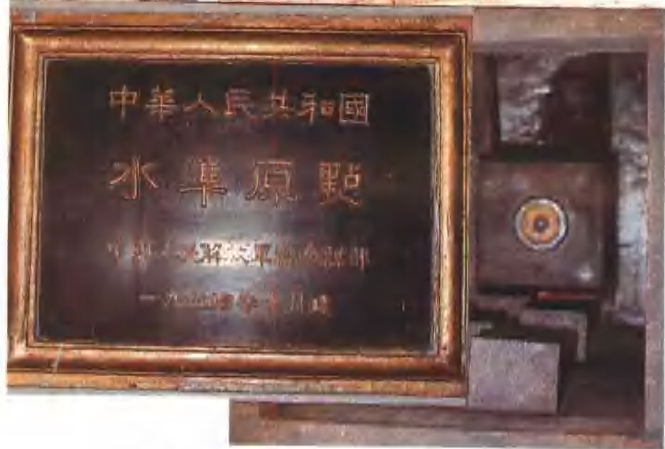
青島水準原點——中華人民共和國統一高程起算點