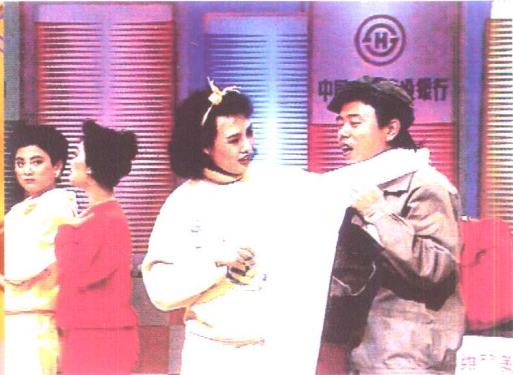
潘长江与安冬等三歌星表演《三星发廊》