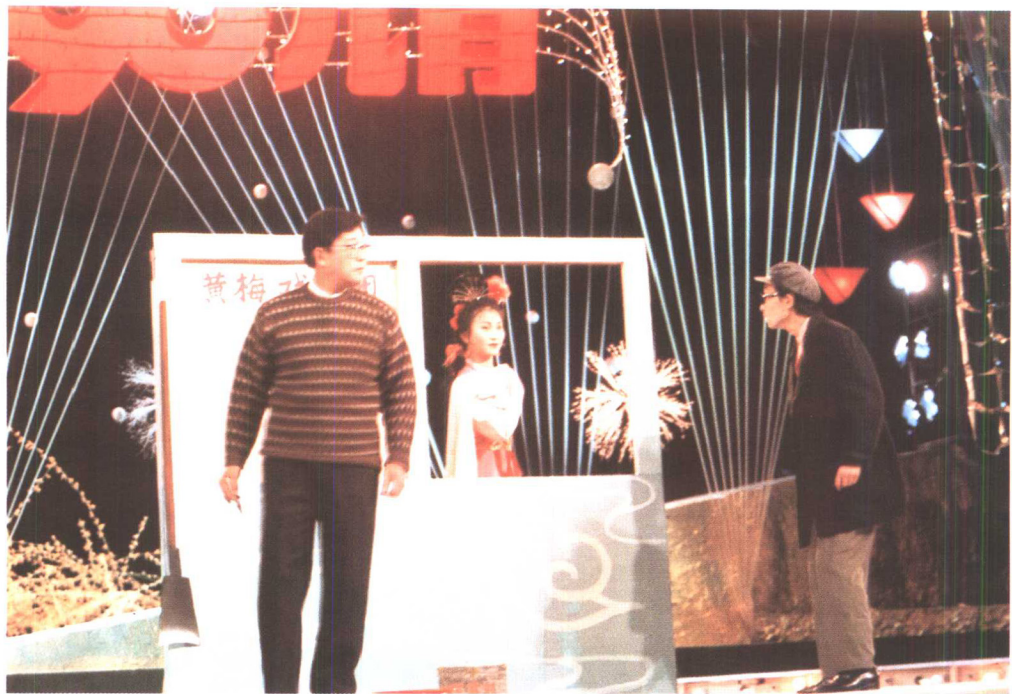
与巩汉林同黄梅戏演员表演《改戏》