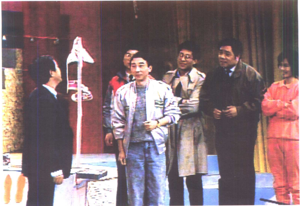
冯巩、牛群、赵忠祥、李扬、鞠萍、韩乔生表演《卖鞋》