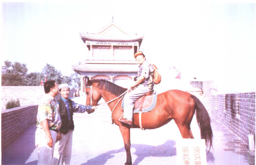
与牛振华、巩汉林表演《旅游照相》