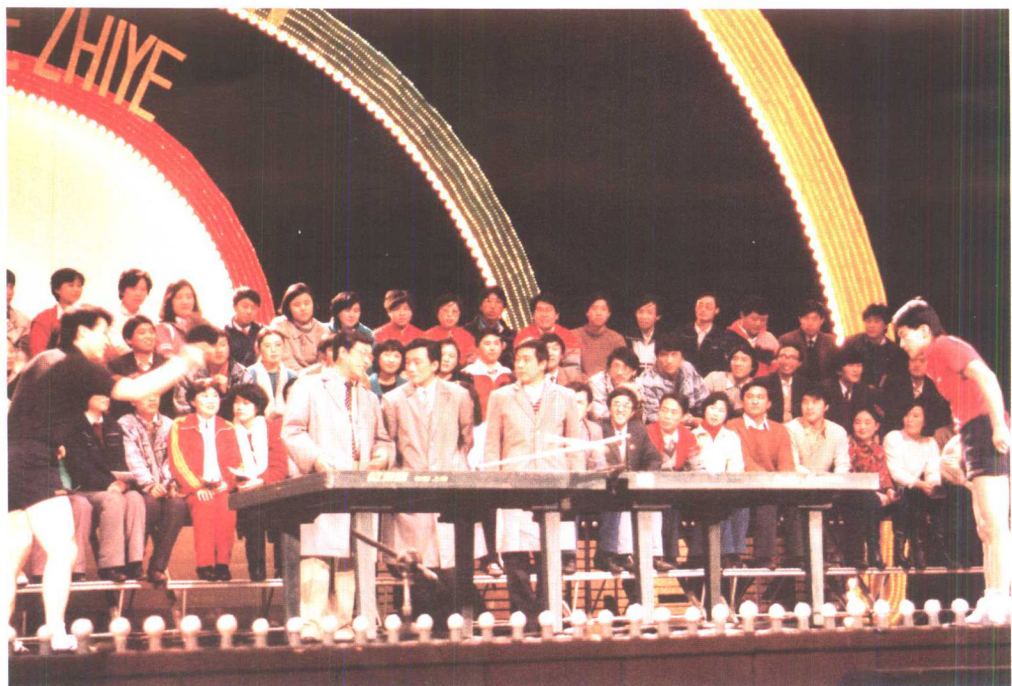
与侯跃文、石富宽，世界乒乓球冠军陈新华、范长茂表演《名人的烦恼》