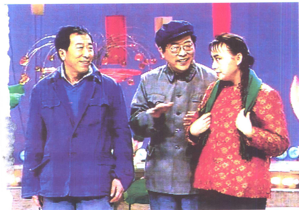
与宋丹丹、雷恪生表演《懒汉相亲》