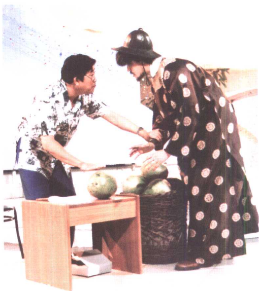
与外籍演员表演《卖西瓜》