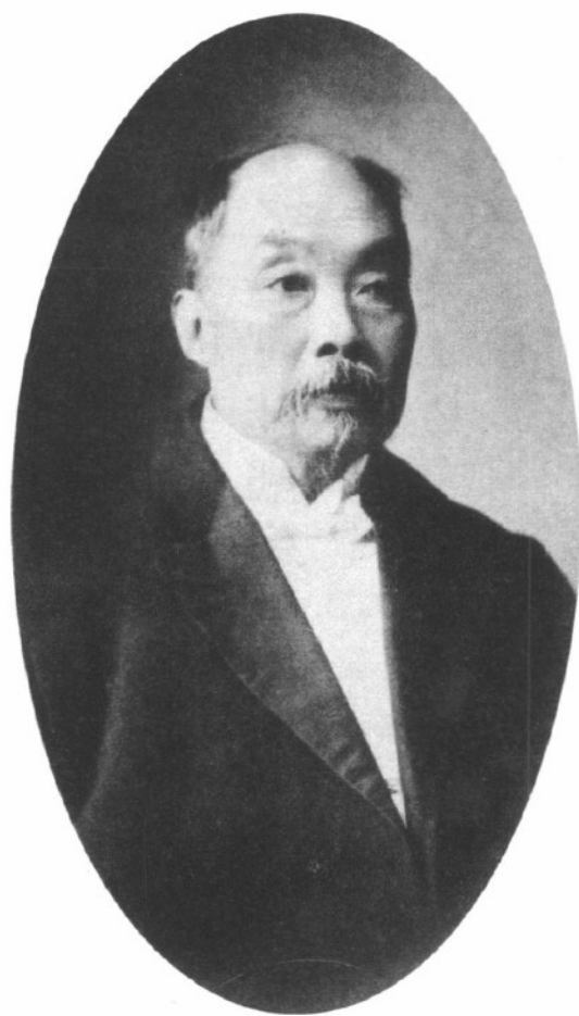
张睿 (1853—1926) 肖像 时年六十五岁