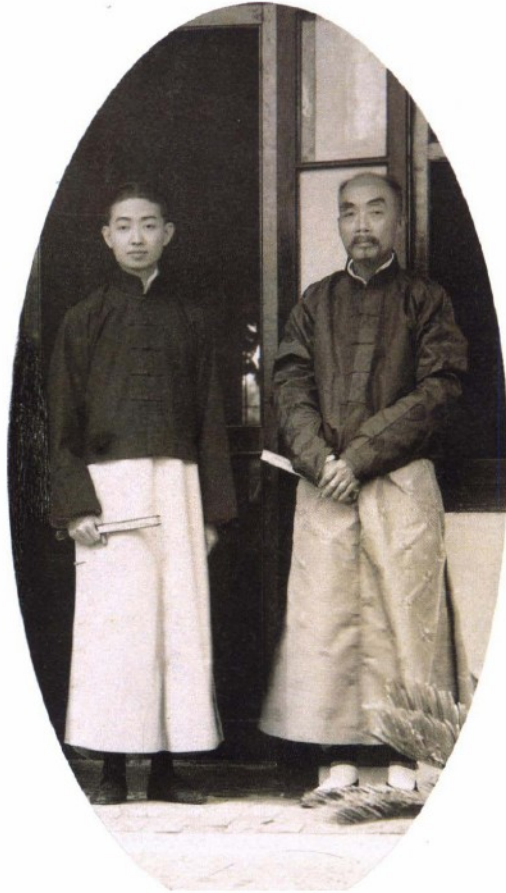
张春与梅兰芳在南通合影 1922年6月19日