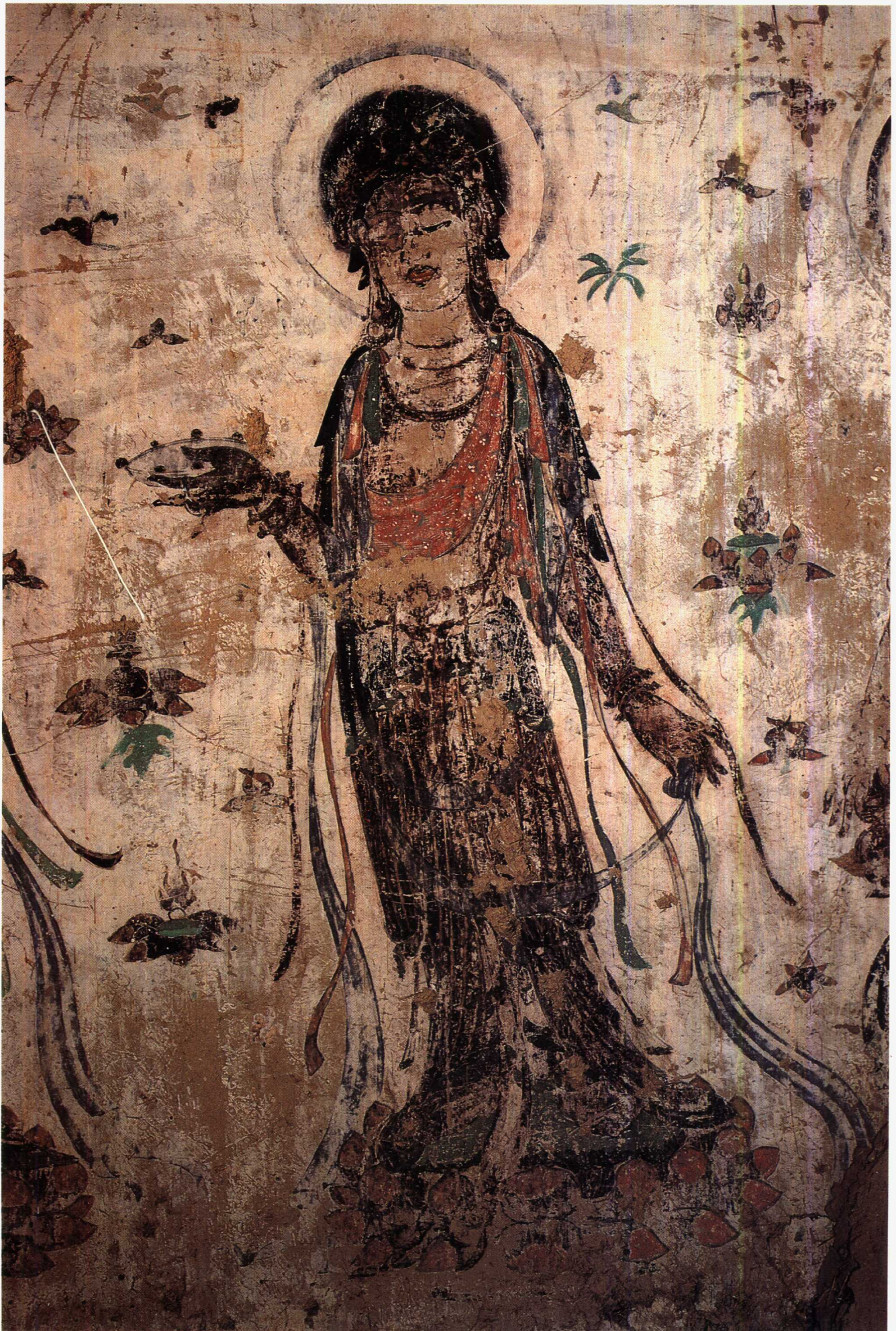
7 第401窟 北壁东侧 供养菩萨 初唐