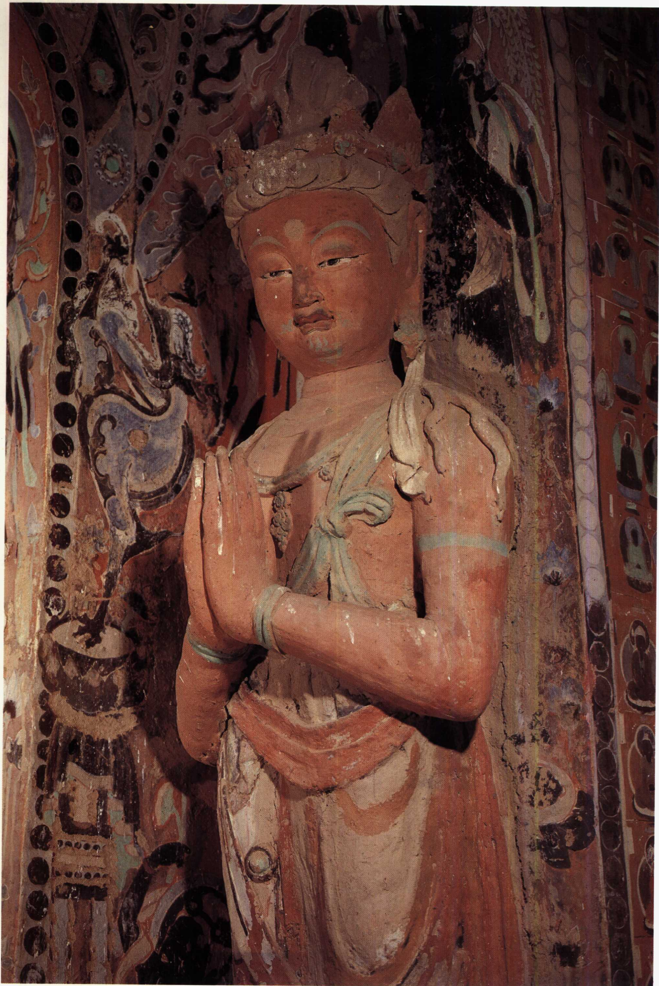
1 第204窟 西壁龕内北側 菩薩(部分) 初唐