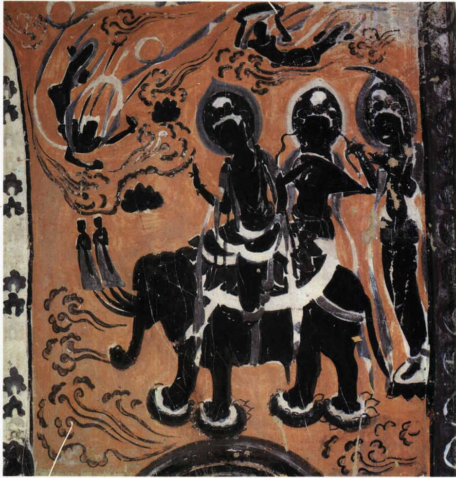
3 第375窟 西壁北侧 乘象入胎 初唐