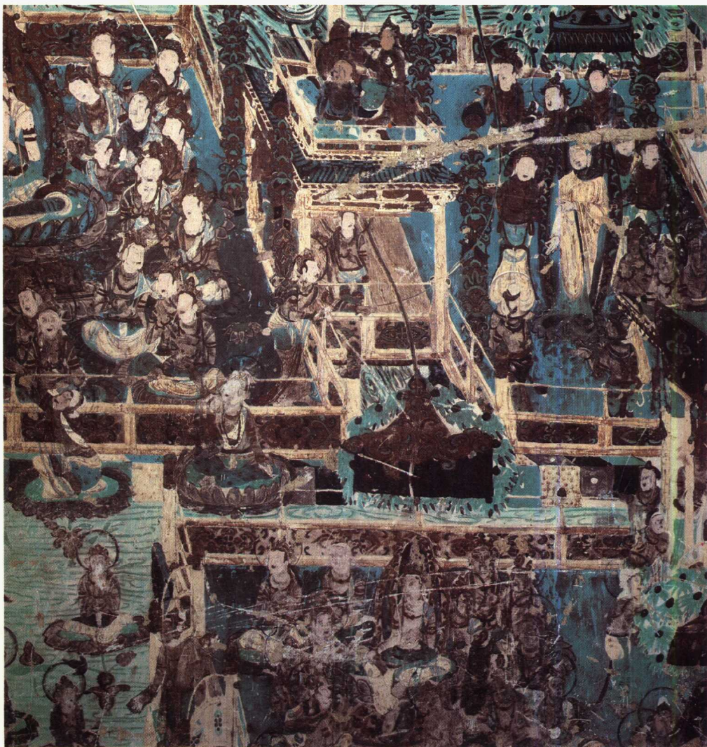
6 第341窟 北壁 弥勒经变(部分) 初唐