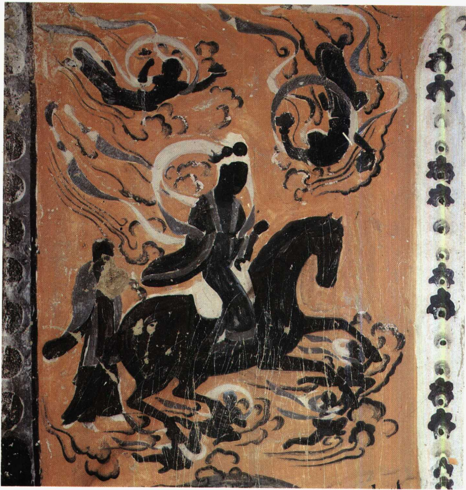
2 第375窟 西壁南侧 逾城出家 初唐