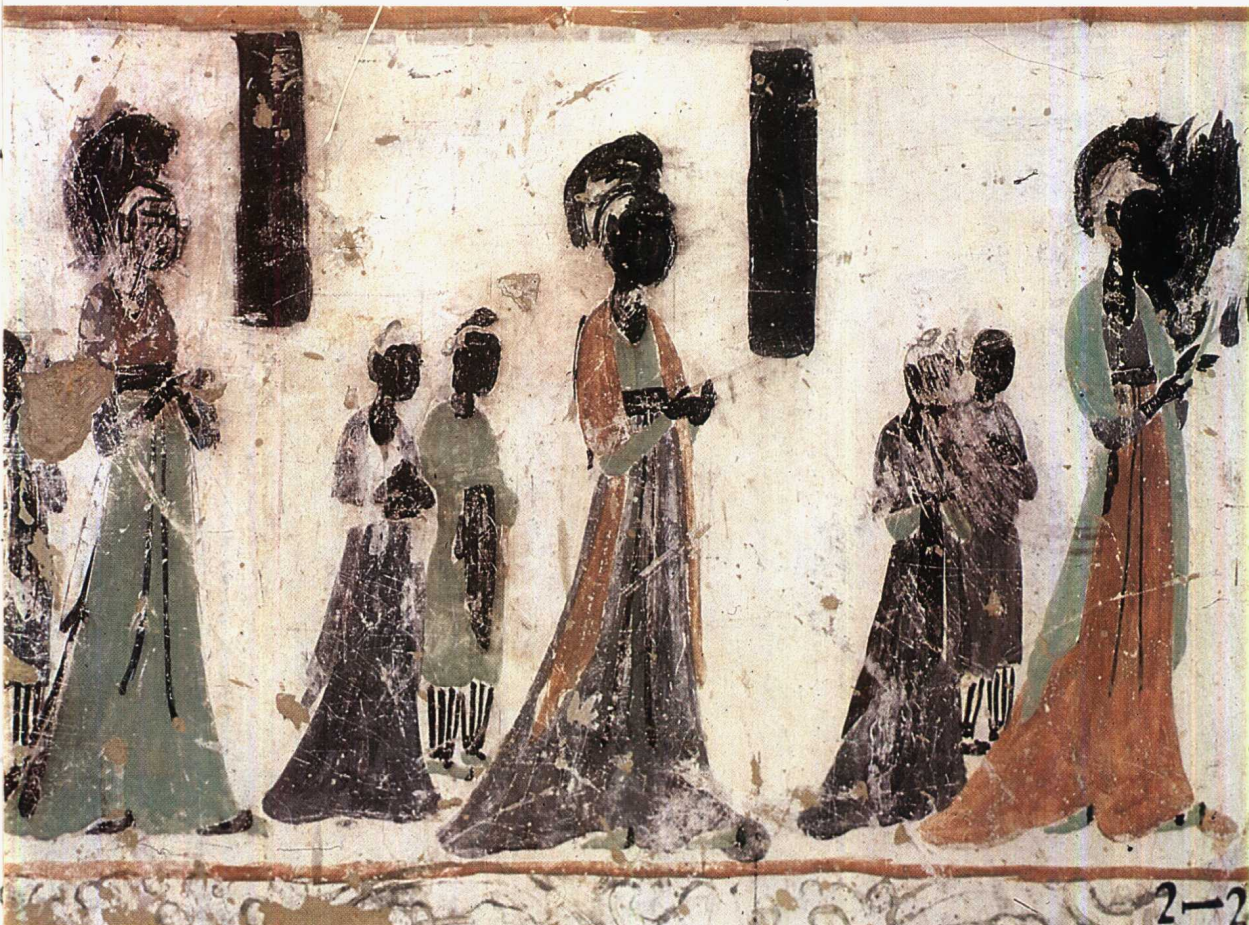
4 第375窟 南壁下部 女供养人 初唐