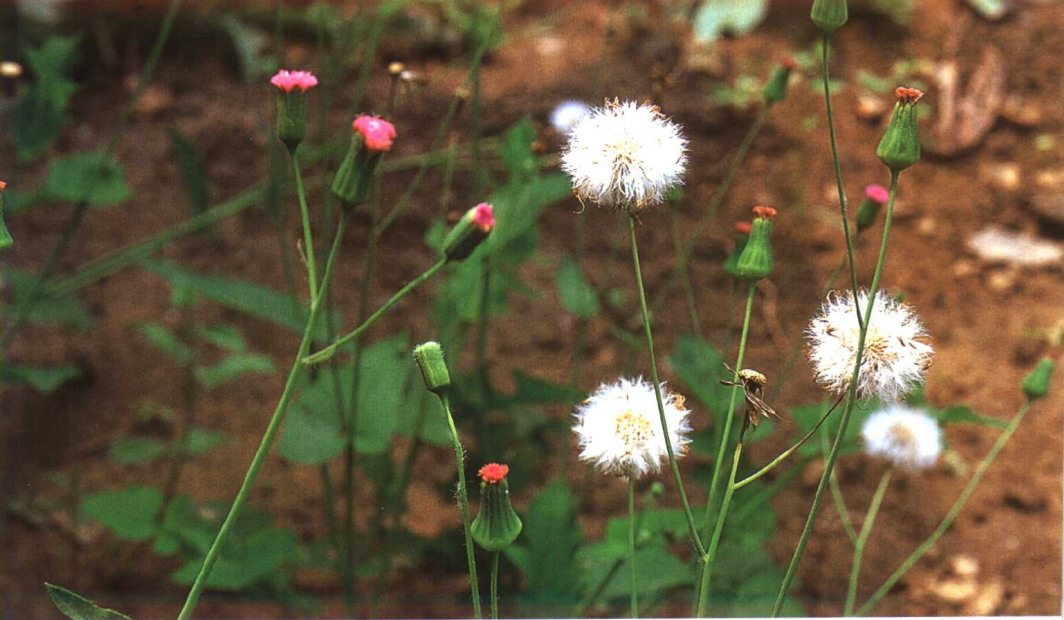
原植物 一点红 Emilia sonchifolia (L.) DC.