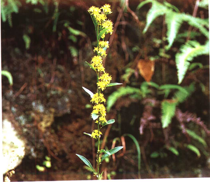
原植物 一枝黄花 Solidago decurrens Lour.