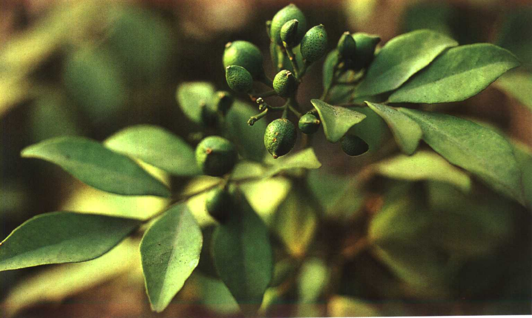
原植物 九里香 Murraya paniculata (L.) Jack.