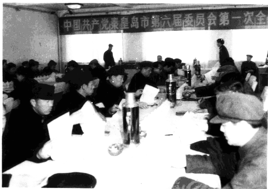
上：中国共产党秦皇岛市第六次代表大会 下：中国共产党秦皇岛市第六届委员会第 一次全体会议