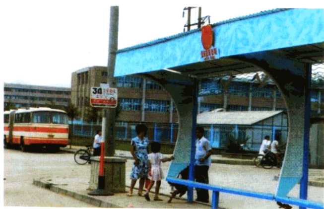
下: 秦皇岛市青年“双增双节” 成果展