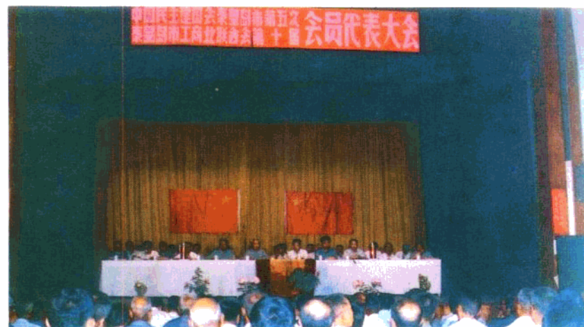
上：民革秦皇島市黨員 代表大會 中：民盟秦皇島市代表 大會 下：民建秦皇島市會員 代表大會