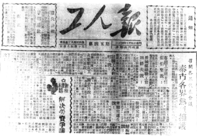
秦皇岛解放初期的《工人报》