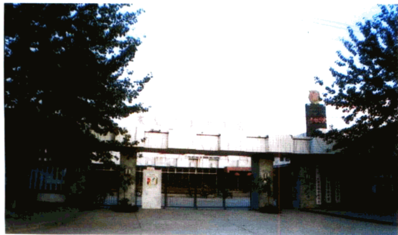
上: 中国共产主义青年团秦皇岛市 委员会