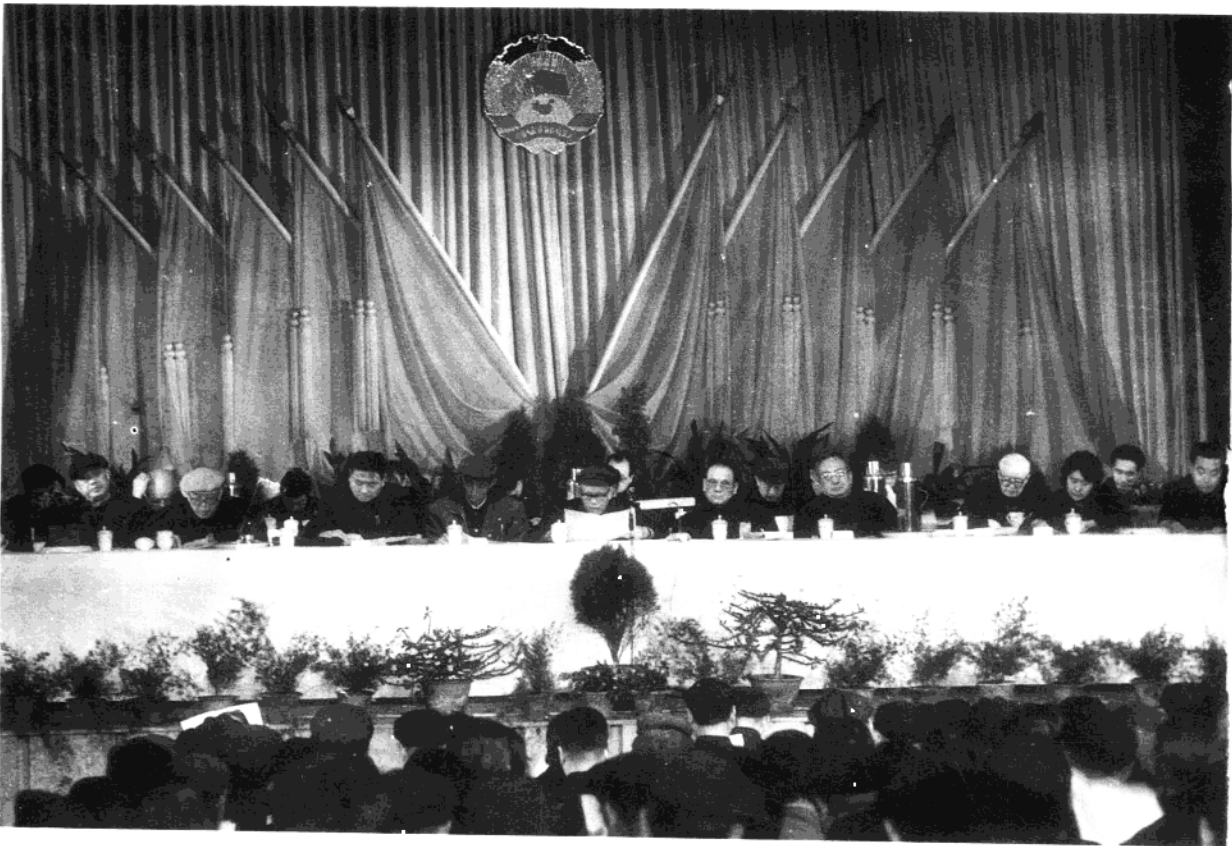
中国人民政治协商会议河北省秦皇岛市委员会