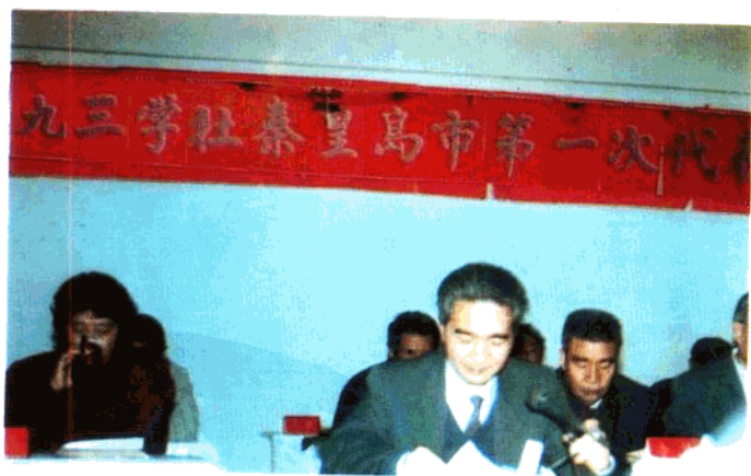
上: 农工民主党秦皇岛市代表大会 中: 民主促进会秦皇岛市代表大会 下: 九三学社秦皇岛市代表大会