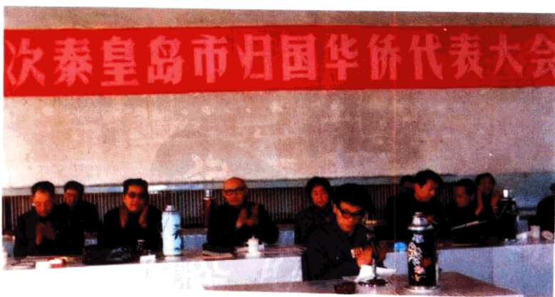
上：秦皇岛市科学技术协会第四次代表大会 中：秦皇岛市文学艺术工作者第二次代表大会 下：秦皇岛市归国华侨第二次代表大会