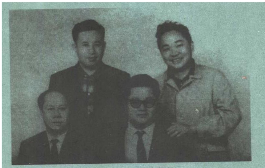
左一 卧龙生,左三 诸葛青云,右一 古龙。