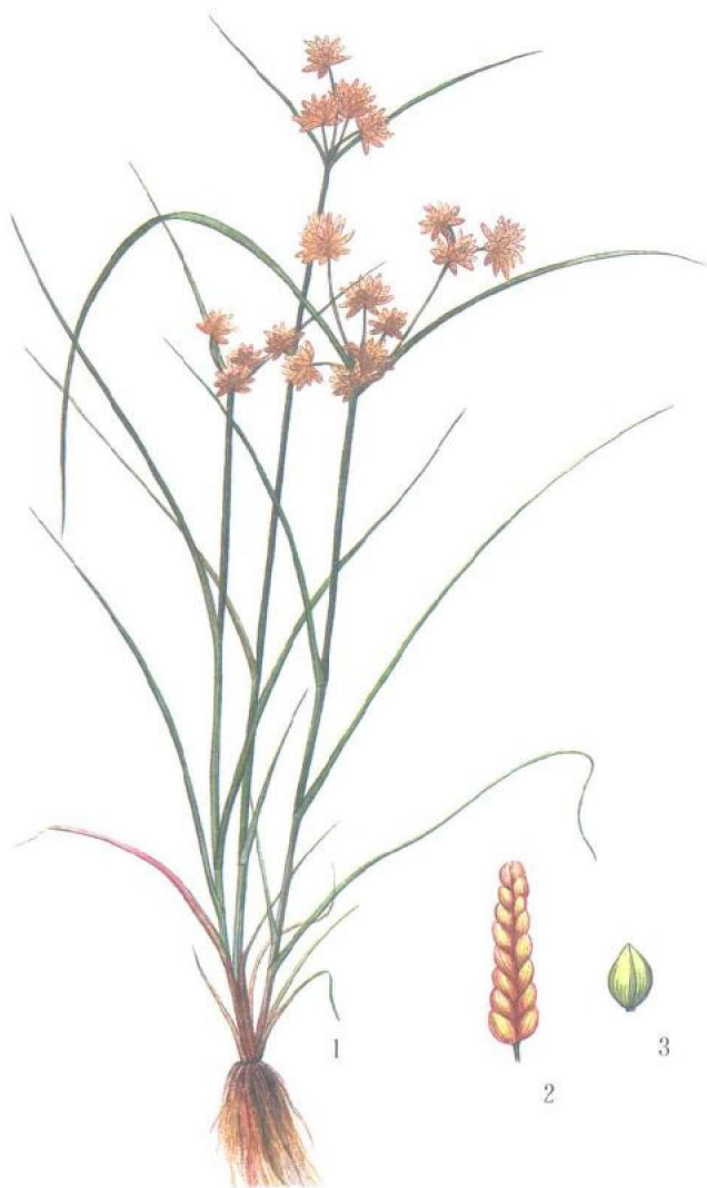
图2 球穗莎草 1. 植株; 2. 小穗; 3. 小坚果