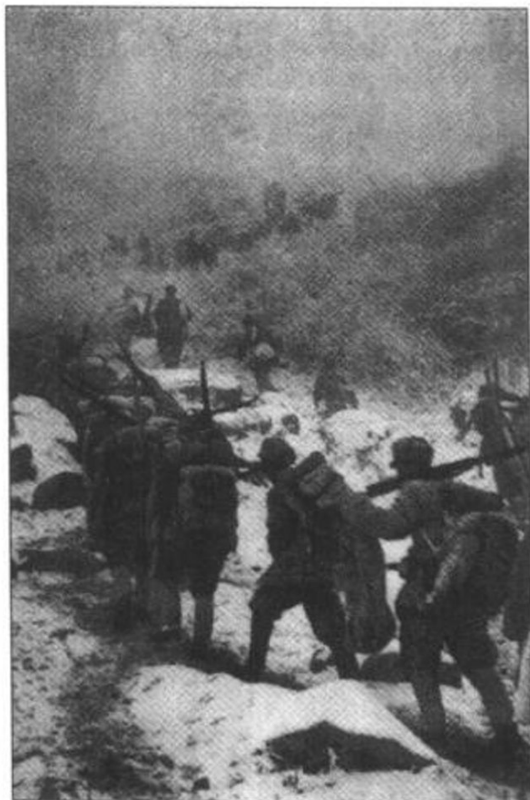
▲62军部队冒着风雪严寒,追歼敌胡宗南部。