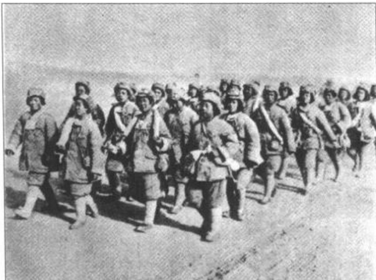
◀ 进军南疆的女兵, 行进在戈壁滩上。