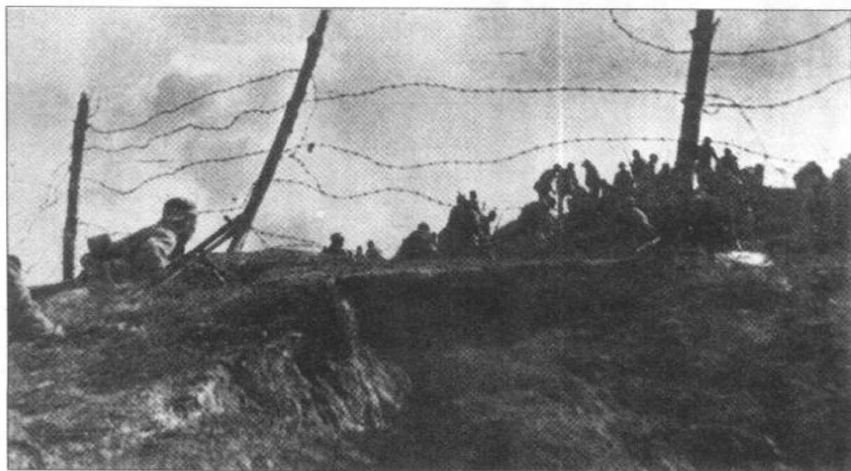
▼ 1947年3月,西北我军主动 放弃延安,诱敌深入,取得了青化砭、 羊马河、蟠龙三战三捷。图为我军在 集玉崩敌阵地上捕捉俘虏。