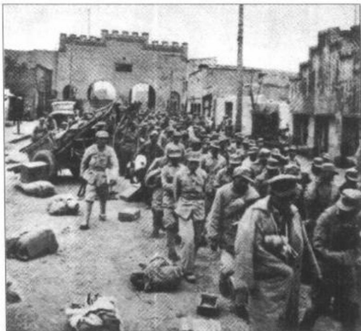
► 一野解放兰州俘虏 敌军之一部。