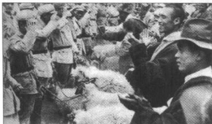
◀ 藏族同胞热情慰问 亲人解放军。