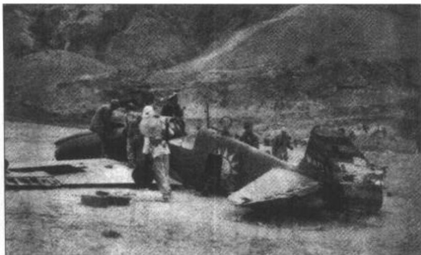
▶ 蟠龙战役中被 我军击落的敌机。