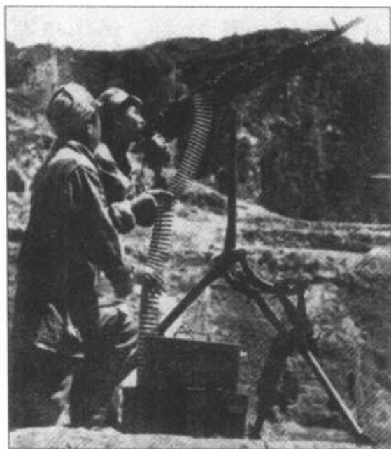
◀ 在青化砭战役中,我军机枪手 向敌机射击。