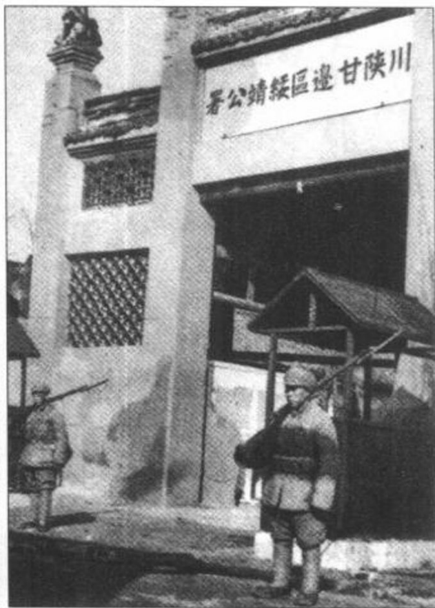
▲1949年12月6日,61军占领敌川陕甘边区绥靖公署。