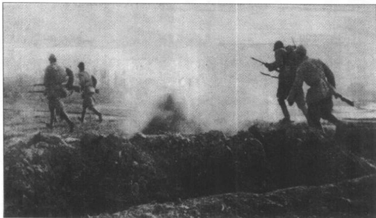
▲第一野战军在秦岭围歼拒绝投降的胡宗南部。