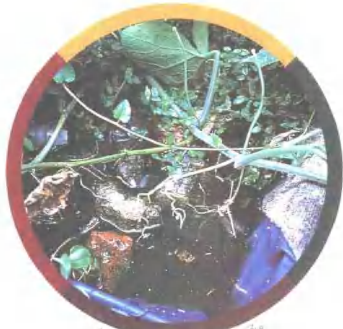
▲ 流动的水也较容易繁殖种子。