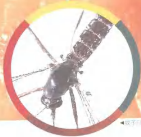
▲蚊子只有一对翅膀（前翅），后翅退化为平衡棒。