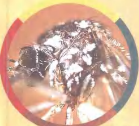
▲蚊子的眼睛是复眼。