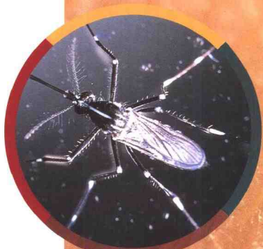
▲ 雌蚊触角上的毛短而稀疏。