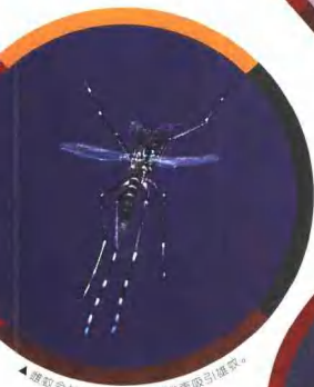
▲雌蚊会拍动翅膀，发出嗡嗡声吸引雄蚊。