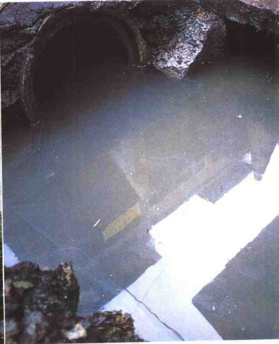
▲有的蚊子会把卵产在稻田里。