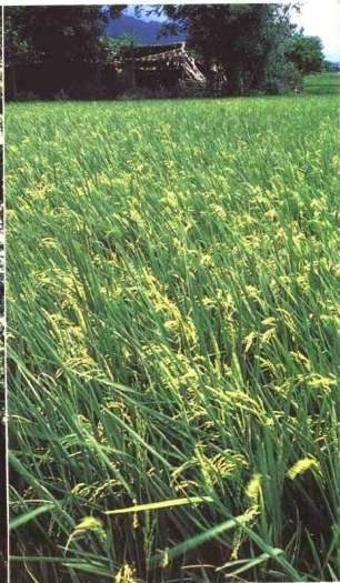
▲ 稻田里常可看到蚊子。