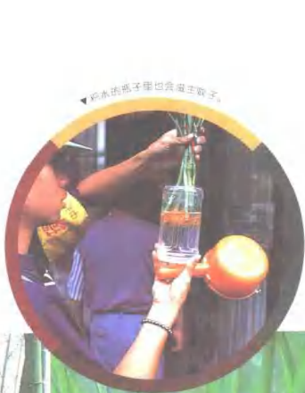
▼ 瓶水的瓶子里也会滋生种子。