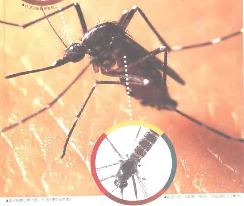
▲蚊子的嘴巴像针管，不用时便收在鞘里。