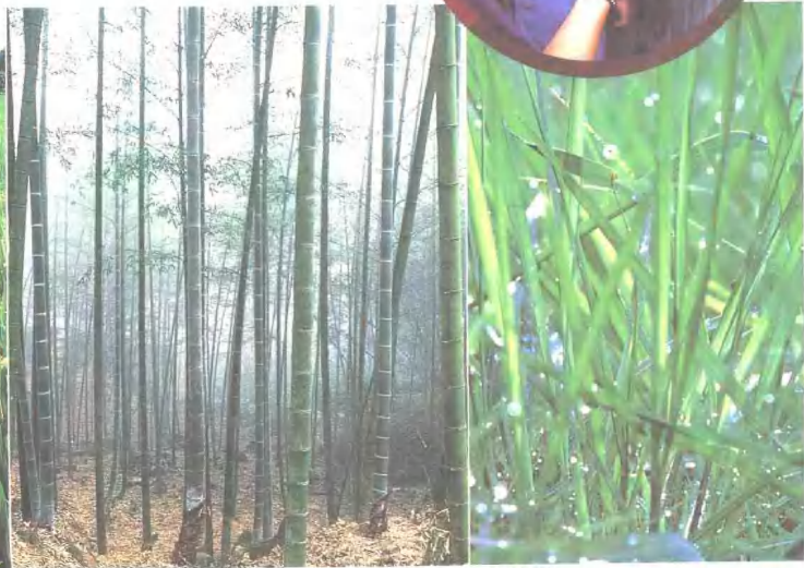
▲ 竹林里常聚集很多种子。