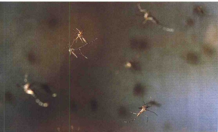
▲一群雄蚊在空中飞舞，吸引雌蚊来交配。