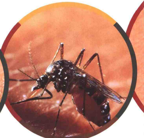
▲蚊子吸饱了血，肚子圆滚滚。