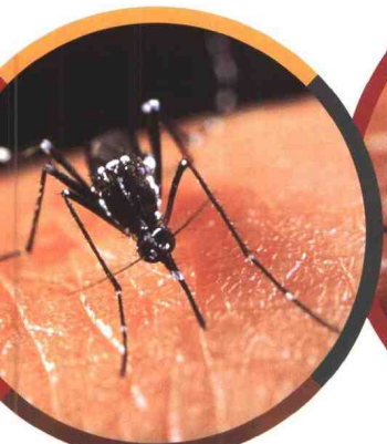
2 ▲蚊子伸出长长的口器吸血。