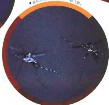
▼雄蚊和雌蚊互相吸引一起飞翔。