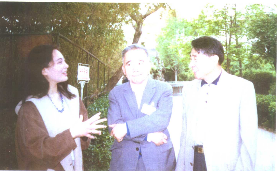
与国内著名司法精神病学家在一起