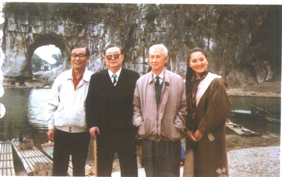
与国内著名法医病理学家在一起