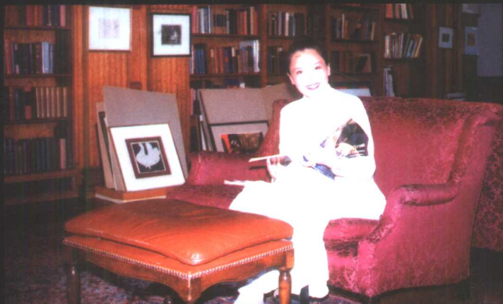
作者在美国 BOKELI 大学图书馆