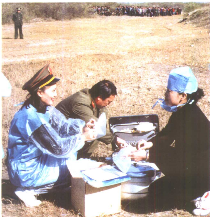
在开棺 验尸前 的准备 工作中