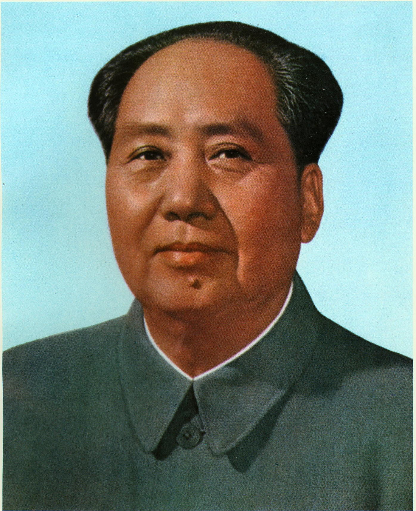
伟大的领袖和导师毛泽东主席