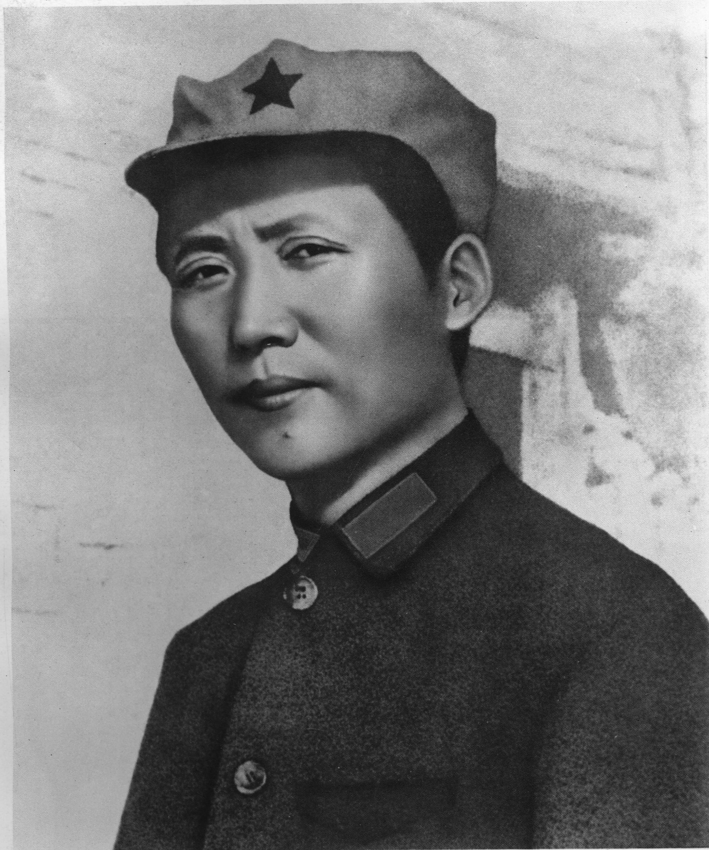
伟大领袖毛主席 (1936年在陕北)