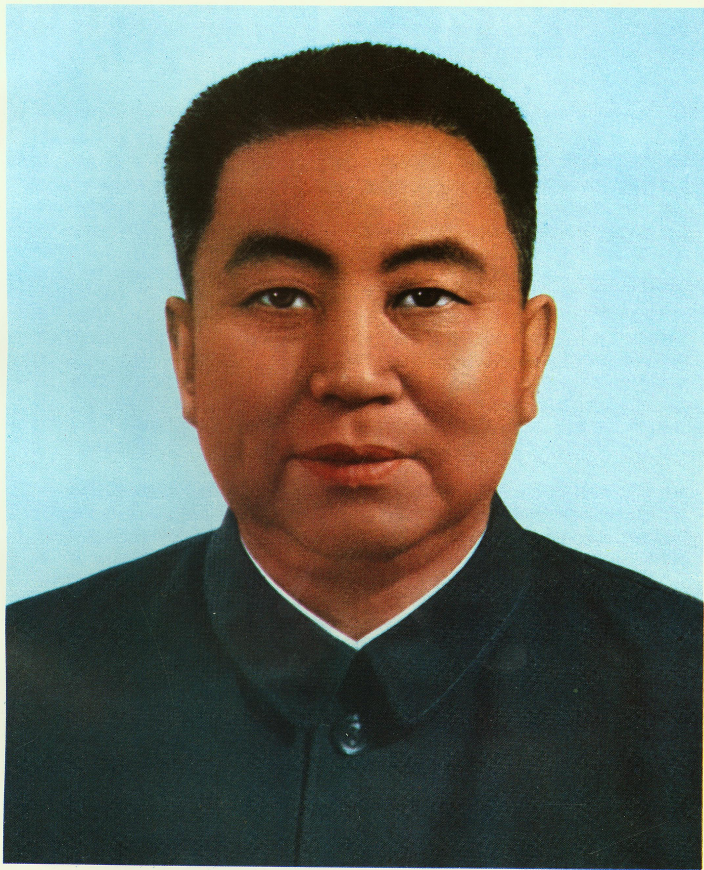
英明领袖华国锋主席