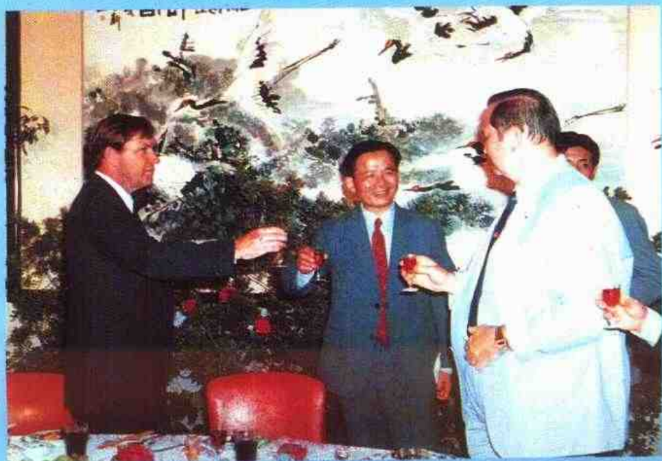
河南省与美国堪萨斯州结为友好省州