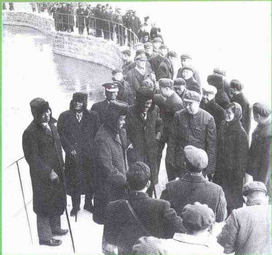
一九七四年赞比亚总统卡翁达一行参观林县红旗渠