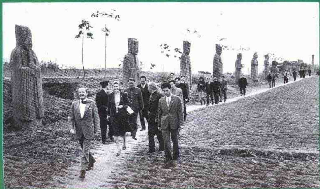
1983年欧洲共同体委员会主席托恩一行到巩县宋陵参观