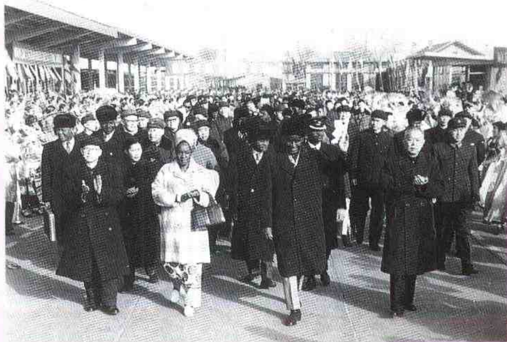
1974年赞比亚总统卡翁达和夫人及其他贵宾，由李先念副总理陪同到达郑州，受到省、市负责同志和省会两千多名群众的热烈欢迎