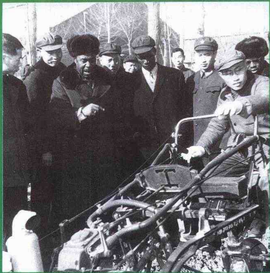
一九七二年几内亚共和国总理贝阿沃吉一行在郑州拖拉机厂参观