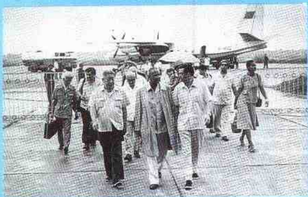
1983年省外事办公室主任蔡流海、省教育厅副厅长赵光弟到机场迎接联合国教科文组织总干事姆博一行