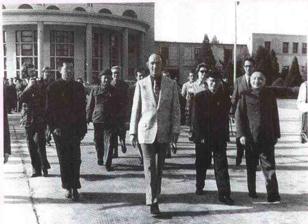
1973年加拿大总理特鲁多由邓小平副总理陪同离郑前往桂林，省、市负责人到机场送行