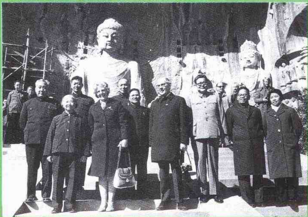
1974年丹麦首相哈特林一行参观洛阳龙门石窟