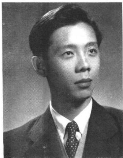
朱德熙先生在保加利亚（1952年）