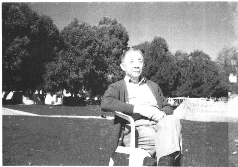
朱德熙先生在美国斯坦福（1992年）