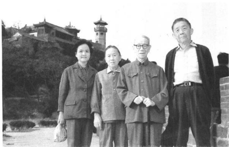
朱德熙先生(右一)与吕叔湘先生(右二)在一起